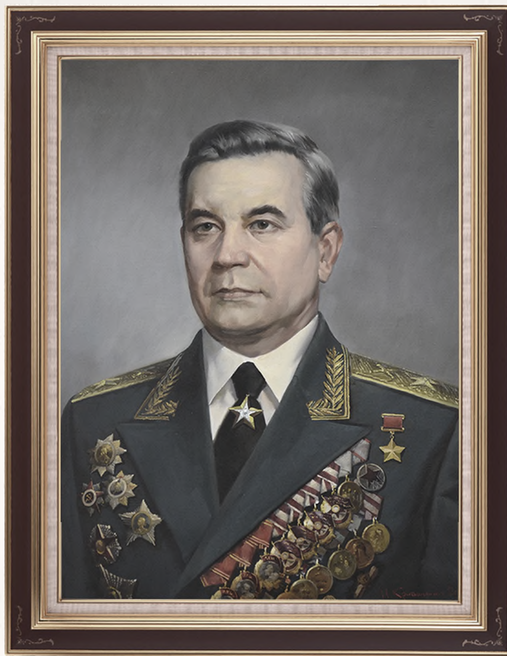
Крившинко Иван Петрович «Митрофан Неделин»

Первым главнокомандующим Ракетными войсками был назначен Герой Советского Союза главный маршал артиллерии Митрофан Иванович Неделин. Получивший колоссальный боевой опыт в годы войны, поэтапно пройдя все командные должности, он внес большой вклад в создание Ракетных войск стратегического назначения, разработку, испытание и принятие на вооружение ракетно-ядерного оружия.