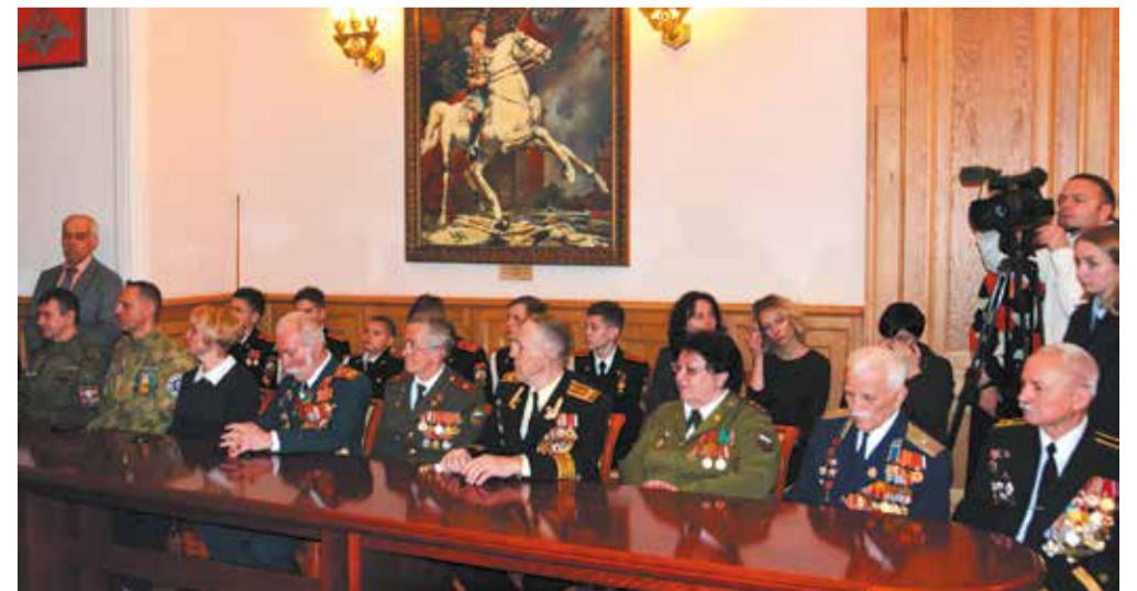
Пресс-секретарь Комиссии Совета ОООВ ВС РФ по патриотическому воспитанию и пропаганде боевых традиций Вооруженных Сил Российской Федерации Е. Коптелова