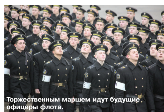
Торжественным маршем идут будущие офицеры флота.

Всего планом подготовки предусмотрено более 15 тренировок на территории института, а также 2 тренировки и генеральная репетиция на площади Победы в Калининграде. Общее количество личного состава парадных расчетов составит более 2100 человек. Кроме того, прибудет рота 120-й механизированной бригады из Белоруссии.