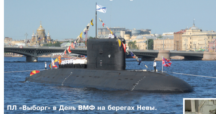
ПЛ «Выборг» в День ВМФ на берегах Невы.

Её история вмещается в более чем тридцать томов вахтенных журналов, где до минуты зафиксированы все события её морской биографии от рождения до нынешних дней. Сегодня морские часы в её центральном посту отсчитывают тридцать третий год службы. И если сложить пройденные мили за предыдущие годы и проложить их последовательно по дуге экватора, то эта линия как минимум разок обогнет весь земной шар. Но в биографии экипажа подводной лодки «Выборг» был и такой период, когда она покоилась в плавничалах не у дел и вдалеке от жизни флота. Правда, даже тогда костяк экипажа занимался боевой подготовкой, и, конечно же, надеялся, что дни их субмарины ещё не сочтены. Целью три года ПЛ «Выборг» ремонтировалась в Кронштадтском морском заводе. Но судоремонтники постарались на славу. Выход подводной лодки из ремонта был заметным событием в её истории. Даже недоброжелатели на просторах Интернета сильно тревожились по поводу усиления подводной состав-