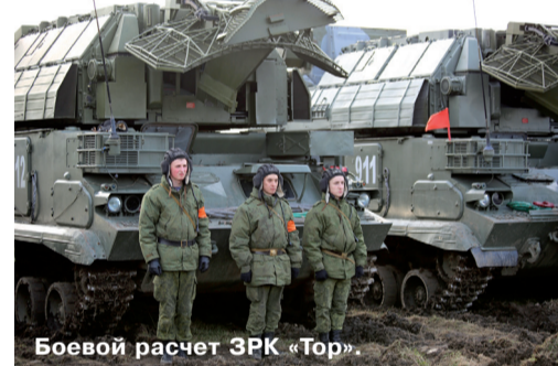
Боевой расчет ЗРК «Тор».