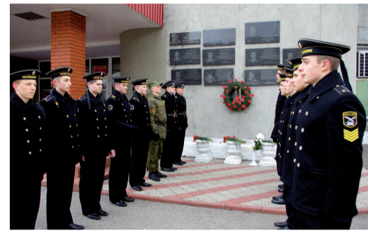
Почетный караул у мемориала погибшим выпускникам.