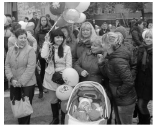
Близкие в ожидании долгожданной встречи.