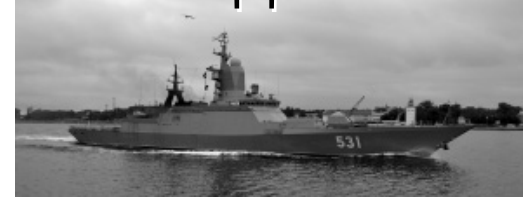
Вчера в рамках празднования 100-летия объединения ирландского народа начался визит в эту республику корвета ВФ «Сообразительный».