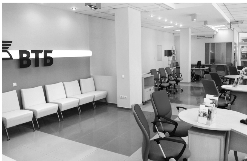
Новое отделение ВТБ Банка ждет первых клиентов