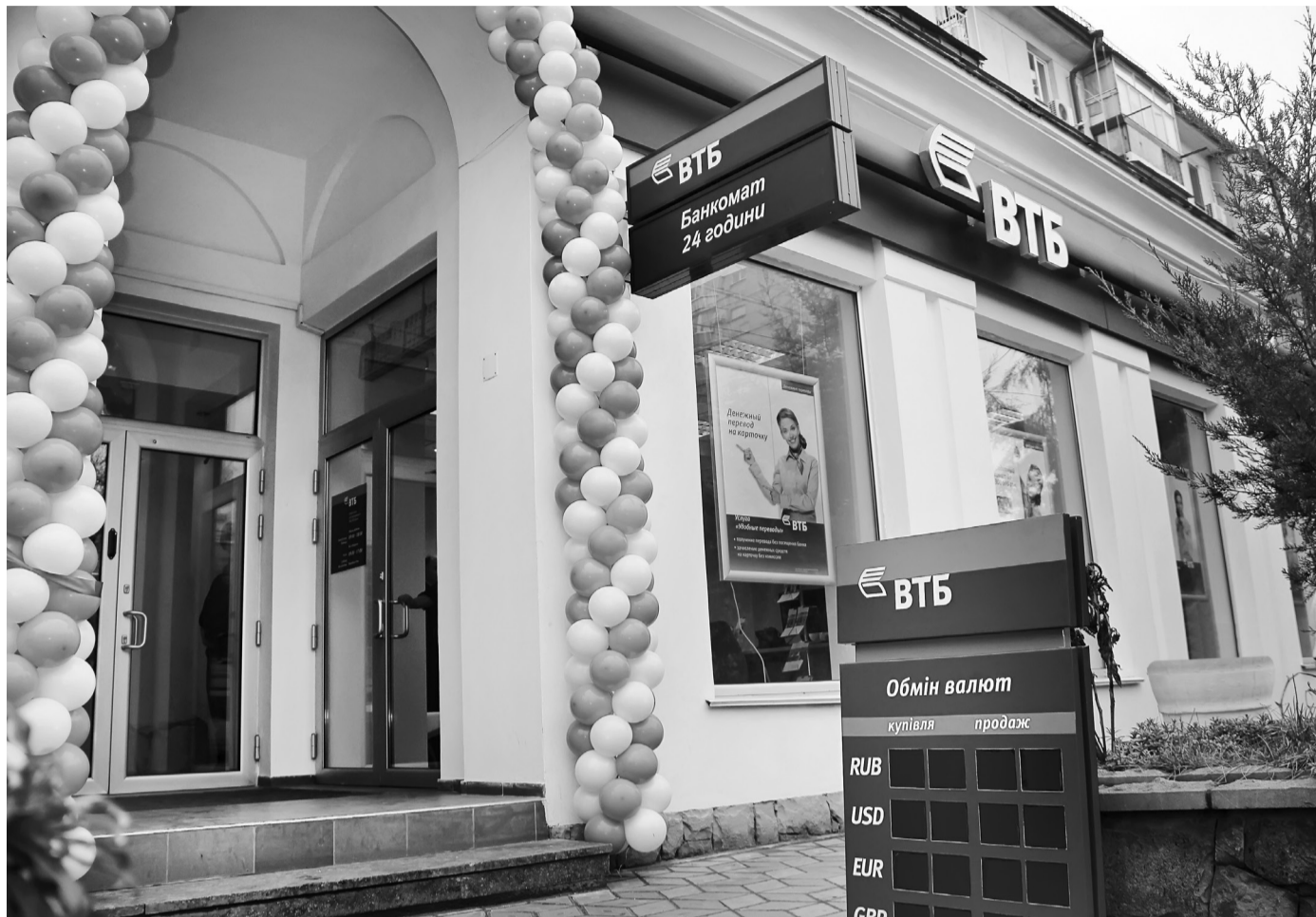
Режим работы: с 9:00 до 18:00, пн.-пт.

Торжественное открытие нового отделения Крымской региональной дирекции ВТБ Банка по адресу: г. Севастополь, пр. Генерала Острякова, 60, состоялось 29 января. На мероприятии присутствовали руководители предприятий и организаций, а также клиенты и представители Черноморского флота Российской Федерации.