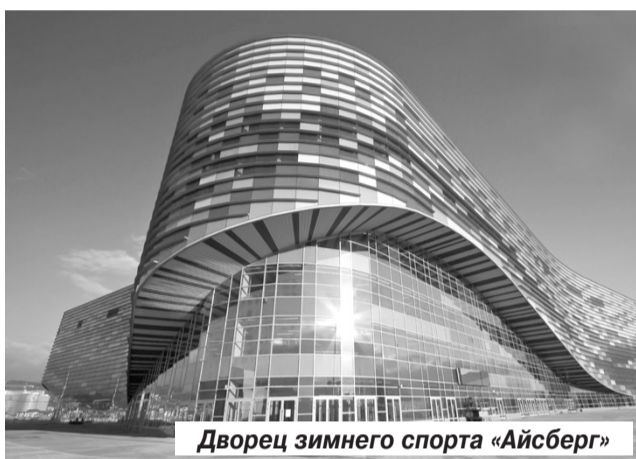
Дворец зимнего спорта «Айсберг»