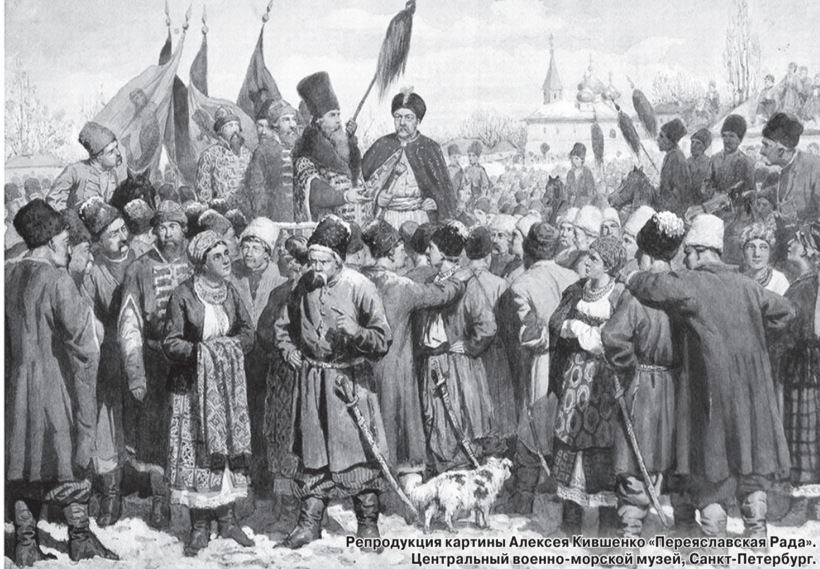
Репродукция картины Алексея Кившенко «Переяславская Рада». Центральный военно-морской музей, Санкт-Петербург.

Кроме того, от гетмана отвернулся, прельстившись деньгами польского короля, до того его главный союзник в войнах с поляками татарский хан. В своём историческом труде «Богдан Хмельницкий» Николай Костомаров