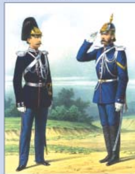
Жандармские командиры в парадной и походной формах. 1872 г.