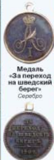
Медаль «За переход на шведский берег» Серебро

В ХОДЕ Русско-шведской войны 1808 – 1809 гг. русским командованием намечалось в 1809 году перенести боевые действия на территорию Швеции, овладеть Стокгольмом и уничтожить шведский флот.