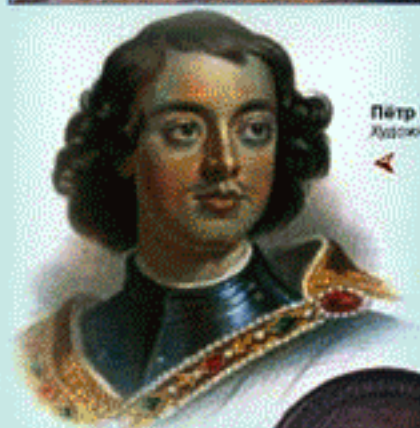
Петр I Художник Г. Нейстер

20 (30) октября 1696 года по настоянию Петра I Боярская дума издала указ с судьбоносным решением: «Морским судам быть!» С тех пор этот день по праву считается датой рождения регулярного Российского флота.