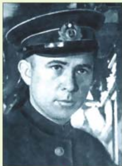
▲ А.И. Маринеско фото, вероятно, 1944 года