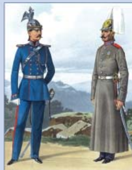
Обер-офицер лейб-гвардии Жандармского полуэскадрона и рядовой Жандармского полка в парадной форме. 1857 г.