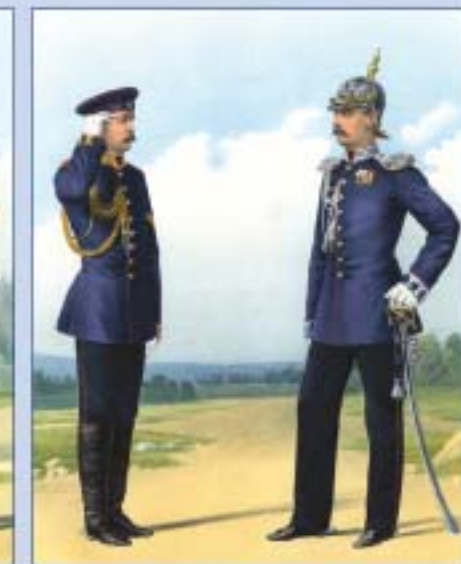
Лейб-гвардии Жандармский полуэскадрон. 1874 г.