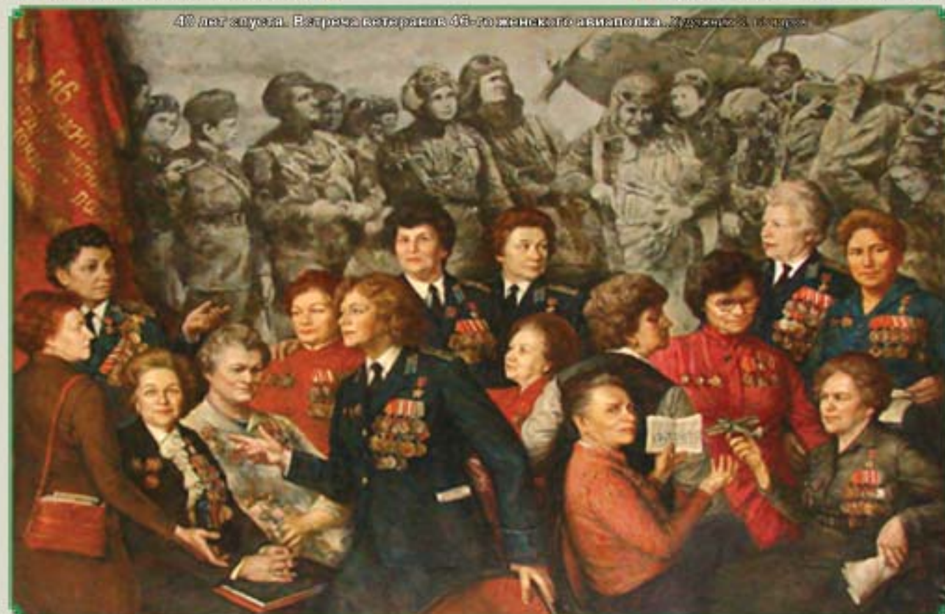
40 лет спустя. Встреча ветеранов 46-го женского авиаполка. Музей в Тамане. Фото из Центрального дома авиации и космонавтики РОСТО (Москва) и книг: Кибовский А.В., Степанов А.Б., Цыленков К.В. Униформа Российского военного воздушного флота: В 2 т. М., 2007. Т. 2. Ч. 1; Сила слабых. Женщины в Великой Отечественной войне 1941 – 1945 гг. СПб., 2005.