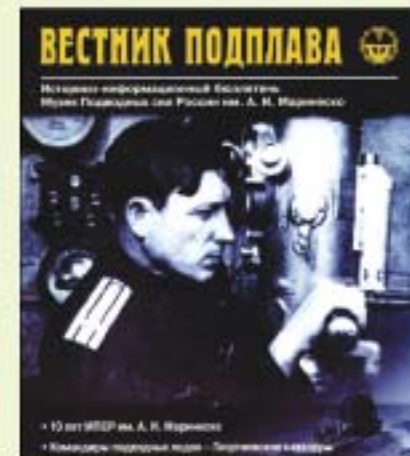
▲ Бюллетень «Вестник подплава»