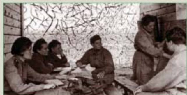
Эскадрилья на занятиях по тактике воздушного боя

Публикацию подготовила И.М. ВЕРЕТЕННИКОВА