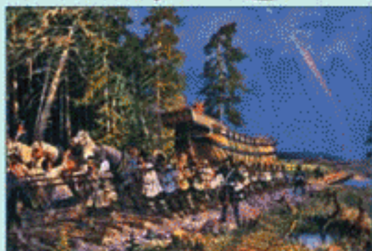
Перевод малых фрегатов «Курьер» и «Св. Дух» по Государевой дороге из Белого моря в Онежское озеро Художник В. Яков