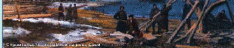
Строительство кораблей на реке Свист