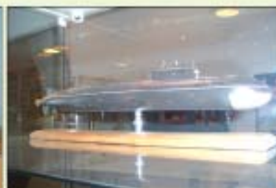
▲ ▼ Макеты подводных лодок ▲ ▼