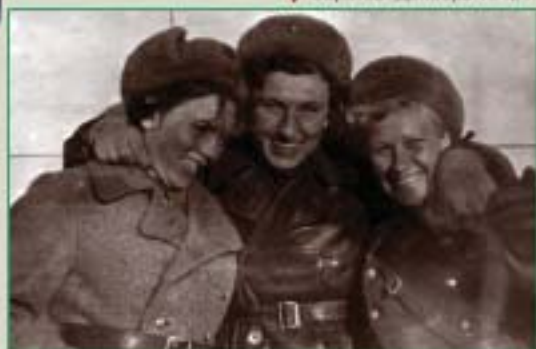
Зимняя форма одежды лётчика. 1941 – 1945 гг.