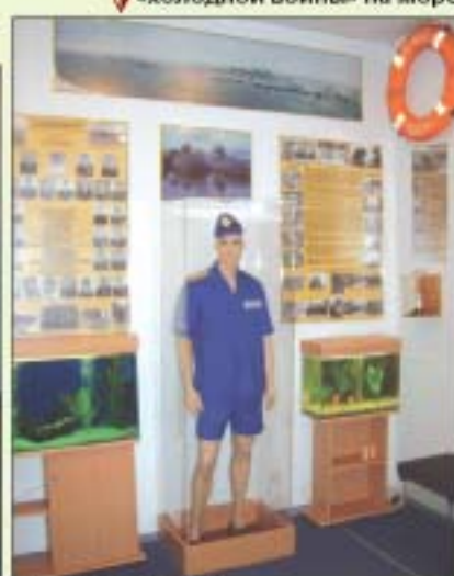
Экспозиция, посвященная периоду «холодной войны» на море ▼