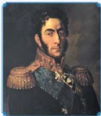
П.И. Багратион Копия с портрета художника Джорджа Дой, конец XIX в.