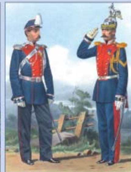
Обер-офицер и унтер-офицер лейб-гвардии Жандармского полуэскадрона в парадной форме: походной и городской. 1867 г.