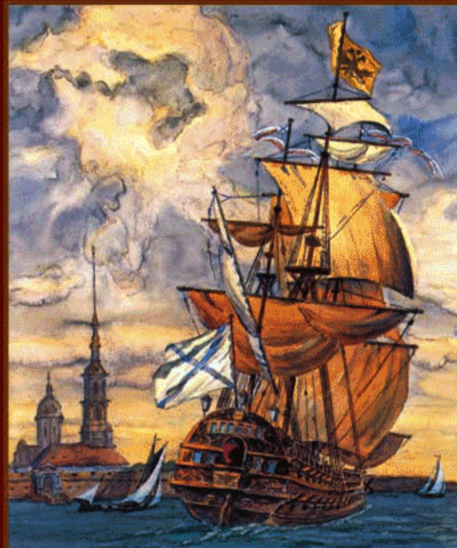
«Полтава». Первый корабль Балтийского флота Художник В.Н. Щербаков. 1712 г.

Военно-исторический журнал 2009 № 10 октябрь