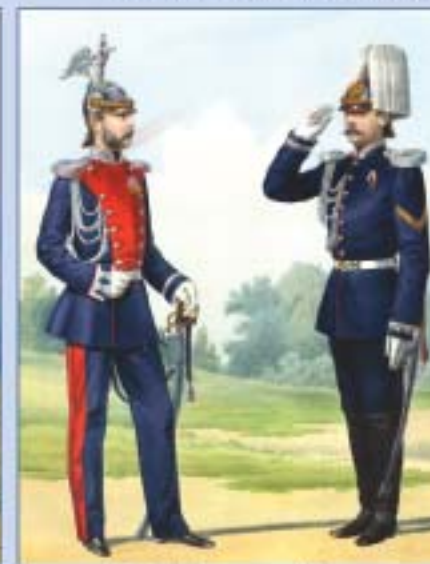
Лейб-гвардии Жандармский полуэскадрон и жандармский командир при военном округе в праздничной форме. 1874 г.