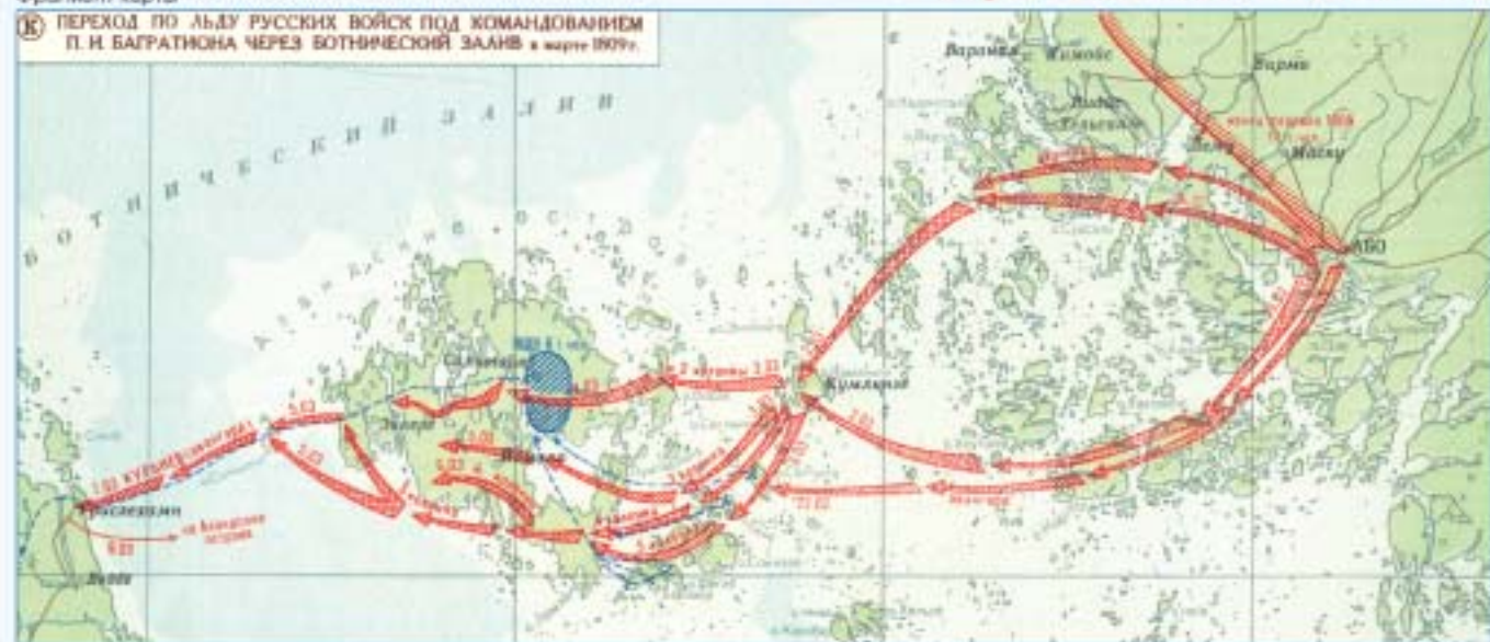
ПЕРЕХОД ПО ЛЬДУ РУССКИХ ВОЙСК ПОД КОМАНДОВАНИЕМ П.И. БАГРАТИОНА ЧЕРЕЗ БОТНИЧЕСКИЙ ЗАЛИВ в марте 1809 г.

Публикацию подготовил старший лейтенант Р.И. ЦАРФЕНОВ