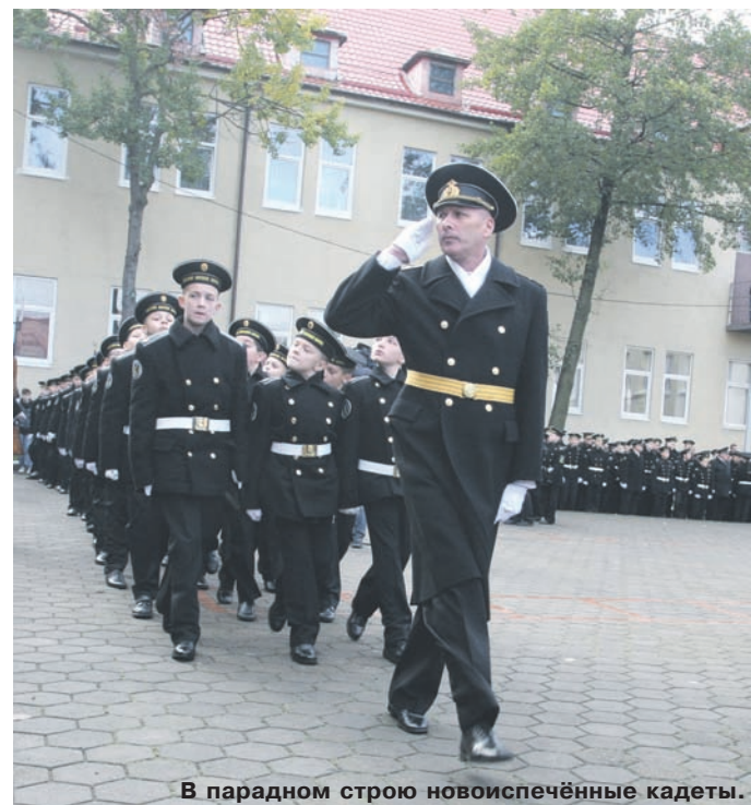
В парадном строю новоиспечённые кадеты.