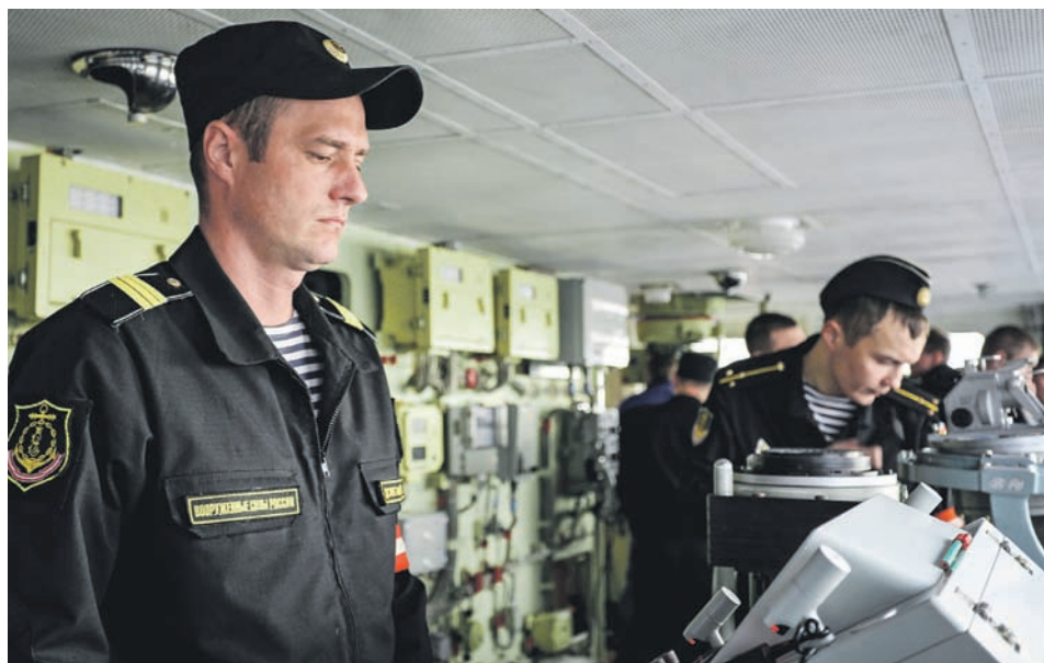
На ходовом посту новостройки.

этой серии СКР «Адмирал Эссен». Они продлятся около двух месяцев.