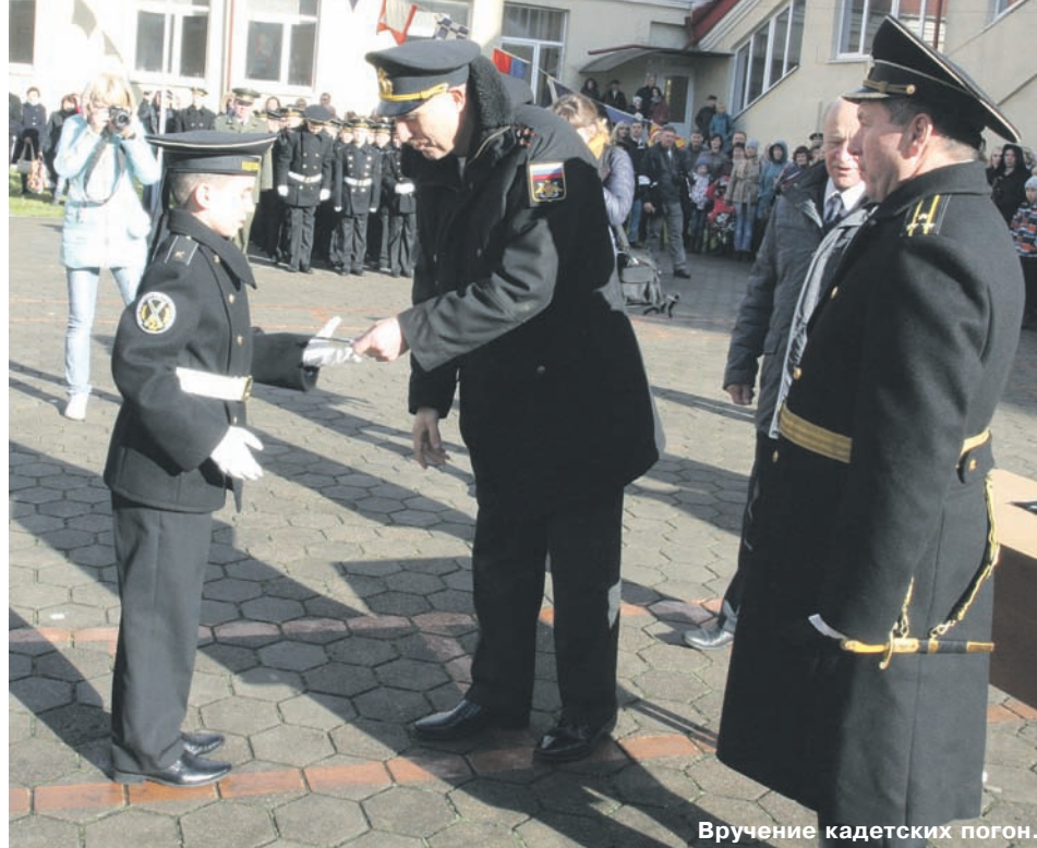
Вручение кадетских погон.