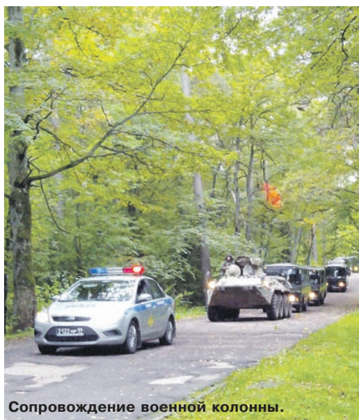
Сопровождение военной колонны.

Выполнять свои функциональные обязанности ВАИ помогает её хорошая оснащённость. С каждым го-