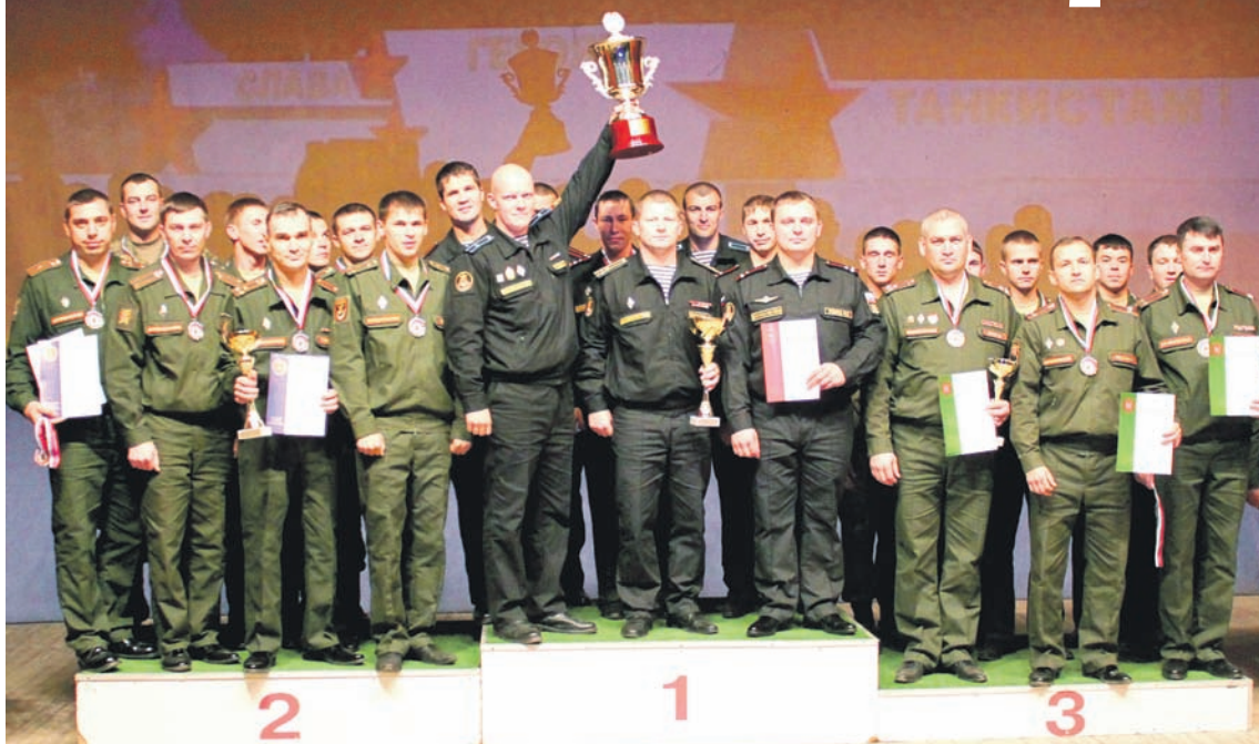
Команда БФ (в центре) на пьедестале почёта.

Кроме того, офицеры тренировались и по месту службы на спортивной базе своих воинских частей. Понятно, что к учебно-тренировочным сборам привлекалось больше во-