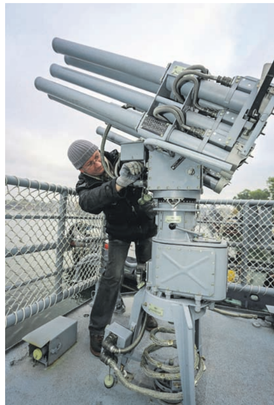
Подготовка вооружения к стрельбам.

ет всё возможное, чтобы первый настоящий экзамен в море прошёл без замечаний, – говорит он. – Было два выхода, ещё предстоит четыре. Запланированы ракетные и торпедные стрельбы. Специалисты дивизиона помогают в плане обеспечения корабля, пополнения запасов, организации и проведения государственных испытаний.