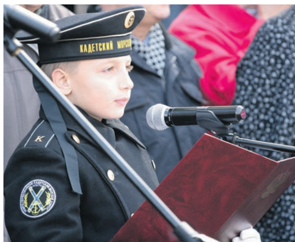
Принятие торжественного обещания.

корпус расширяется. И вот уже первые выпускники в воинских званиях начинают подбираться к старшим офицерам и, я уверен, в ближайшем будущем