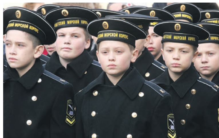
В строю – будущие флотоводцы.