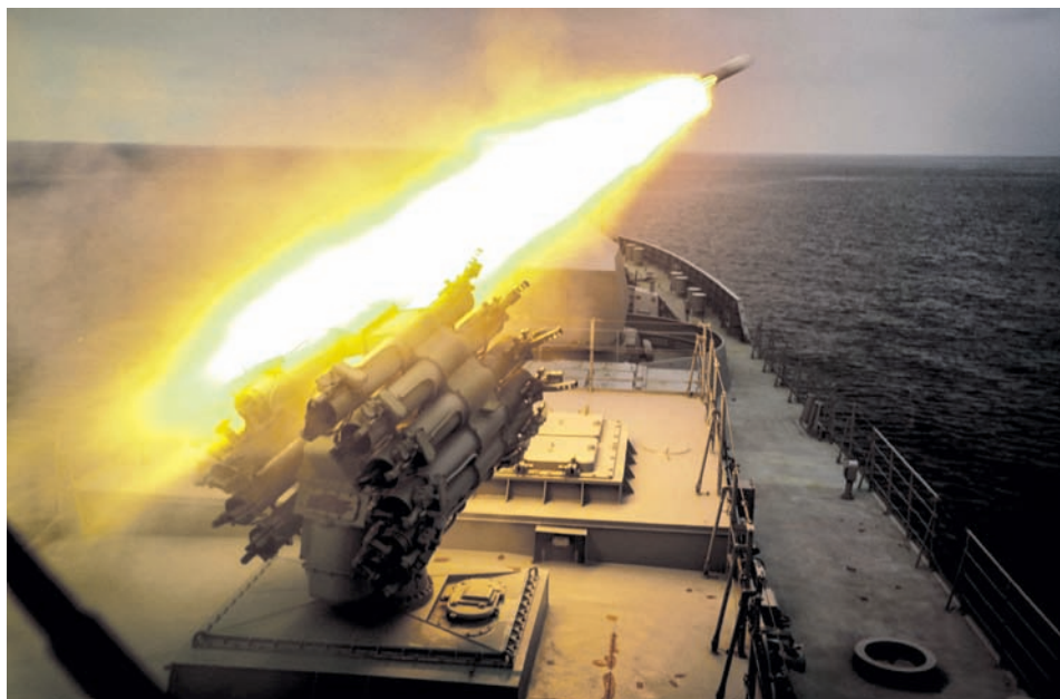
Первые залпы РБУ-6000.