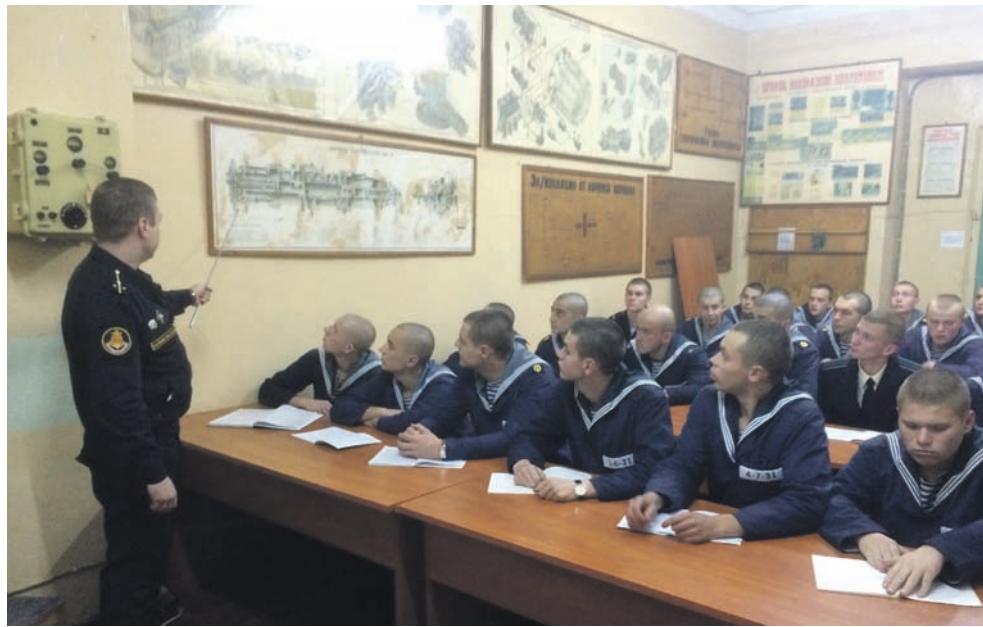
Теоретические занятия в дивизионе строящихся и ремонтирующихся кораблей.

Борт СКР «Адмирал Григорович», Балтийское море.