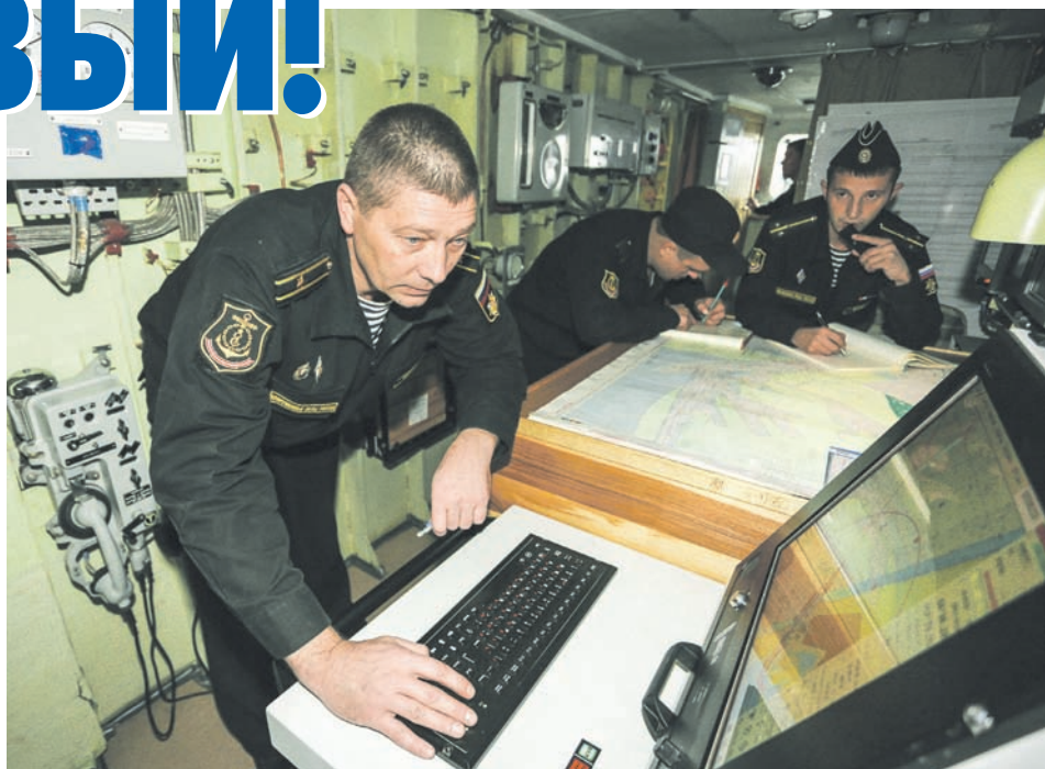
За работой – специалисты БЧ-1.

ладает незаурядными мореходными качествами, ведь родоначальниками данного проекта были корабли проекта 1135, которые завод «Янтарь», судостроительный завод в Санкт-Петербурге строили интенсивно и много, и они себя зарекомендовали с положительной стороны. И не случайно ВМС Индии заказали уже шесть таких кораблей. По своим ТТХ, вооружению, которое стоит на этих кораблях, проект 11356 ничуть не уступает, а во многом превосходит по многим параметрам аналогичные образцы военно-морских сил иностранных государств... Следующим будет СКР «Адмирал Эссен», – продолжает командир дивизиона. – Я надеюсь, что завод-изготовитель учёл все нюансы строительства испытаний, и этот корабль бу-