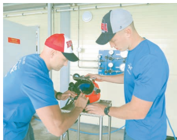
Подготовка снаряжения к спускам.