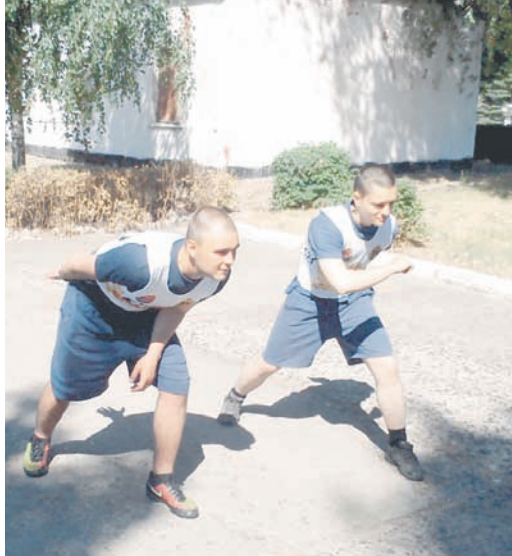
Военизированная эстафета 4х100 м.