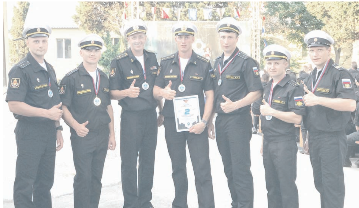
Серебряные призёры «Глубины-2018» – водолазы БФ.

Проход к воздушному вентилю затруднён сужением в отсеке. Необходимо выполнить работы по расширению провета и закреплению конструкции фрагментами доски. Далее нужно открыть вентиль подачи воздуха на поверхность для контроля качества заделки пробойн и вернуться через макет к финишу. Упражнение считается выполненным при прохождении воздуха через магистраль и герметичности всех узлов макета.