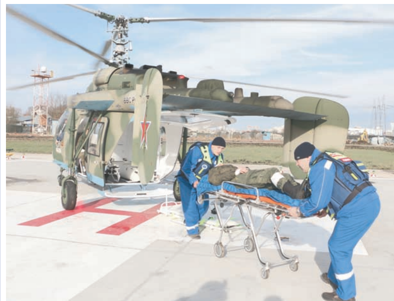
На учениях по организации экстренной автотранспортной эвакуации пострадавших

Для поиска, развития и быстрой реализации передовых идей и прорывных технологий в интересах Минобороны создан Военный инновационный технополис «ЭРА». К его деятельности планируется привлекать ведущих экспертов страны.