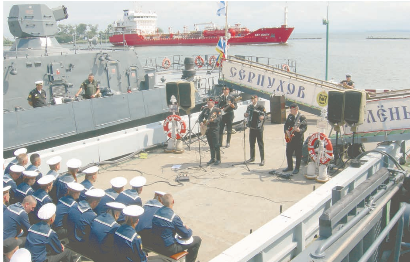
Выступление ВИА «Чёрные береты» в соединении.

В Северном море у берегов Норвегии начались противолодочные учения стран НАТО Dynamic Mongoose 2018. Семь кораблей, три самолёта морской разведки и две подводные лодки, участвующие в манёврах, представляют Норвегию, Данию, Германию, Польшу, Нидерланды, Испанию, Турцию и США. В этом году учения проходят к югу от норвежского Тромсё в водах в районе авиабазы Аннея, где базируются как норвежские, так и американские морские патрульные самолёты. Силы НАТО будут отработать действия по поиску выходящих с Кольского полуострова российских подводных лодок до 6 июля.