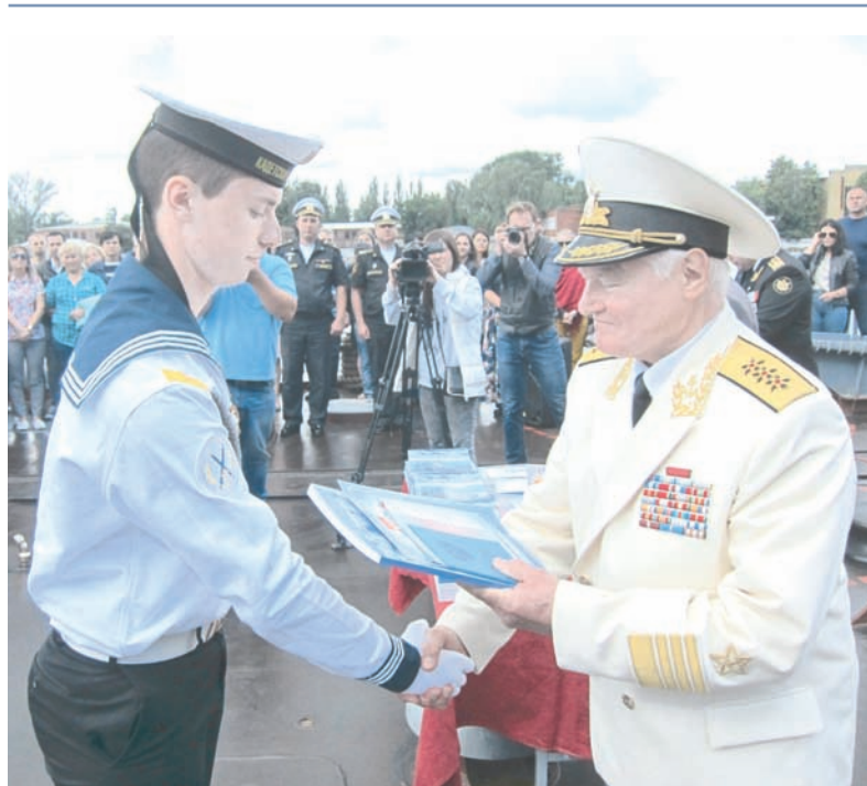
Аттестат из рук адмирала В. Егорова.

Выбор места проведения церемонии символичен: лучшие выпускники стали таковыми потому, что обладали настойчивостью в учёбе. И в дальнейшем это качество будет определять успешность службы каждого из них.