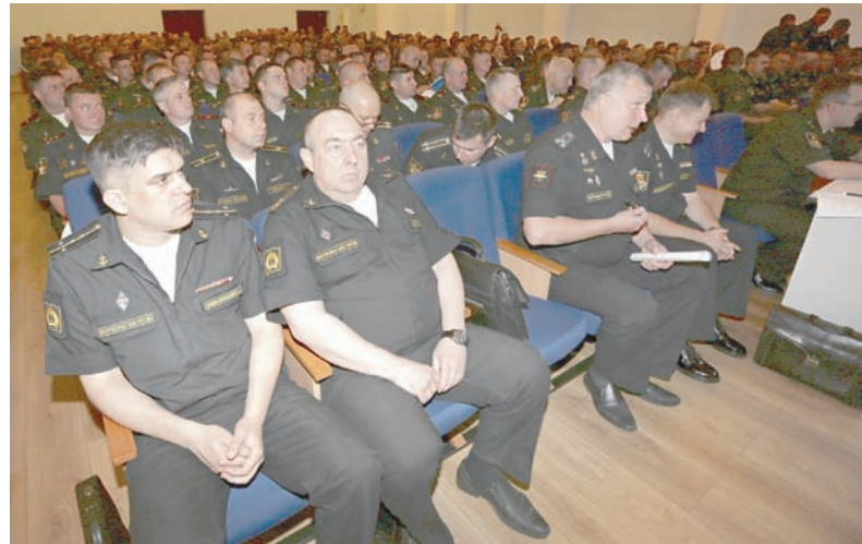
В зале заседания.