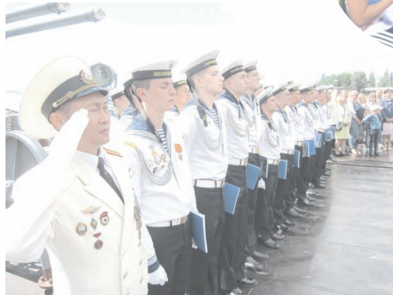
Путь во взрослую жизнь открыт.