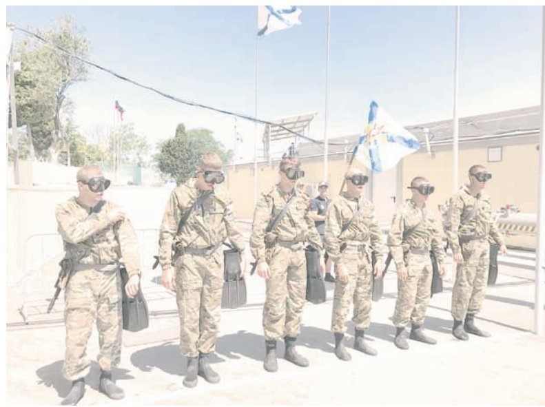
Балтийцы перед стартом на полосе препятствий.

У всех появился настрой показать лучшее, на что они способны, и занять наконец лидирующие позиции на всероссийском этапе «Глубины», – рассказал в беседе капитан-лейтенант