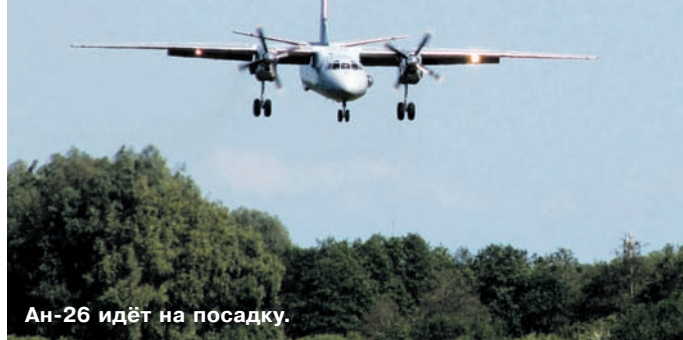
Ан-26 идёт на посадку.