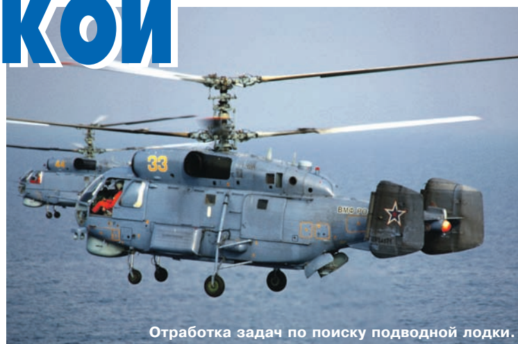
Отработка задач по поиску подводной лодки.

– Этот вид полётов для нас был какое-то время недоступен, – продолжает командир эскадрильи. – Допуски были утрачены. Нам помогли лётчики-испытатели, благодаря которым мы восстановили утраченные навыки и смогли подготовиться к подобным полётам. Было налаже-