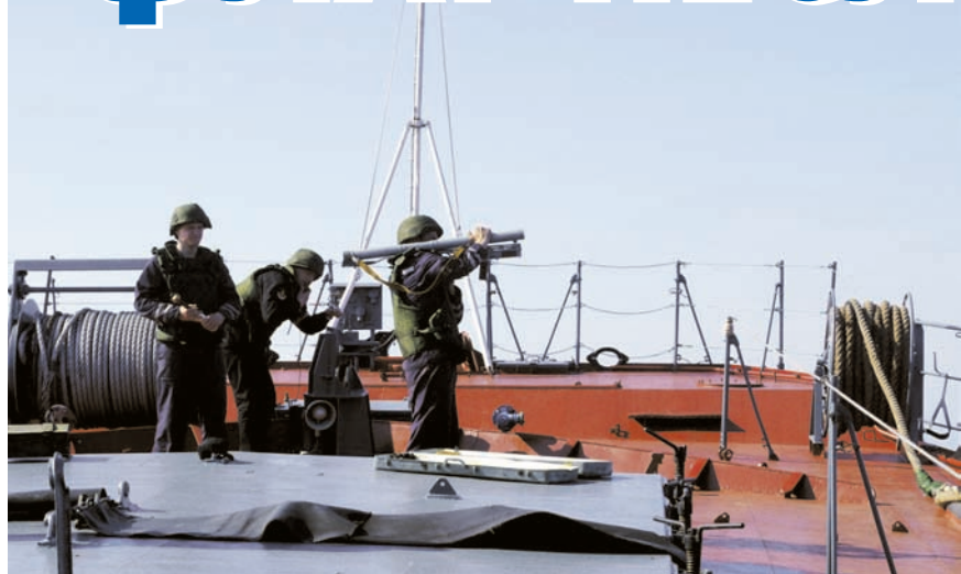
Отработка боевых упражнений.