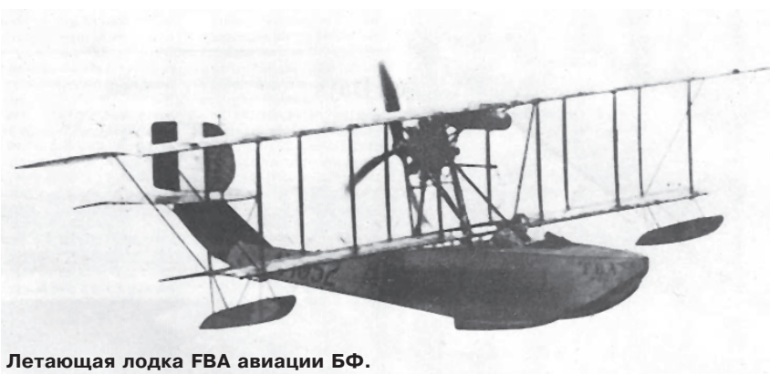
Летающая лодка ФВА авиации БФ.

ют и пилот, и пассажир. В это время ко мне направился и второй аппарат.