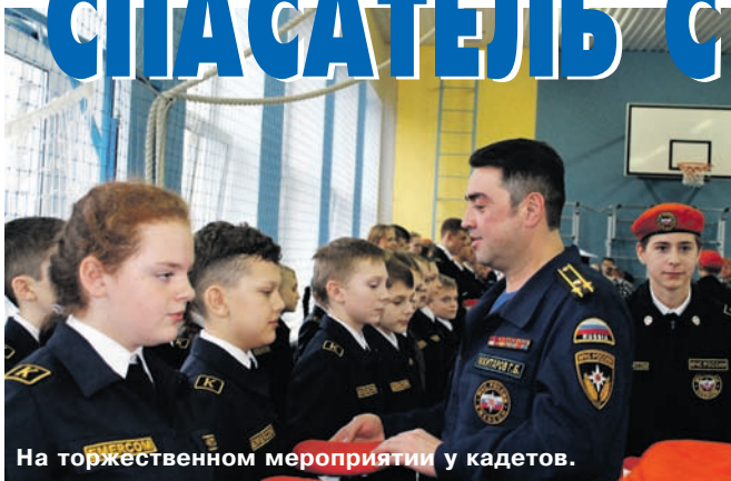
На торжественном мероприятии у кадетов.