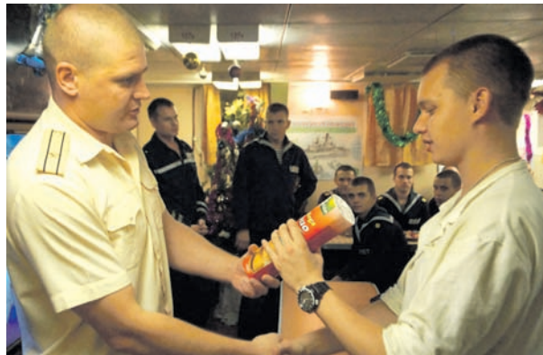
Сладкие подарки от командира корабля.

– Каждая боевая часть своими силами готовила по два-три музыкальных номера: песни, частушки, пародии, – рас-