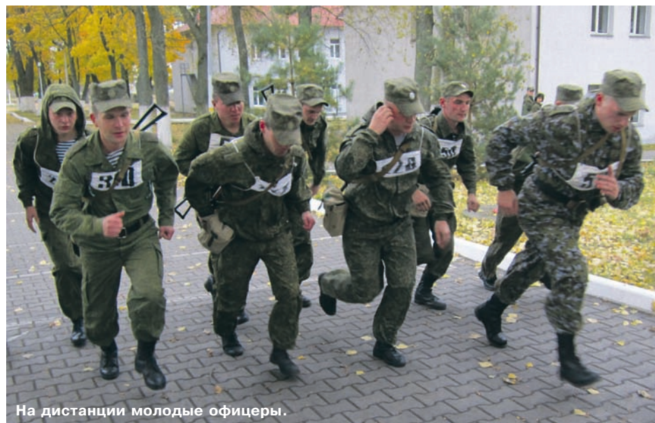
На дистанции молодые офицеры.

но на Балтике. Так внук пошёл по стопам своего предка.