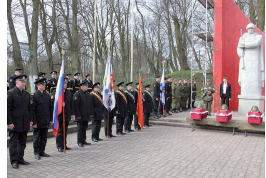
Военнослужащие отдельного морского инженерного полка Балтийского флота приняли участие в церемонии перезахоронения останков 118 советских воинов, погибших во время Великой Отечественной войны в боях за Фишхаузен (ныне – г. Приморск Калининградской области).