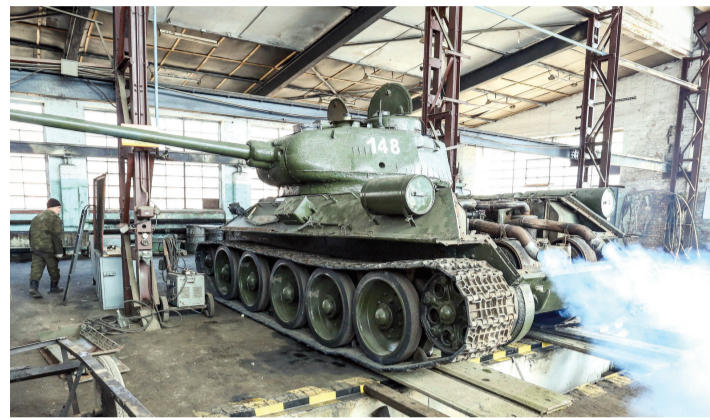
Легендарный танк в ремонтном цехе.