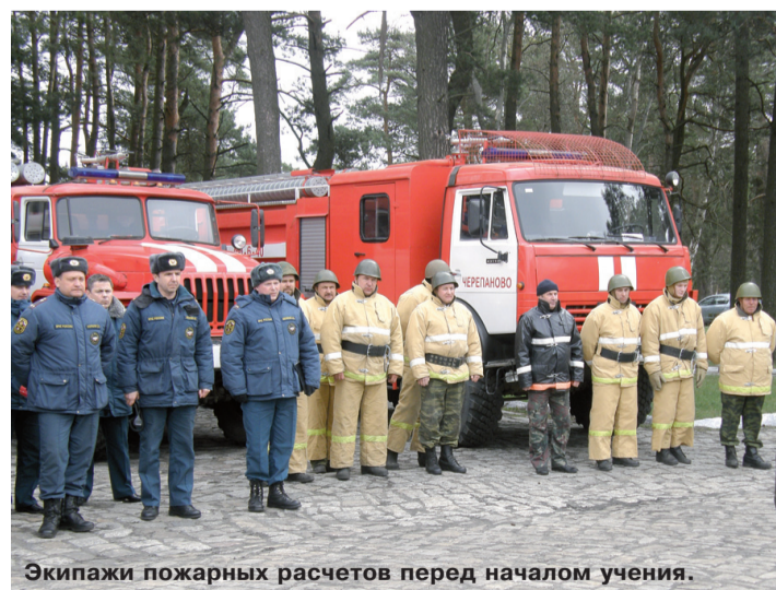
Экипажи пожарных расчетов перед началом учения.

В ходе мероприятия организации, приемы и способы тушения пожара в хранилище боеприпасов. В учении приняли участие 10 единиц пожарной техники и более 50 человек личного состава подразделений пожарной охраны Балтийского флота и МЧС РФ.