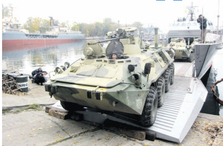
Идёт погрузка бронетехники.