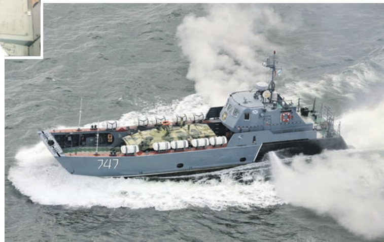
Десантные катера – постоянные участники флотских учений.