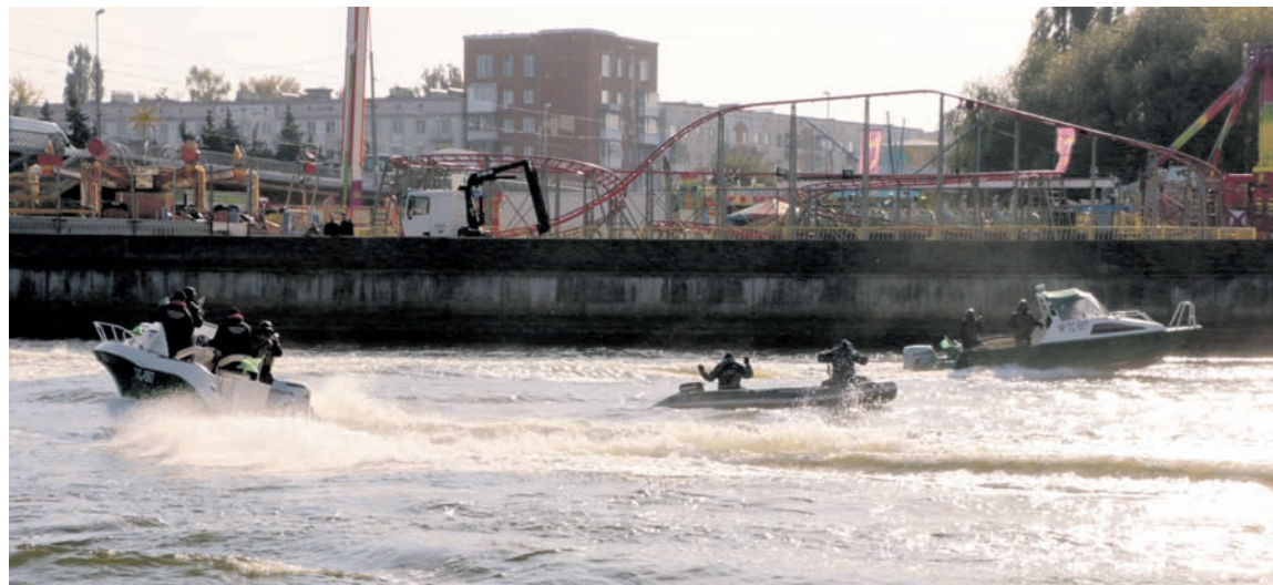
Показательные выступления на воде.