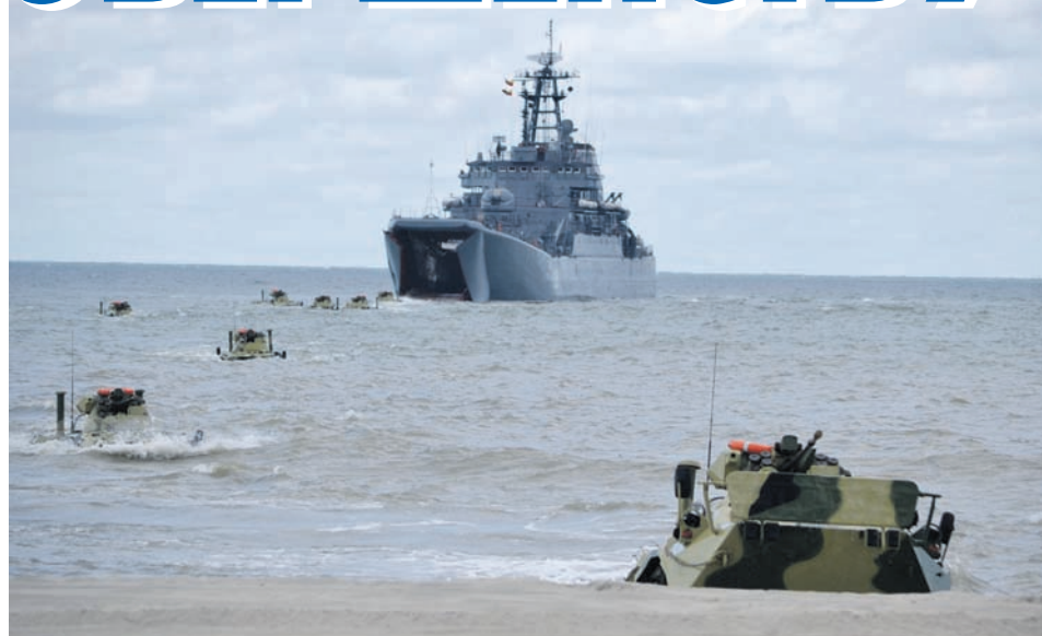
Высадка морского десанта.

Балтийского флота навеки связано с именем его первого командира капитана 1 ранга Ярослава Максимовича Куделькина. В далеком 1961 году он принял под свой флаг только что созданную бригаду, которой суждено было стать главным союзником морской пехоты и основ-