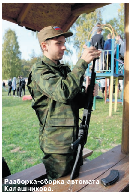
Разборка-сборка автомата Калашникова.

патриотизма, гражданственности, нравственности. В акции приняли участие воспитанники военно-спортивных, патриотических классов, клубов, кадетских классов общеобразовательных школ города. Всего соревновались 19 команд общеобразовательных учреждений, школ для детей, нуждающихся в психолого-педагогической и медико-социальной помощи, центра