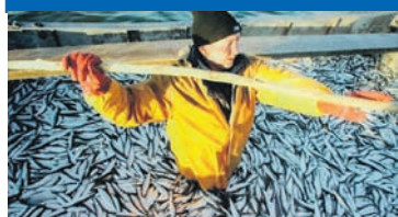
Государственный архив Калининградской области, ул. Комсомольская, 32, тел. 21-04-53