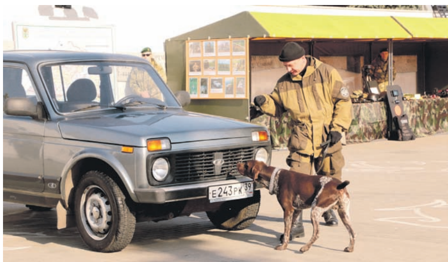
Кинологи демонстрируют возможности своих подопечных.

шли с достойными результатами. Об этом говорили во время торжественного собрания руководители янтарного края и прибывшие на праздник представители Федеральной таможенной службы РФ. Луч-