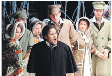
Калининградский областной музыкальный театр, Калининград, просп. Мира, 87, тел.: 91-66-59, 21-08-12.

Самая известная пьеса мирового репертуара, первая трагедия, созданная Шекспиром. Имена её героев знакомы каждому школьнику. Неудержимые чувства молодых людей сталкиваются с жестокостью семейных устоев, равнодушием и предательством. Спектакль – о непомерно высокой цене, которую пришлось заплатить представителям двух непримиримых кланов за бессмысленную вражду.