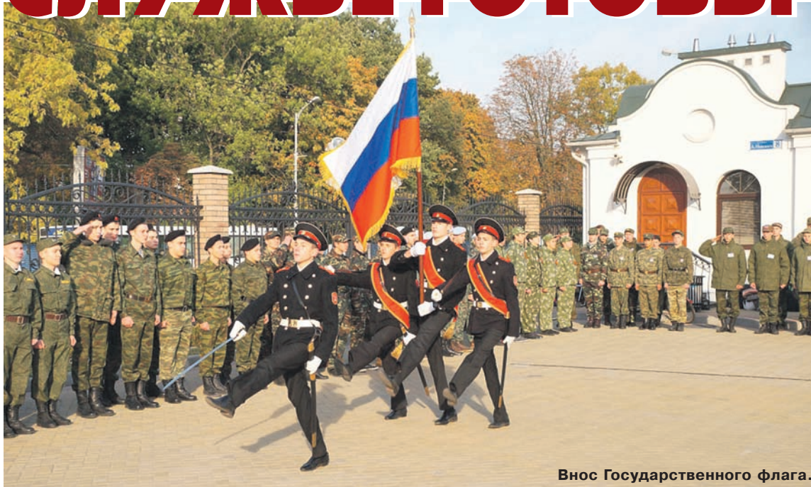
Внос Государственного флага.

В течение двухдневных кадеты и просто патриотически настроенные школьники участвовали в военно-прикладных и спор-