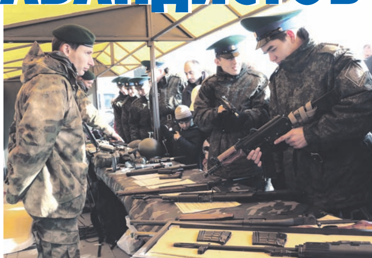
На празднике особым интересом пользовалась выставка вооружения.

Несмотря на определённый экономический спад, за девять месяцев 2015 года калининградские таможенники оформили почти 120 тысяч