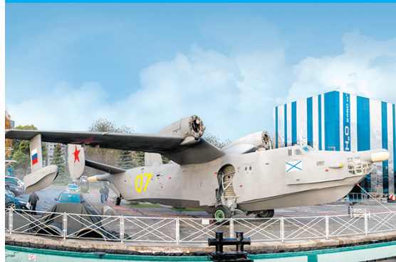
Музей Мирового океана, Калининград, набережная Петра Великого, 1, тел.: 53-17-44, 34-02-44.