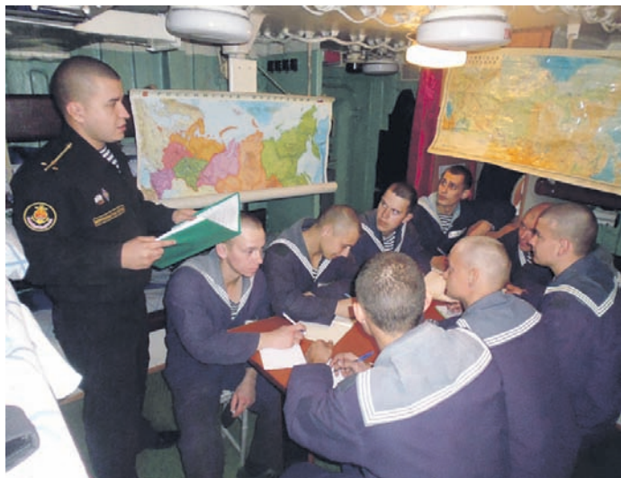
На занятиях по общественно-государственной подготовке.

Несмотря на скромные габариты, малый десантный корабль поразительно вместителен: способен при-