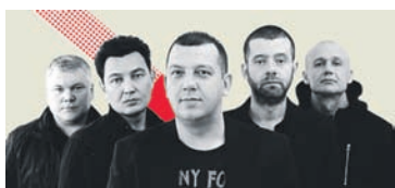
Ночной клуб «Универсал», Калининград, пр. Мира, 41-43, тел. 92-10-05.