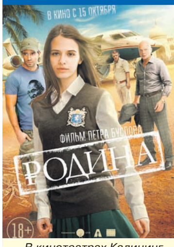
В кинотеатрах Калининграда и области