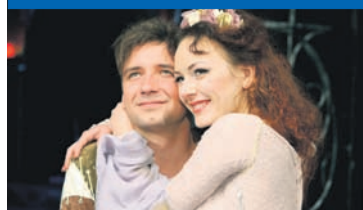
Калининградский областной драматический театр, Калининград, проспект Мира, 4, тел.: 21-24-22, 95-81-88.