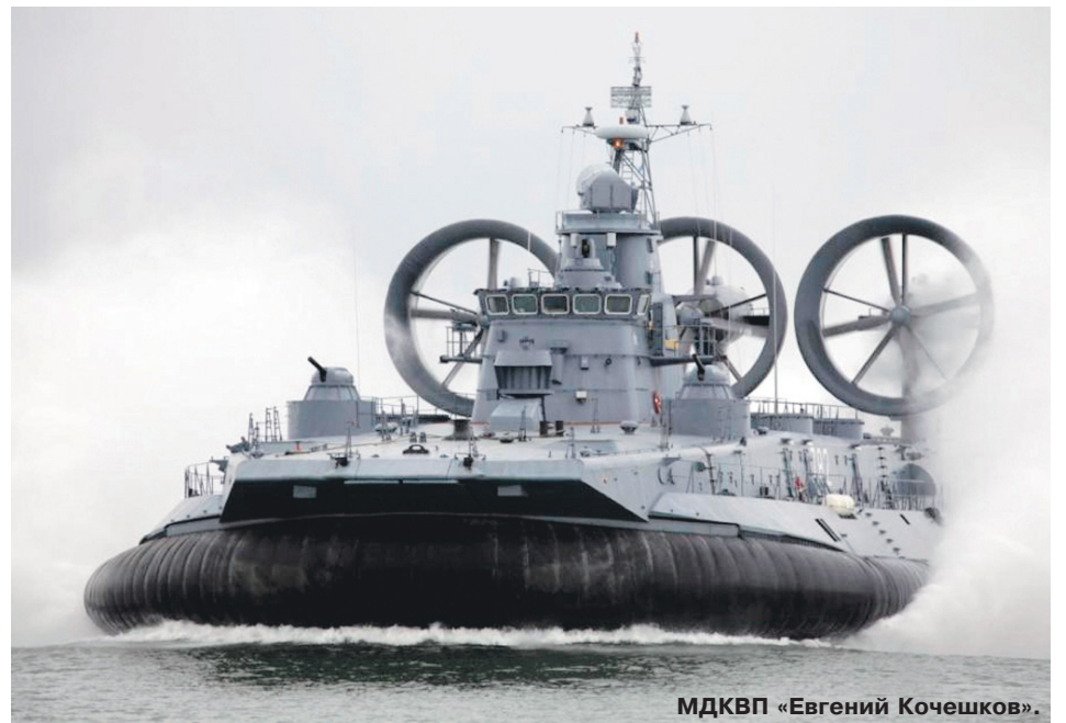
МДКВП «Евгений Кочешков».