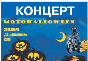
Дворец спорта «Янтарный», ул. Согласия, 39, тел.: 66-66-80, 53-85-64.

Самая знаменитая опера Чайковского стала новым этапом в режиссёрском творчестве Д.Бертмана. Драма молодых пушкинских героев обрела в спектакле конкретность, предельную остроту, интимность и вместе с тем истинную глубину и масштабность. Хорошо знакомые бытовые подробности подняты на высоту метафоры, символа.