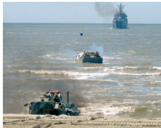
Высадка морского десанта на побережье.

Морским пехотинцам противостояли подразделения армейского корпуса Балтийского флота. В ходе учения личный состав мотострелковых подразделений, имитировавший условного противника, был поднят по тревоге и совершил марш в район предполагаемой высадки морского десанта. По прибытию на место пехотинцы выполнили задачи по подготовке местности к противодесантной обороне и инженерному оборудованию позиций.