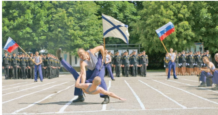
Показательные выступления по рукопашному бою.

По традиции перед началом производства в офицеры состоялась торжественная церемония