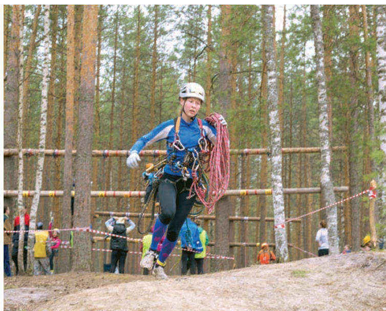
На дистанции. Впереди – крутой подъём.

Сегодня девушке всего двадцать один год. Но её спортивные достижения сделали бы честь любому самому крутому воину-спортсмену.