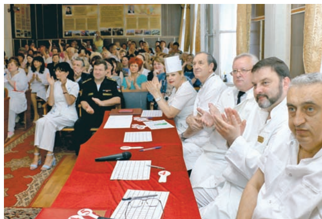
Вместе со зрителями аплодирует и жюри.