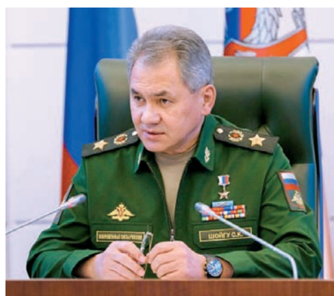
Министр обороны РФ генерал армии С.Шойгу.

Начата подготовка к плановому стратегическому учению «Запад-2017», в котором примут участие белорусские и