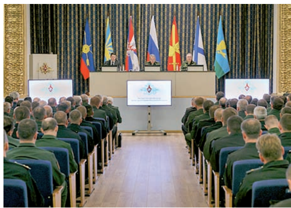
В зале заседания.

«Происходящее наглядно демонстрирует откровенное нежелание западных партнёров отказываться от антироссийского курса. Об этом свидетельствует и майский саммит НАТО, на котором в один ряд угрозы были поставлены международный терроризм и Россия», – заявил министр обороны.