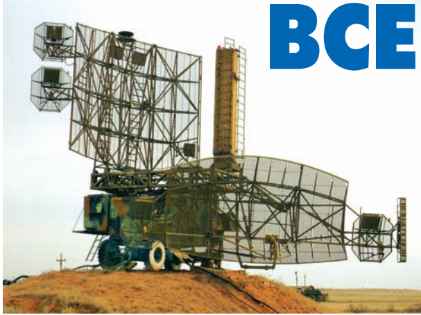
Радиолокационная станция на позиции.