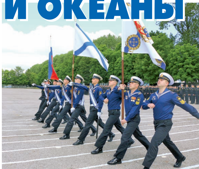
Знаменная группа учебного заведения.