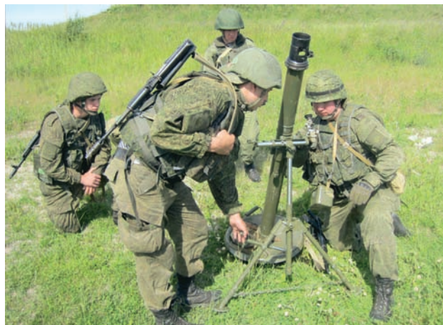
Расчёт миномётчиков готовится к бою.