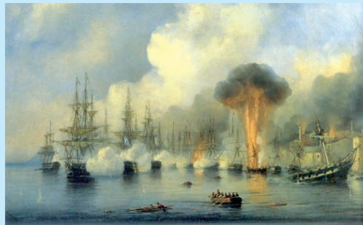
«Синопский бой 18 ноября 1853 г.». Худ. А.Боголюбов.

В 1854 году П.Нахимов был назначен командовать судами на рейде и в бухтах при нападении неприятеля на Севастополь. После высадки противников и сражения на реке Альме вместе с вице-адмиралом В.Корниловым руководил созданием обороны города с моря и на суше. После гибели В.Корнилова фактическим возглавил оборону Севастополя, стал примером для его защитников, не имея на это официальных прав.