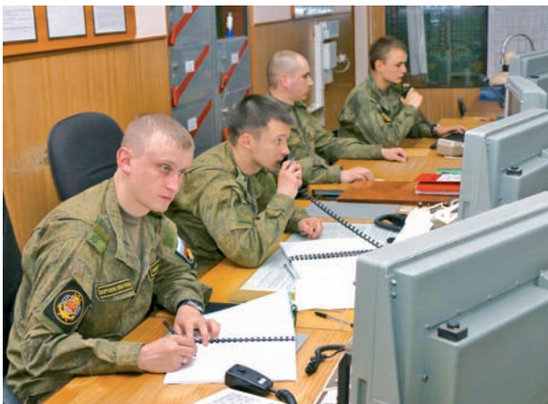
На командном пункте полка.

странство. Самолёты несколько дней в небо не поднимались. Мы как-то за сутки провели всего три цели. Но это, конечно, исключение.