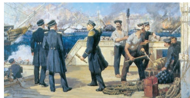
«П.С.Нахимов на палубе корабля «Императрица Мария» во время Синопского сражения». Худ. Н.Медовиков.

В 12 часов 28 минут флагман противника «Авни-Аллах» первым открыл огонь, вслед за ним по подходящим русским силам дали залпы остальные турецкие корабли и береговые батареи. Турки вели огонь главным образом по рангоуту и парусам, стремясь затруднить движение русских кораблей на рейд и заставить П.Нахимова отказаться от атаки. Через полчаса после начала боя турецкий флагманский корабль «Авни-Аллах», по которому вёл огонь линкор «Императрица Мария», был серьёзно повреждён и выбросился на