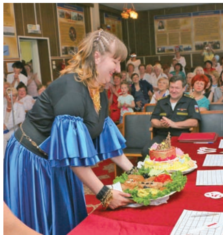
Вкусный конкурс «Домашнее задание».

доблесть» II степени. По окончании официальной части праздника был дан старт весёлому, яркому, искромётному конкурсу «Лучшая медицинская сестра 2017 года».