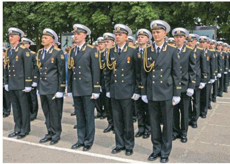
В строю – молодые лейтенанты.