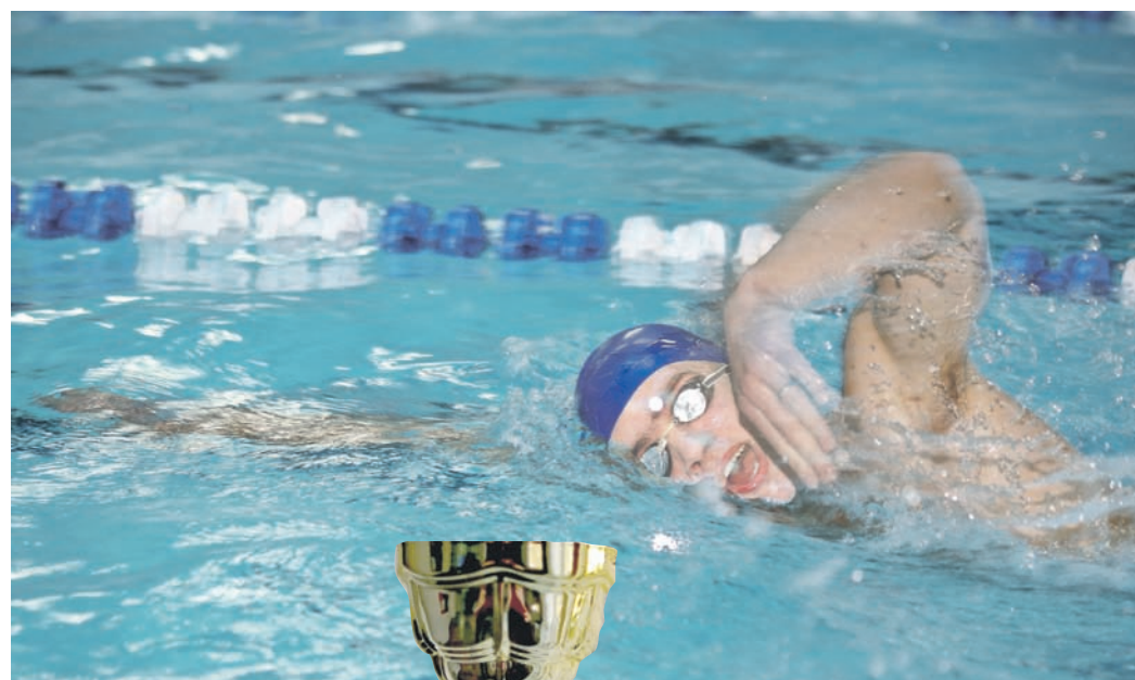
Соревнования по плаванию.