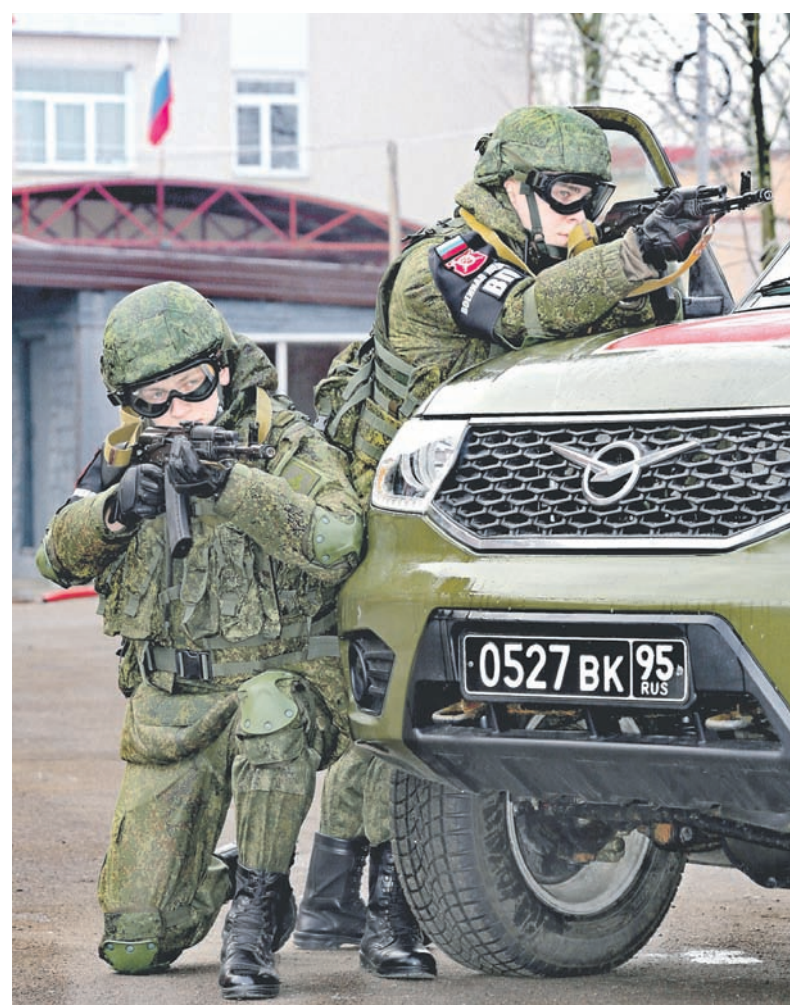
Тренировка военных полицейских Калининградского гарнизона.

– Сейчас мы активно тренируемся, – говорит он. – Каждую неделю проводятся маршброски на дистанции 10 км в полном снаряжении, силовые занятия в спортивном зале. Мы также выезжаем на полигон, где преодолеваем полосу препятствий на время. Недавно в тире ДОСААФ отрабатывали упражнения из арбалетов и винтовок.