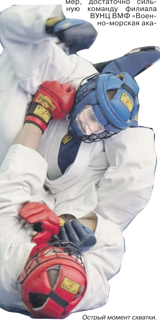
Острый момент схватки.

второй день чемпионата, когда пришлось сразаться на 100-метровой дистанции при полной экипировке, а также в нырянии в длину. Наши спортсмены по-