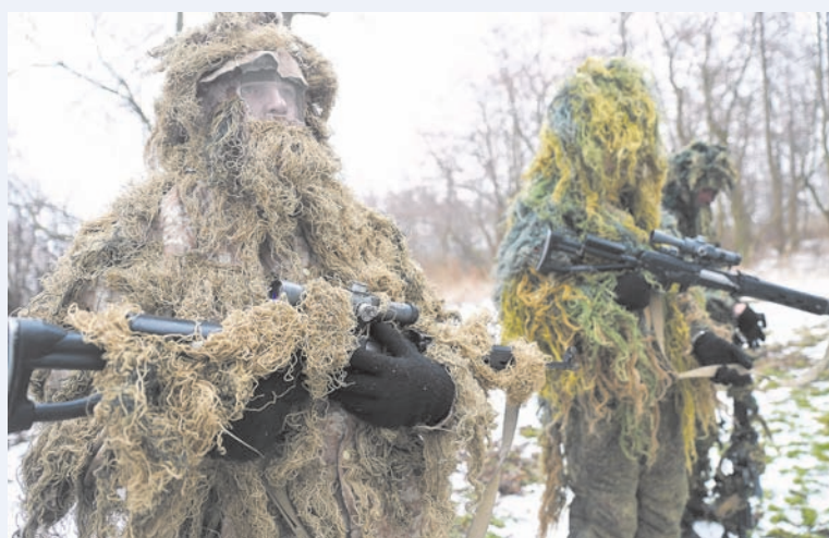
Снайперы в маскировочном комплекте «Леший».