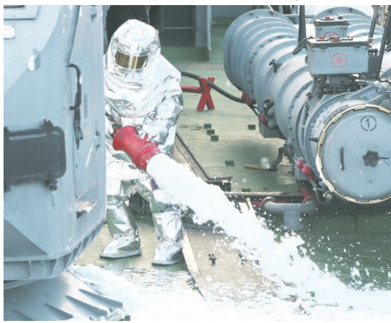
В борьбе за живучесть корабля.

В настоящее время большая часть отработки курсовой задачи К-2 завершена. Но покой морякам, как говорится, только снится. Экипаж устраняет мелкие недоработки, доводит до автоматической чёткости действия всех расчётов. Впереди отработка поиска и уничтожения подводных лодок боевым корабельным противолодочным расчётом. В ближайшее время личному составу МПК предстоит ещё раз выполнить стрельбу по надводным и воздушным целям, противодиверсионные и спасательные операции, отработать приёмы уклонения от обнаруженной мины. Затем экипаж корабля перейдёт к плановой боевой подготовке в составе соединения.