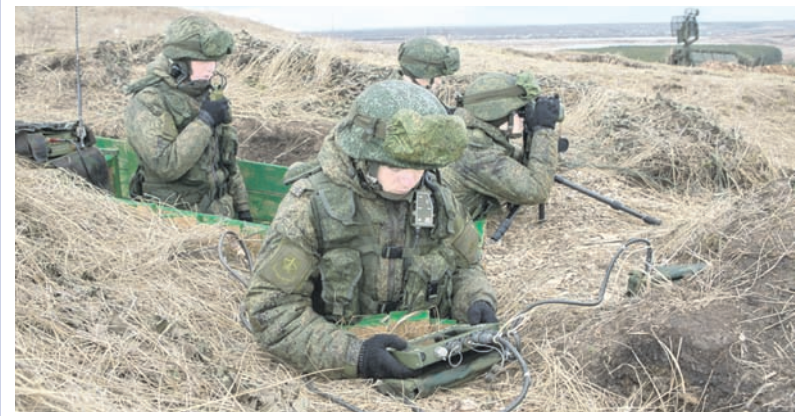
Департамент информации и массовых коммуникаций МО РФ.

К исследовательскому учению были привлечены более 500 военнослужащих, свыше 100 единиц военной и специальной техники, в том числе вертолёты Ми-8АМТШ, танки Т-72, боевые машины пехоты БМП-2, самоходные артиллерийские установки «Мста-С», реактивные системы залпового огня «Град».