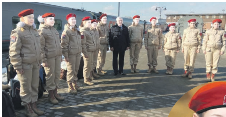
Юнармейцы перед поездкой.

Всероссийский молодёжный патриотический форум с таким названием проходит в эти дни в подмосковной Кубинке на базе военно-патриотического парка культуры и отдыха ВС РФ «Патриот».