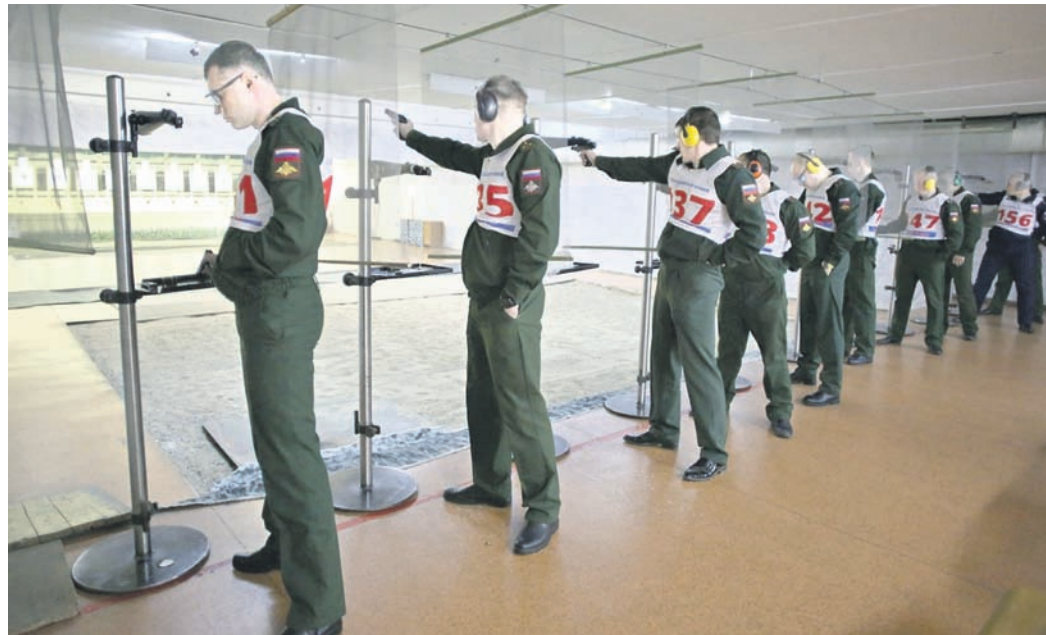
На одном из этапов зимнего офицерского троеборья.

Газета зарегистрирована в Министерстве печати и информации РФ. Рег. № 01952.