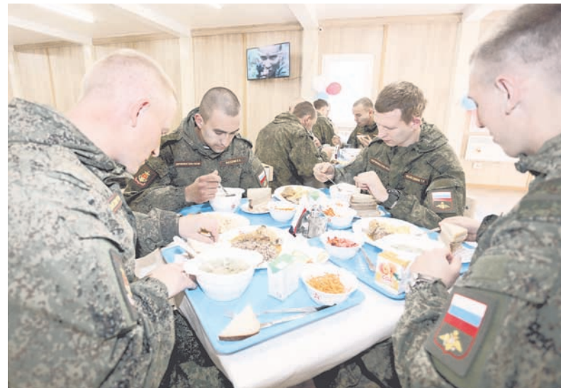
Обед — по распорядку.

входа — умывальник с горячей водой и бумажные полотенца. Посуда из белого стекла, бочонки с маслом, горчицей и уксусом и даже салфетки на столах в цветах российского триколора — ещё одни штрихи нового стиля жизни Российских Вооружённых Сил.