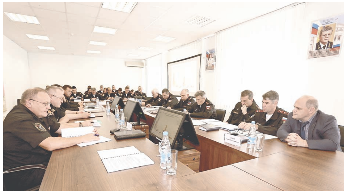
Идёт координационное совещание по вопросам коррупции.

В целях усиления борьбы с коррупцией совершенствуется и нормативно-правовая база, регламентирующая проходные службы военнослужащими и гражданами специалистами Минобороны России. Приказом министра обороны определён перечень должностей, при назначении на которые военнослужащий или граждан-