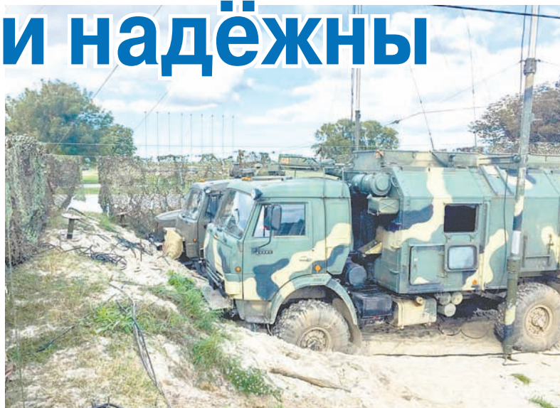
Подразделения центра связи БФ на полигоне.

— К нам поступают аппаратные спутниковой связи, релейные цифровые станции, ком-