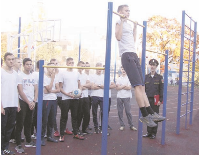
Подтягивание на перекладине.

Лучшие результаты, естественно, показывают спортсмены, причём лидерами здесь являются те, кто занимается современным пятиборьем, сочетающим в себе и лёгкую атлетику, и плавание, и стрельбу. Они меткие, гибкие, быстрые, выносливые. Но и у всех остальных есть прекрасные шансы получить знак ГТО. Нужно просто поставить перед собой цель и каждый день делать шаг ей навстречу. Так, в ноябре сотрудники Калининградского центра тестирования вновь приедут к кадетам, чтобы зафиксировать их достижения в стрельбе, отжимании и растяжке. Поэтому пора налегать на учёбу, чтобы досадные промахи по общеобразовательным предметам не помешали занятиям в тире и спортзале.