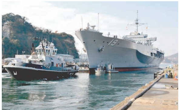
Флагман 7-го флота ВМС США USS Blue Ridge.

В лихие 90-е Россия шла в фарватере американского курса – получили почётное 46-е место в коррупционном рейтинге за 1996 год с перспективами улучшения. Пошли своим курсом – довольствуетесь местом рядом с Мексикой, но намного ниже Боливии, Габона, Мали. Сегодня уровень коррупции в Грузии (46-е место) по мнению Transparency International, якобы ниже, чем в Южной Корее (50-е место) и Италии (55-е). Беларусь же (67-е место), наоборот, согласно мнению составителей рейтинга, более коррумпирована, чем африканские Намибия (52-е место) и Сенегал (66-е).