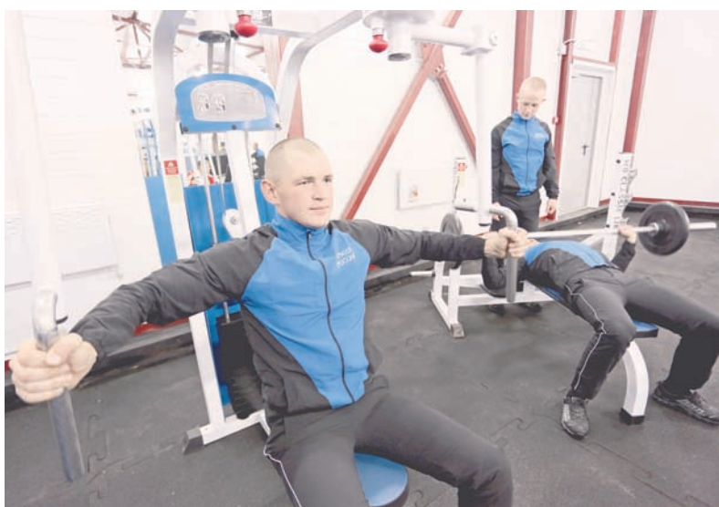
В спортивном зале нового комплекса.

— Конечно, мы очень долго ждали этого и принимали в строительстве самое активное участие, чтобы в максимально короткие сроки ввести в строй данный объект, — сказал он.