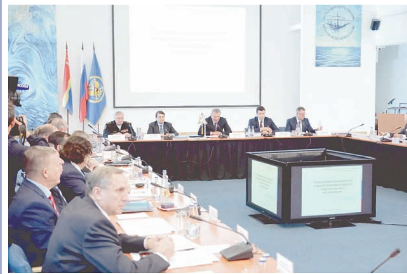
Департамент информации и массовых коммуникаций МО РФ.

В своём выступлении на заседании Морской коллегии адмирал Владимир Королёв остановился и на реализации кораблестроительной программы. Он отметил, что «в вопросах военного кораблестроения сохраняется поступательное движение вперёд. Продолжается строительство надводных кораблей, оснащённых высокоточным оружием, атомных и неатомных подводных лодок 4-го поколения, идёт работа над созданием подводных лодок 5-го поколения. Флот развивается и способен выполнять задачи любой сложности».