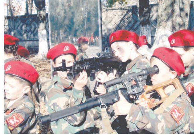
Подрастающее поколение на выставке вооружения.