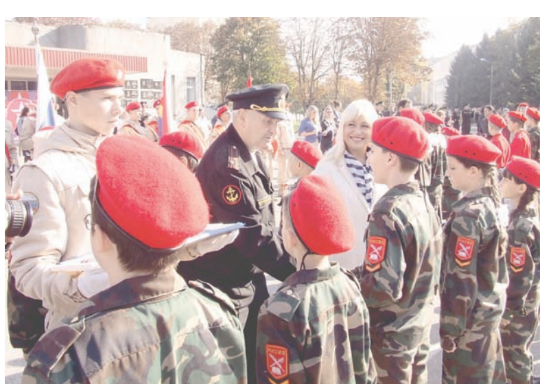
Вручение юнармейских значков.

Участниками мероприятия стали 250 юношей и девушек из 18 муниципалитетов янтарного края. Выстроившись на плацу кузицы военных кадров Военно-Морского Флота России, ребята, затаив дыхание, слушали выступления почётных гостей форума.