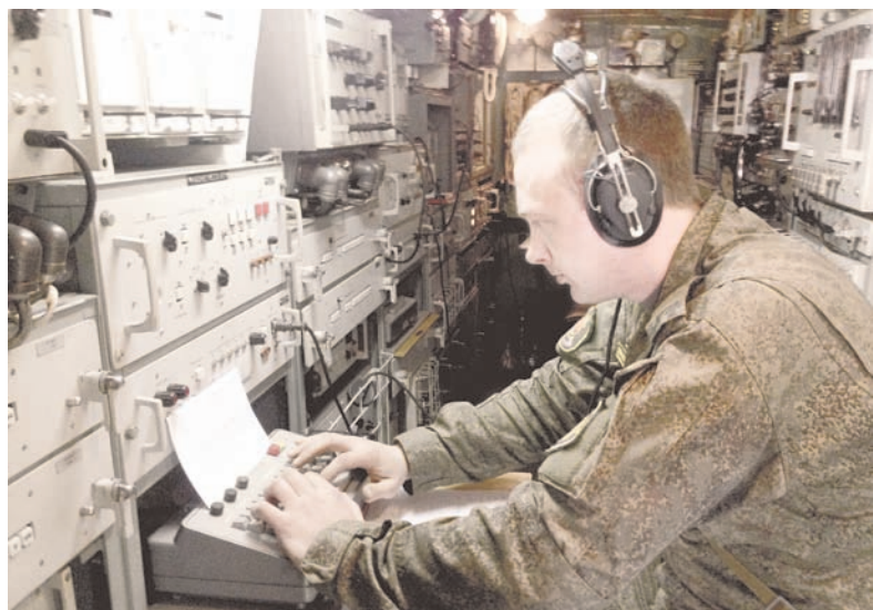
Связь — в надёжных руках.

Поздравляем всех флотских связистов с праздником и желаем им внимательности, точности, удачи и везения, быть настоящими профессионалами своего дела и всегда передавать самую актуальную и точную информацию!