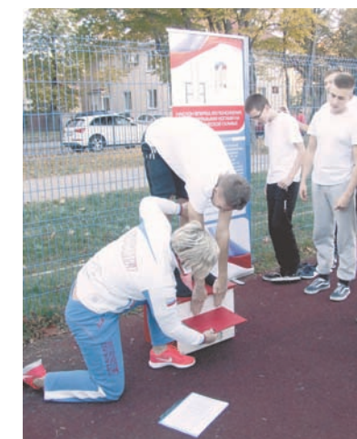
Наклон вперёд из положения стоя на гимнастической скамье.

В Калининграде в этом году были протестированы более 3 тысяч человек, и из них боль-