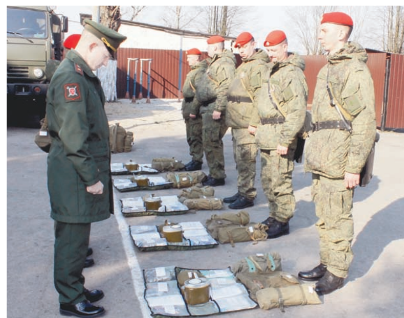
«А что у вас, коллеги, в рюкзаках?»