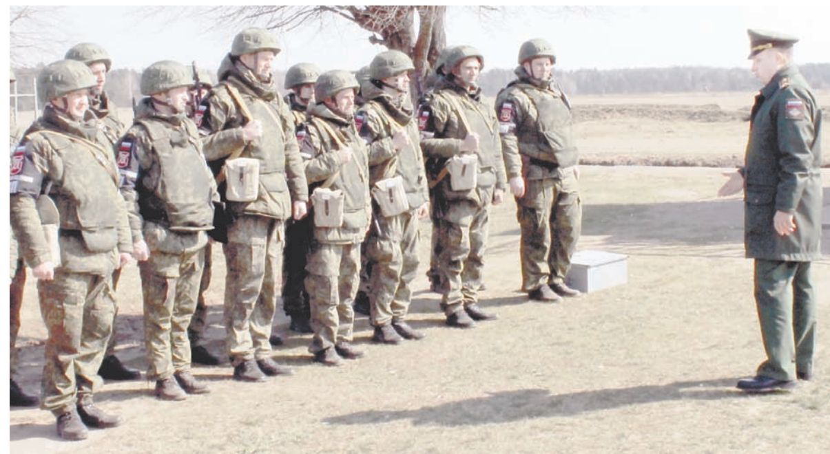
Последний инструктаж на стрельбище.

Проверка, в ходе которой определились участники конкурса «Страж порядка» в рам-