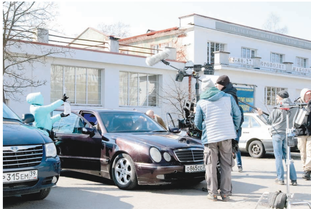
Тишина! Снимается кино.

Площадкой для развития стремительно меняющегося, порой головокружительного сюжета фильма, по замыслу авторов, станет практически вся область. Съёмки будут проходить в Калининграде, Балтийске, Светлогорске, Янтарном и Светлом. Конечно, главные кадры будут сняты в военной гавани и на кораблях Балтийского флота. Увидеть себя в фильме «Андреевский флаг» наверняка смогут многие моряки-балтийцы. Впрочем, шанс поработать себя в качестве актёра есть и у других жителей области. Во-первых, они могут подписать контракт с Министерством обороны (главное – успеть оформить все документы до августа) и попасть на съёмку уже в качестве военнослужащих, во-вторых, можно отслеживать новости в соцсетях. Периодически там публикуется информация, какие типы нужны для очередных сцен. К примеру, недавно были востребованы бородатые брутальные бандитской наружности. Будьте готовы к импровизации.