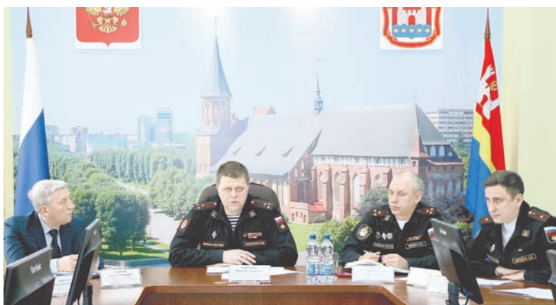
Военком Калининградской области Ю. Бойченко (в центре) подробно рассказал о ходе призывной кампании.

Состоялась пресс-конференция военного комиссара Калининградской области Юрия Бойченко, посвящённая весенней призывной кампании 2019 года.