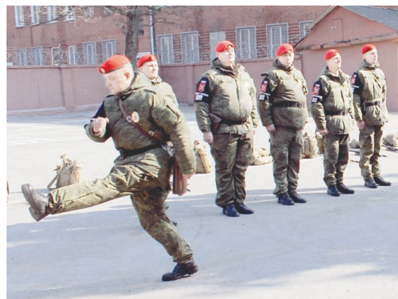
Занятия по строевой подготовке.

Сегодняшний день военной комендатуры – это качественный ремонт помещений, совершенствование учебно-материальной базы, оснащение новейшими специальными средствами, комплектами боевого снаряжения «Ратник». Получены автомобили «УАЗ-Патриот» с оборудованием мест для перевозки задержанных (конвоируемых). Трижды в неделю военные полицейские привлекаются к