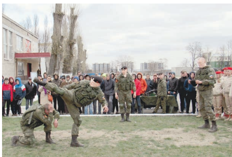
Морские пехотинцы продемонстрировали приёмы рукопашного боя.

Формирование мировоззрения и духовных ориентиров начинается в детстве. По мере взросления личностные ценности, как правило, приобретают общественно значимое звучание. Важными, священными для человека становятся такие понятия, как Отечество, патриотизм, защита Родины. На позитивное восприятие военной службы влияют и воспитание в семье, и те меры, которые целенаправленно реализуют руководство страны и Минобороны России. Во-первых, в последние годы улучшились условия прохождения военной службы, что несомненно увеличило её привлекательность. Во-вторых, за счёт роста числа контрактников существенно снизилась потребность в призывниках, что позволило повысить качество их отбора. В-третьих, служба в Вооружённых Силах стала престижным и обязательным этапом для тех, кто решил построить карьеру в органах государственной или муниципальной власти. Повесть из военкомата больше не пугает юношей. Наоборот, наметилась тенденция к тому, что желающих служить вскоре будет больше, чем планируется призывать.