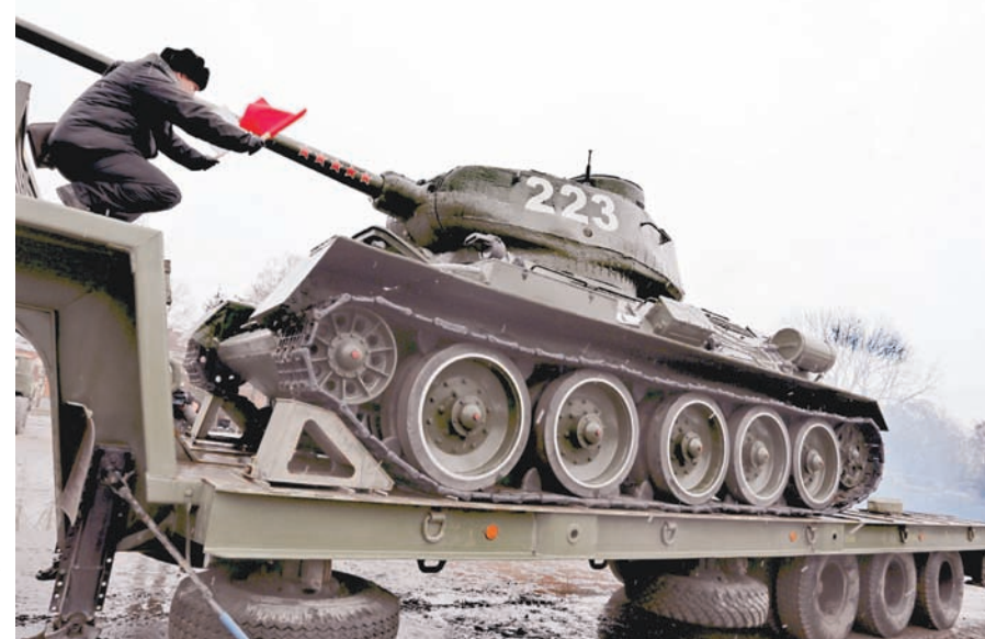
Погрузка Т-34 на платформу.

К слову, в Калининградской области есть и ещё несколько Т-34. Об одном из них знает каждый житель Янтарного края: танк установлен на постаменте на улице генерала Соммера, в уютном месте, где частенько назначают свидания или же просто отдыхнуть, сидя на скамейках под сенью деревьев. Другой Т-34 обособился в посёлке Переславском. Могут ли однажды эти машины стать участниками парада, неизвестно. Флотские специалисты отмечают, что эту технику для начала надо осмотреть и только потом делать какие-то выводы, но подчёркивают, что танк Т-34 является одним из самых узнаваемых символов Великой Отечественной войны. Балтийцы гордятся тем, что лишь в Калининграде советский танк принимает участие в параде, перемещаясь своим ходом.