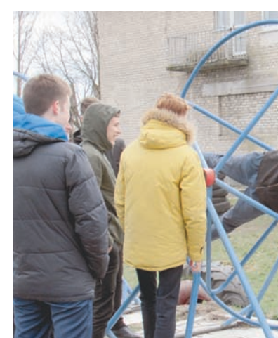
...и в условиях перегрузки.

Вот такое молодое поколение сейчас вступает во взрослую жизнь – продвинутое, немного взбалмошное, прямолинейное, не похожее на старших, но в основном правильное и любящее свою страну. Можно с большой долей уверенности сказать, что эти юноши с честью исполнят в дальнейшем свой гражданский долг и будут достойны звания защитника Отечества.