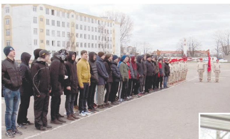
Торжественное открытие мероприятия.

– Это стало возможным благодаря тем изменениям, которые целенаправленно реализуются руководством Вооружённых Сил России, – сообщил военный комиссар Калининградской области. – Во-первых, повысилась привлекательность военной службы, улучшились условия её прохождения. Во-вторых, за счёт увеличения количества