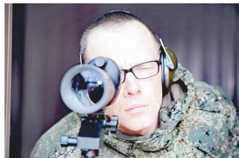
Оценка стрельбы в монокуляре.

Газета зарегистрирована в Министерстве печати и информации РФ. Рег. № 01952 от 30.12.1992 г.