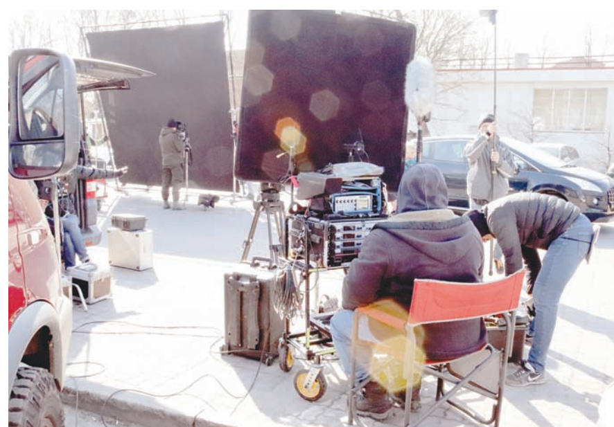
Звукооператоры за работой.

И тут, если бы не большое количество людей и аппаратуры, горожане просто проходили бы мимо. Кого в Калининграде удивил вид двух офицеров? Да, беседовали они друг с другом с излишней эмоциональностью, но ведь живые люди. Ма-