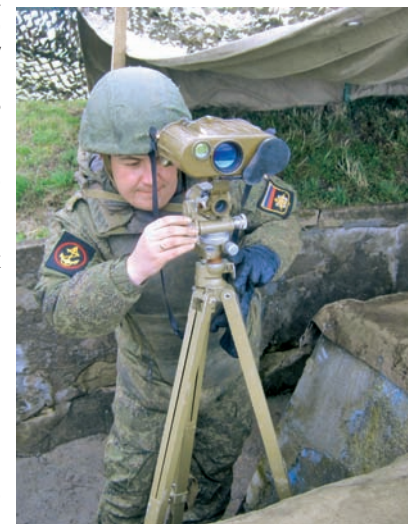
Оборудованный полигонный дальномерный пост.

карточкой не только морской пехоты, но всего Балтийского флота. И вправду говорят, что без лаборатории огневой подготовки не может быть боеспособности воинских частей и подразделений.