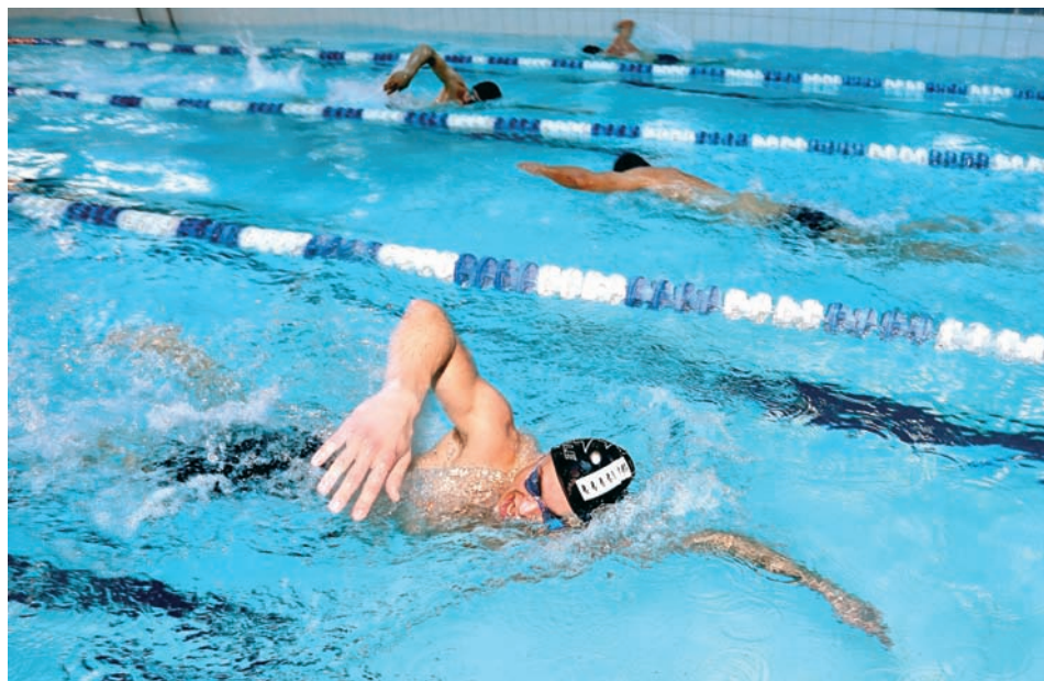
Борьба на водной глади.