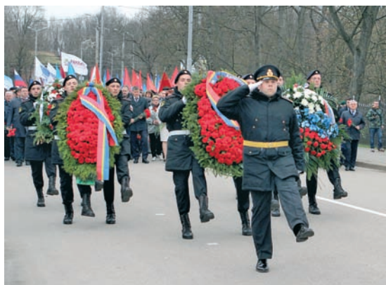
Церемония возложения венков.

В мероприятии приняли участие командование и военнослужащие Балтийского флота, представители правительства Калининградской области и администрации города Калининграда, ветераны Великой Отечественной войны и военной службы, жители Калининграда, представители религиозных, общественных и молодёжных организаций.