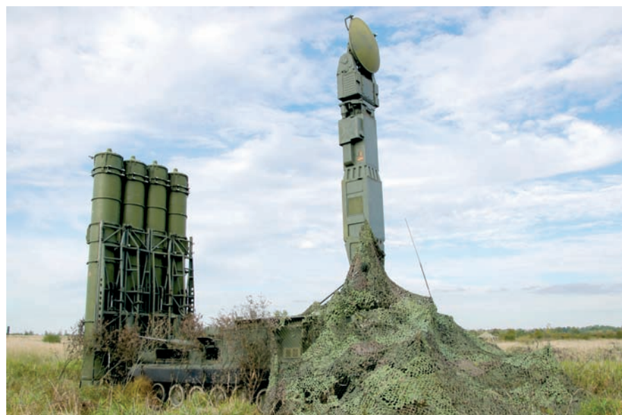
ЗРК С-300 на позиции.

На основании директивы Генерального штаба Вооружённых Сил Советского Союза на основе 153-го отдельного зенитного ракетного полка Ленинградского военного округа 20 апреля 1967 года