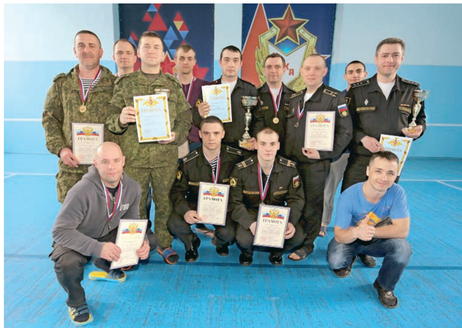
Победители чемпионата после награждения.

спорту. Занимается с детства плаванием, рукопашным боем, триатлоном. Является кандидатом в мастера спорта.