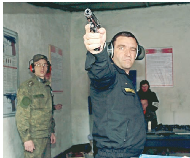
Стрельба из пистолета Макарова.

Однако в этом году больше военнослужащих дошли до финиша. Отметим, что по условиям проведения троеборья если спортсмен в одном из видов получает «баранку» (не набирает необходимый минимум), то он снимается с со-