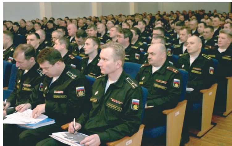
В зале заседания.