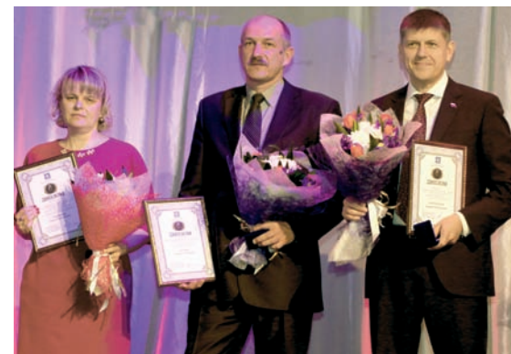
Победители конкурса ежегодной премии «Патриот Земли Российской».