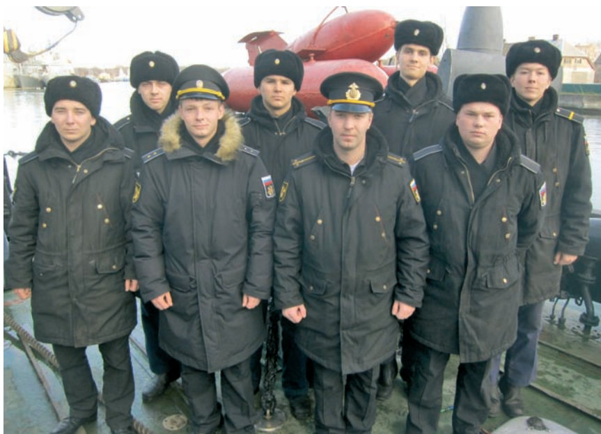
Лучший тральный расчёт БТ «Сергей Колбасьев».

равления. Другими словами, перед началом охоты на морские мины экипажи проводят своеобразную разминку уже освоенных навыков боевого мастерства.