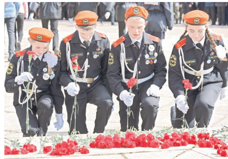
Цветы павшим героям.

двери распахнул, например, Калининградский филиал Санкт-Петербургского университета МВД России, на базе которого организовано караульное помещение «Поста №1» и где ребята могут посетить лучший в регионе музей оружия.