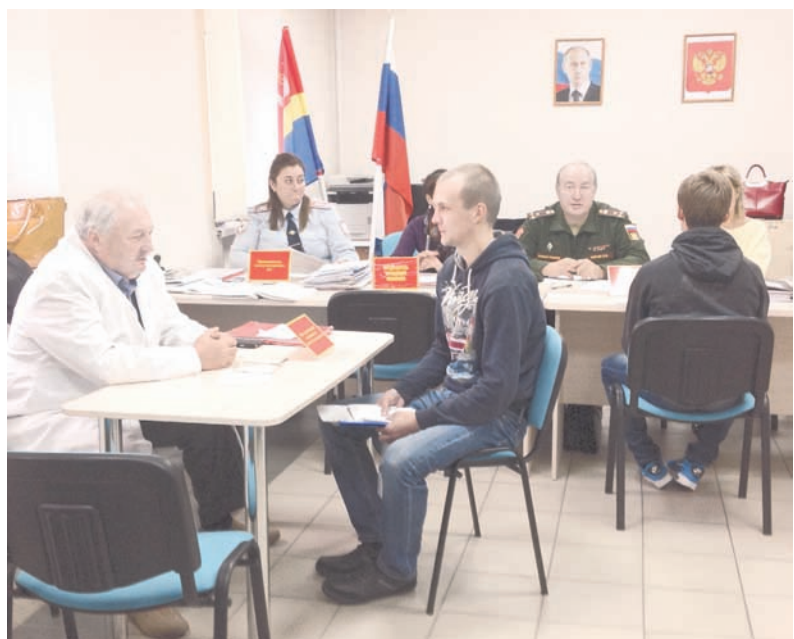
Идёт работа призывной комиссии.

Понятно, что призыв – это только часть того, что входит в зону ответственности военного комиссариата. В перечне многочисленных функций военкомата – социальное обеспечение военных пенсионеров и ветеранов Великой Отечественной войны. Одним из важнейших направлений является работа по военно-патриотическому воспитанию молодёжи. Она строится в тесном взаимодействии с властями муниципалитетов, представителями ветеранских и молодёжных патриотических организаций, в частности, с активно развивающимся в России юнар-