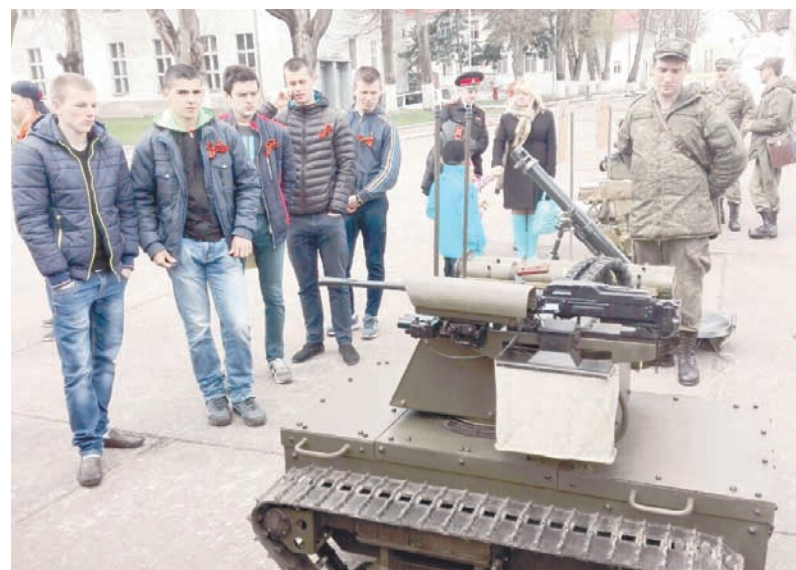
Молодые ребята на выставке вооружения и техники.