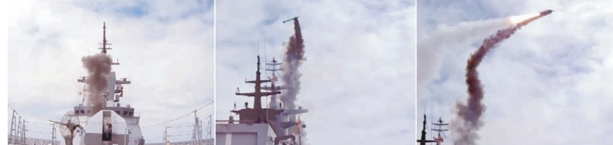
Пуск зенитной ракеты комплекса «Редут».