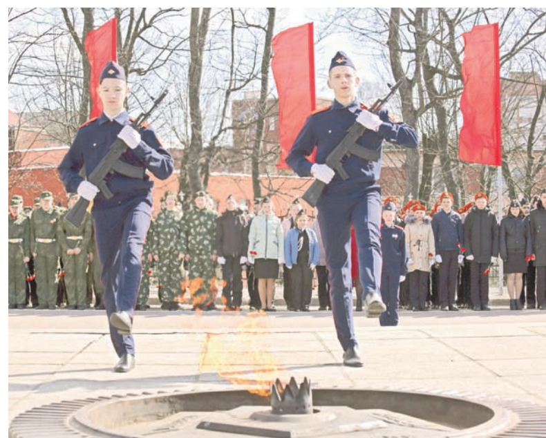
Почётный караул у Вечного огня.

Штурм города-крепости начался 6 апреля 1945 года. Тогда 43-я, 50-я и 11-я гвардейские армии прорвали укрепления внешнего обвода обороны Кёнигсберга и начали штурмовать город. 7 апреля активные боевые действия вела авиация, совершив за сутки более 4700 вылетов и сбросив на врага около 1600 тонн бомб. Советские пехота и танки, продвигаясь к центру, овладевали кварталами и фортами. 8 апреля гарнизон Кёнигсберга был окружён и расчленён на части. 9 апреля в 21 час 30 минут командант города подписал приказ о прекращении боевых действий. Губернатор Калининград-