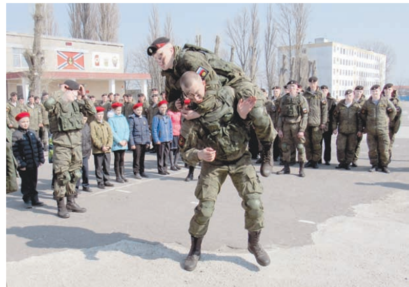
Показательные выступления морских пехотинцев БФ.

Думается, что для ребят этот день не только запомнится на всю жизнь, но и станет своеобразной путеводной звездой на ближайшие годы.