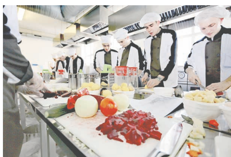
Конкурсанты за приготовлением пищи.