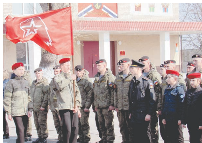
На знамя смирно!

В нашей стране набирает силу Всероссийское детско-юношеское военно-патриотическое общественное движение «ЮНАРМИЯ», созданное три года назад. Его главные цели – всестороннее духовно-нравственное, социальное, физическое, интеллектуальное развитие личности школьников и военно-патриотическое воспитание. Возрождение старых добрых традиций детских организаций формирует молодое поколение граждан, бережно относящихся к истории и традициям России, готовых строить и защищать будущее своей страны.