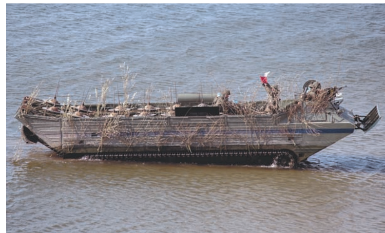
Минирование водного участка побережья.