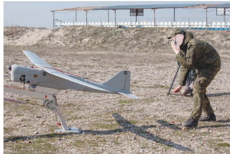
Запуск беспилотного летательного аппарата «Орлан-10».