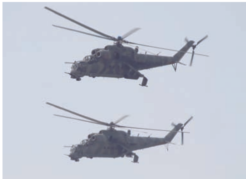
Группа поддержки десанта — вертолёты Ми-24.

при спуске с корабля волноотражающий щиток не закрылся. Если это произойдёт, то бронетранспортёр может черпануть воды, что негативно скажется на скорости движения.