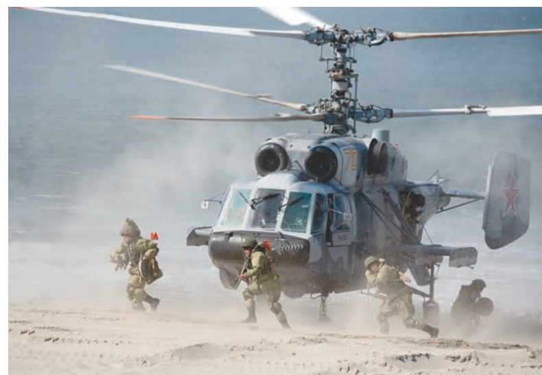
Высадка группы разграждения на берег.