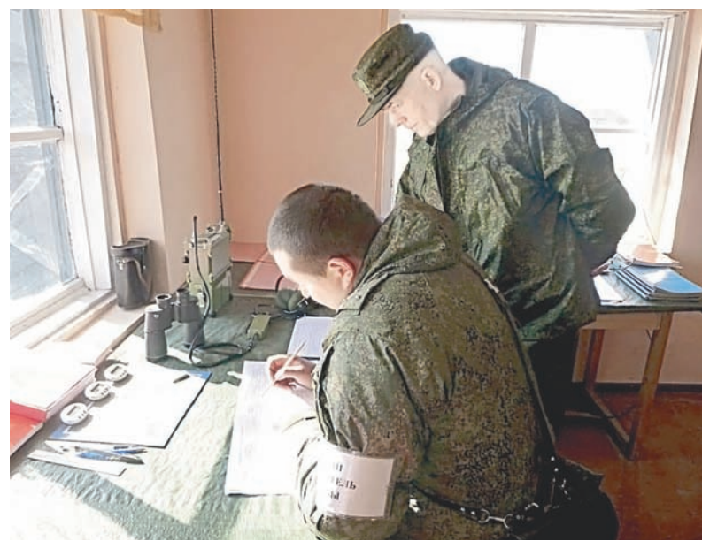
Командующий БФ адмирал А.Носатов проверяет готовность батальона к стрельбам.

1 На старт выходили по три экипажа, в составе которых были командиры танка (в батальоне все они — контрактники), наводчик-оператор и механик-водитель (на этих должностях — военнослужащие по призыву).