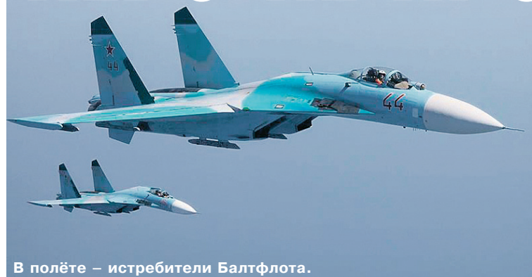
В полёте – истребители Балтфлота.

Притягательный по своей красоте и загадочности Пятый океан всегда таит опасность. Не случайно в авиации традиционно первостепенное внимание уделялось именно безопасности полётов. Недавно на Балтийском флоте состоялась конференция на тему «Обеспечение безопасности полётов при проведении лётно-тактических учений с выпол-