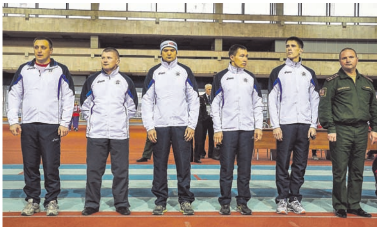
Команда балтийцев на «Командирских стартах».

сменами, которые входят в сборную ВС РФ, в крупных соревнованиях участвуют именно те военнослужащие, которые практически 12 месяцев в году занимаются только спортом. На Балтийском флоте все военнослужащие, которые занимают какие-то места в чемпионатах, проходят службу как и полагается, а спортом и физической подготовкой они занимаются в отведённое для этого часы либо в личное время».