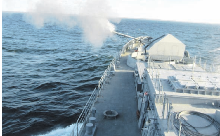
Практические стрельбы корабельной артустановки «А-190».

ряда пристрелочных и двадцать шесть на поражение. Средства объективного контроля фиксировали точность