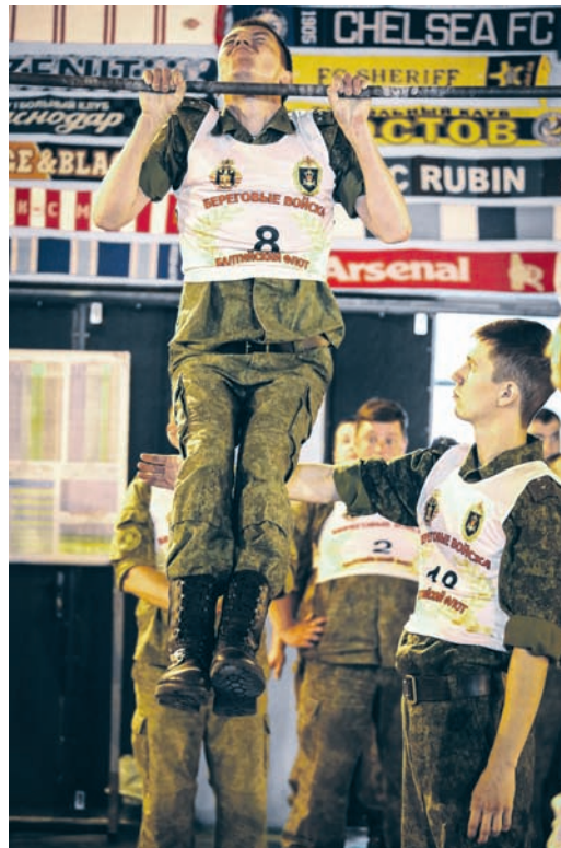
Идут соревнования по подтягиванию на перекладине.

который в какой-то степени влияет на потенциал и дальнейшие результаты. Один полк почти в три раза больше другого. Это решили учесть. Крупные соединения будут, как правило, в груп-