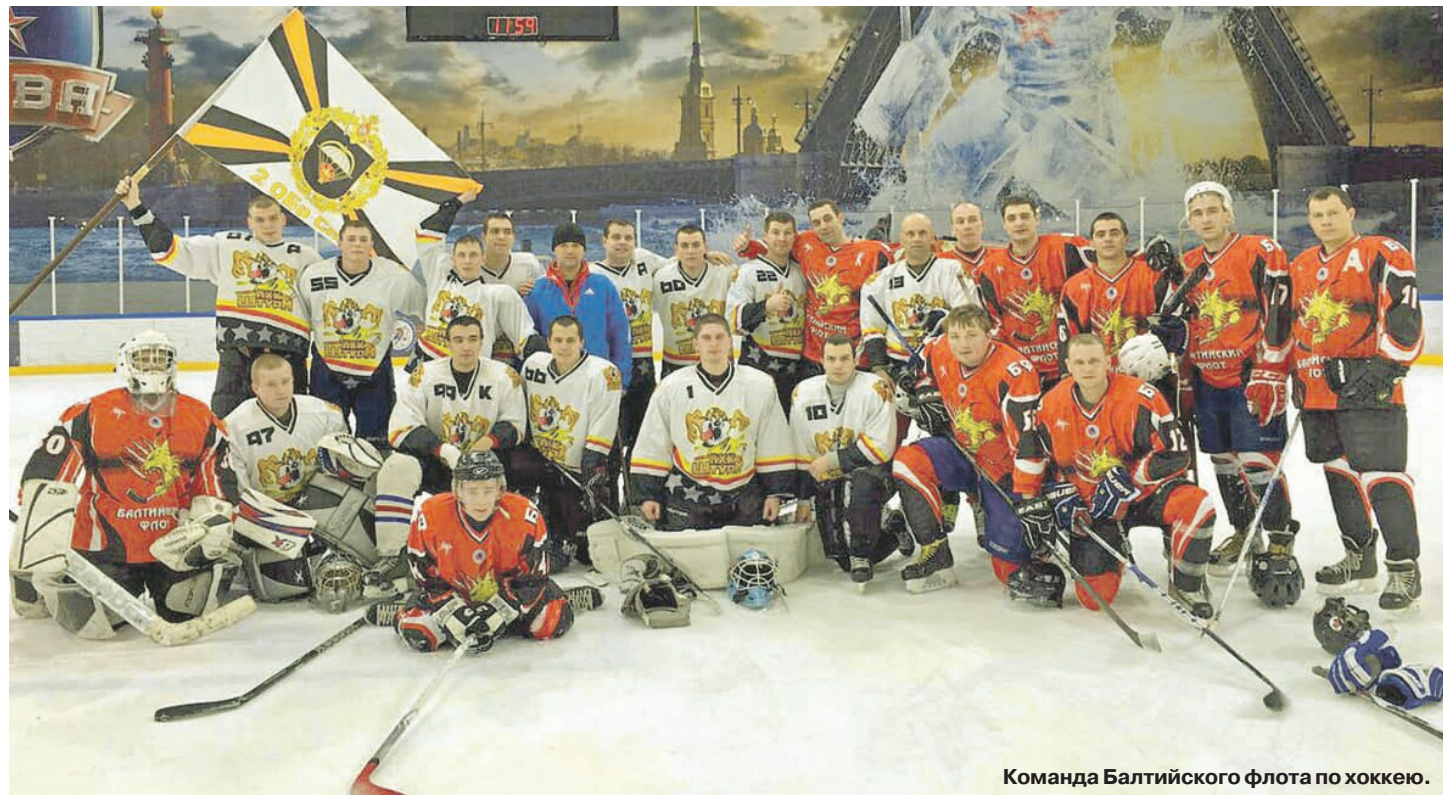
Команда Балтийского флота по хоккею.

С начала октября начнётся новый сезон. Идёт подготовка к чемпионату ВМФ, к первенству ЗВО и к соревнованиям лучших сборных в Вооружённых Силах.