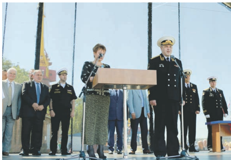
Выступает вице-адмирал С. Попов.