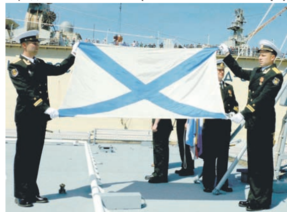
Церемония подъёма Андреевского флага.