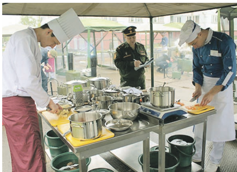
На третьем этапе конкурса.

команд, в составе которых состязались 17 военнослужащих по призыву и военнослужащих контрактной службы. Среди них были пятнадцать