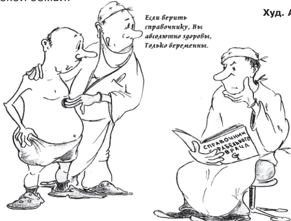
Худ. А. Шауров.