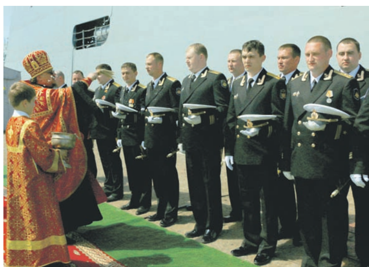
Освящение экипажа совершает архимандрит Софроний.