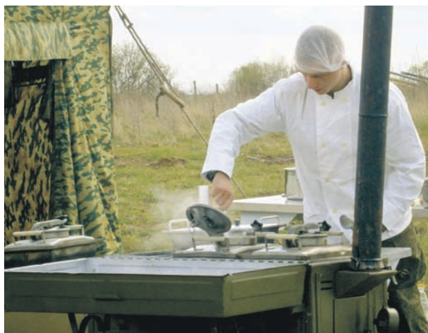
Отборочный тур на Балтийском флоте.

По итогам проведения второго этапа высокие результаты продемонстрировала команда моторострелкового соединения береговых войск. Но всё же чести представлять Балтийский флот на состязаниях в масштабах Западного во-