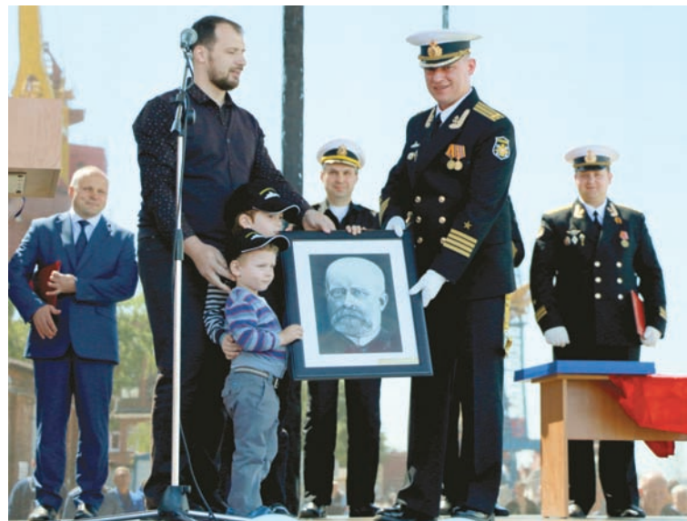
Портрет русского адмирала в дар военным морякам от потомков Н.Эссена.

ступил сотрудник Казанского энергетического университета Николай фон Эссен. Вместе с супругой, правнучатой племянницей легендарного командующего русским