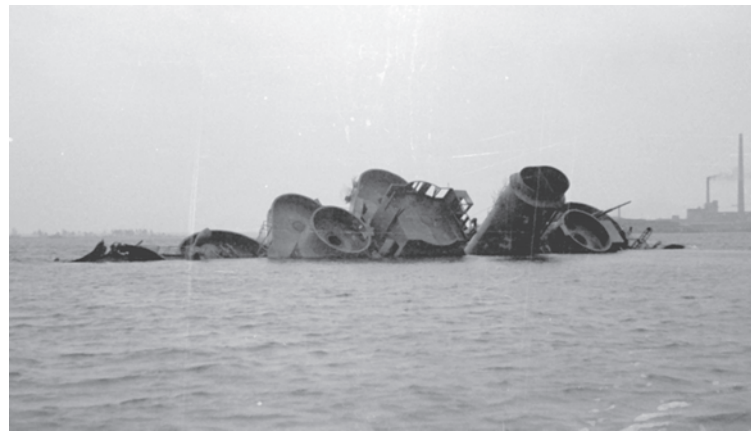
Потопленный советской авиацией в порту Котка немецкий крейсер.

Четырем участникам операции было присвоено звание Героя Советского Союза, а В.Раков был удостоен второй Золотой Звезды Героя. «Вяйнямейнен» же все это время спокойно стоял в шхерах под