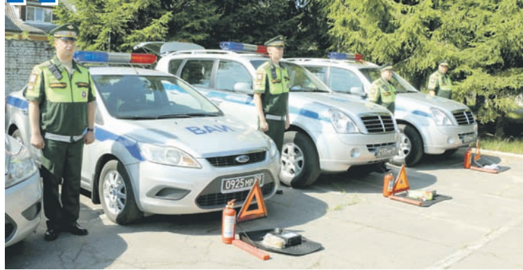
Проверка снаряжения патрульных машин перед выходом на маршрут.

Успех тем более значим, что Калининградская область в силу ряда объективных причин является наиболее сложной с точки зрения организации безопасности дорожного движения, в том числе и на воинском транспорте. Всем хорошо известны узкие дороги региона, плотно обсаженные