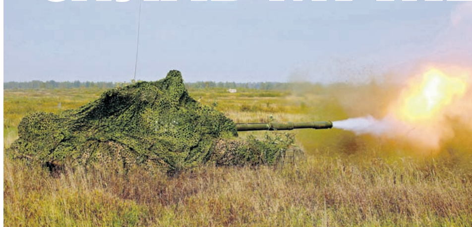
«Стальная конница» на полигоне.

На этот раз танкистам предстояло совместно с артиллерией и мотострелками отразить наступление противника. Для этого они заняли оборону, остановили наступление и продолжили преследование противника до государственной границы. Таков был замысел учения.