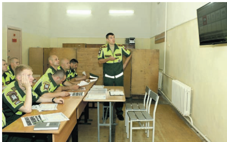
Инструктаж инспекторов ВАИ.