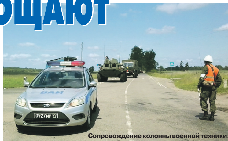
Сопровождение колонны военной техники.

правильно выбрала дистанцию до двигавшегося впереди военного автомобиля КамАЗ, буксируемого на жёсткой сцепке другим КамАЗом. В результате произошло столкновение. Два человека получили лёгкие ранения. Помимо вины женщины в случившемся ДТП очевидна вина должностных лиц воинской части, которой принадлежали КамАЗы. Они не обеспечили должный порядок буксировки транспортных средств, а именно не снабди-