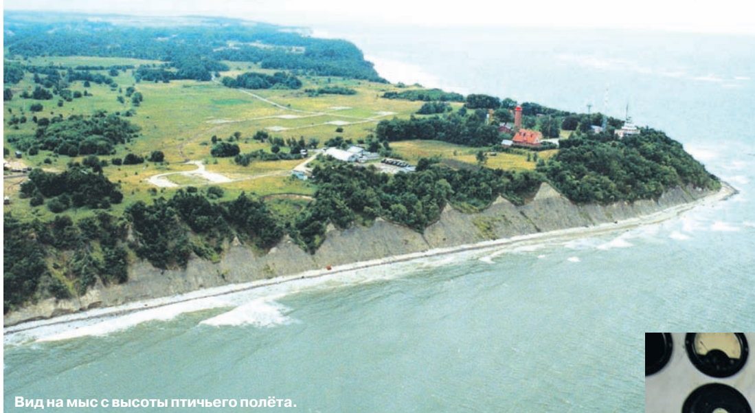
Вид на мыс с высоты птичьего полёта.

В этом месяце знаменитому маяку на мысе Таран в Калининградской области исполняется 170 лет.