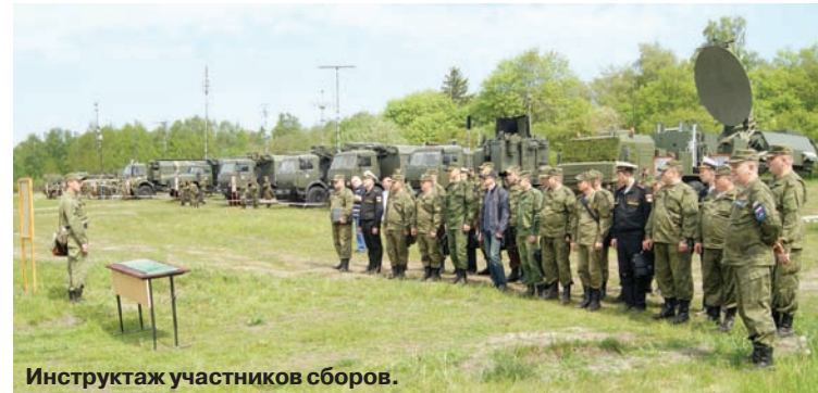
Инструктаж участников сборов.

Стоит отметить, что проведение занятия предшествовала напряжённая работа военнослу-