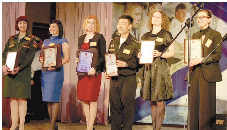
Церемония награждения победителей конкурса.

На остальных учебных местах конкурсанты предлагали свои конкурсные варианты сопровождения боевых упражнений. И каждый, надо отметить, был ориентирован в своей работе. Членов жюри