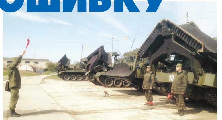
Инженерная техника выходит на учение.

Не успели гвардейцы переодеться после парада, как последовала команда на выезд. Где-то в районе города Светлого хозяин частного домика откопал у себя на огороде два снаряда.