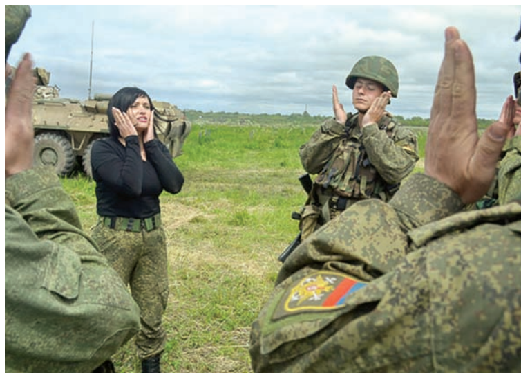
Комплексное упражнение перед выполнением учебно-боевой задачи.