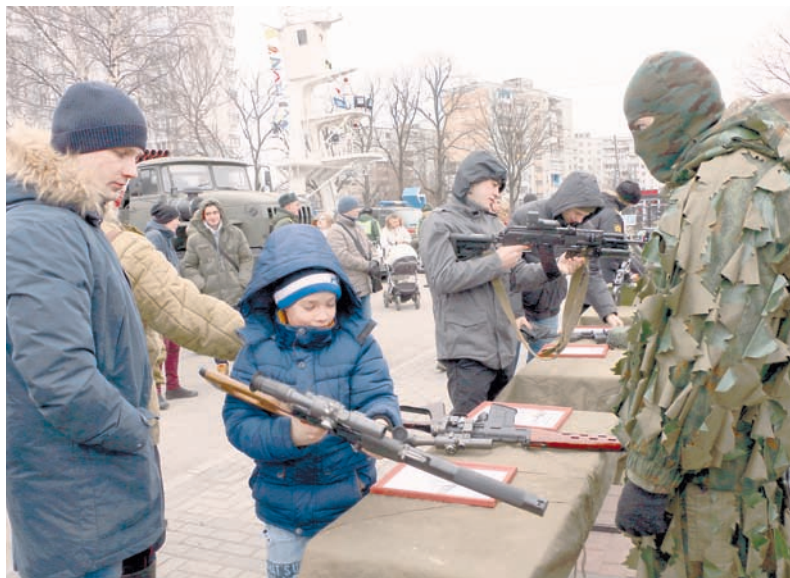
На выставке вооружения и техники.

Недалеко от боевой техники разместились информационно-агитационные палатки, где офицеры, отвечающие за кадровую работу в частях и соединениях БФ, рассказывали заинтересованным молодым людям об особенностях и преимуществах военной службы