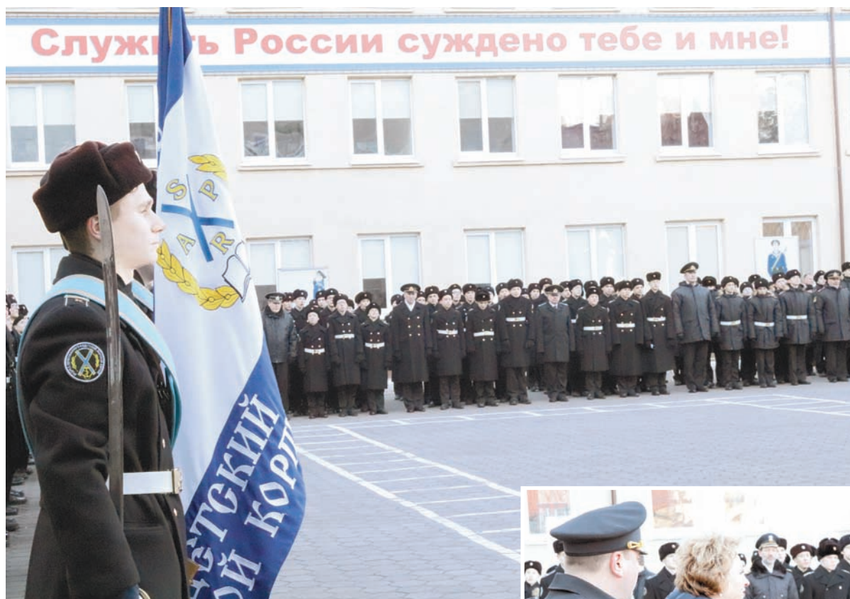
Торжественное построение корпуса.

З дравия желаю, товарищ гвардии подполковник!