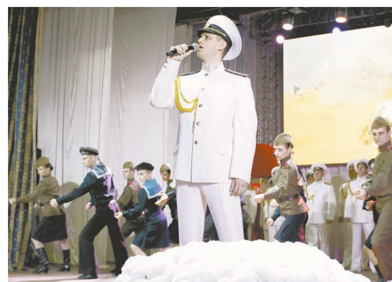
На сцене Ансамбль песни и пляски ДКБФ.

По завершении официального части торжественного собрания состоялся праздничный концерт, подготовленный артистами ансамбля песни и пляски дважды Краснознамённого Балтийского флота.