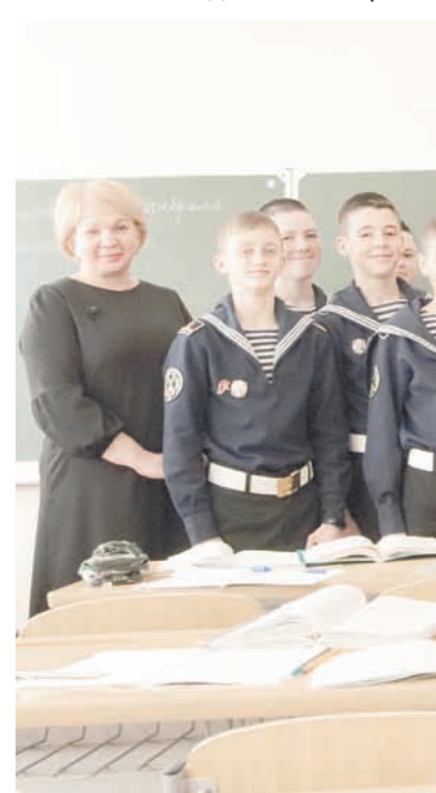
Фото на память.

дельную гвардейскую бригаду морской пехоты. Здесь, причём тоже в десантном штурмовом батальоне, он служил с 1992 по 1996 год. 1995-й стал годом первой командировки в Чечню. Теперь ежегодно 18 января на Балтийском флоте проводится День памяти морских пехотинцев, погибших при выполнении боевых задач на Северном