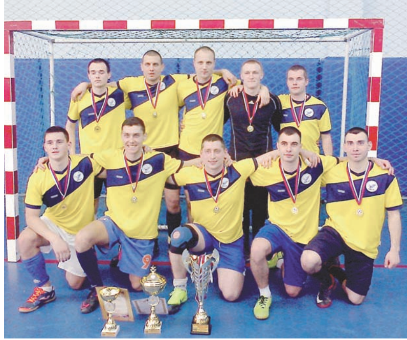
Команда «Анкер» – чемпион БФ по мини-футболу в зале.