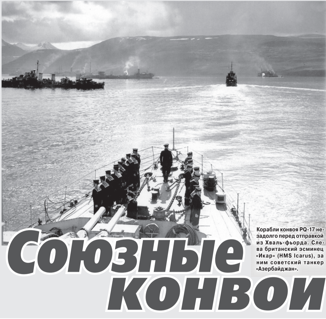
Корабли конвоя PQ-17 незадолго перед отправкой из Хваль-фьорда. Слева британский эсминец «Икар» (HMS Icarus), за ним советский танкер «Азербайджан».

Планируя войну против Советского Союза, гитлеровское руководство рассчитывало на политическую изоляцию нашей страны. Однако сразу после нападения Германии на СССР правительство Великобритании заявило о совместной с Советским Союзом борьбе против фашистской Германии. Уже в июле 1941 года Советское правительство подписало соглашение о совместных действиях в войне против Германии с правительствами Великобритании, Чехословакии и Польши. А 16 августа 1941 года между СССР и Великобританией было заключено соглашение о взаимных поставках, кредите и порядке платежей. На его основании британское правительство приняло решение об оказании Советскому Союзу помощи вооружением и стратегическими материалами.