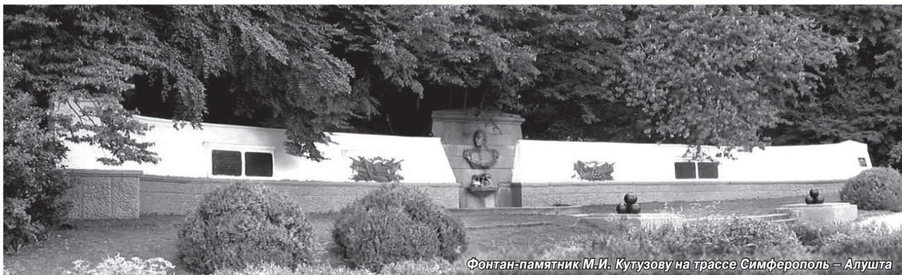
Фонтан-памятник М.И. Кутузову на трассе Симферополь – Алушта

Кутузов был против плана императора преследовать Наполеона в Европе, но долг обязывал подчиниться. Тяжело больной военачальник до Парижа не дошел. Кутузов скончался в прусском городе Бунцлау. Император распорядился забальзамировать тело фельдмаршала и доставить в Петербург. В северную столицу гроб везли полтора месяца: приходилось останавливаться. Всюду люди хотели проститься с Кутузовым и оказать достойные почести спасителю России.