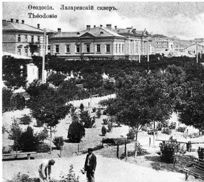
Феодосия. Лазаревский сквер. Théodosie