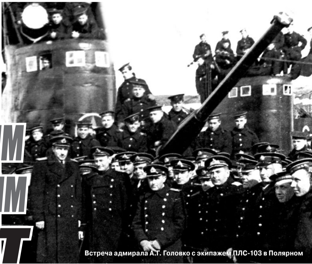
Встреча адмирала А.Г. Головки с экипажем ПЛС-103 в Полярном