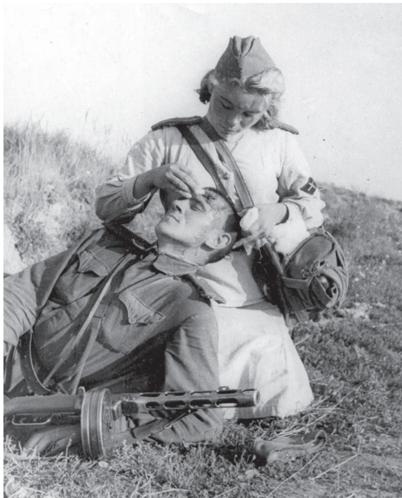
Оказание первой помощи на поле боя (не ранее 1943 г.).

В дни революции Академия не прерывала своей работы, не участвовала в саботаже. В ноябре в химической ау-