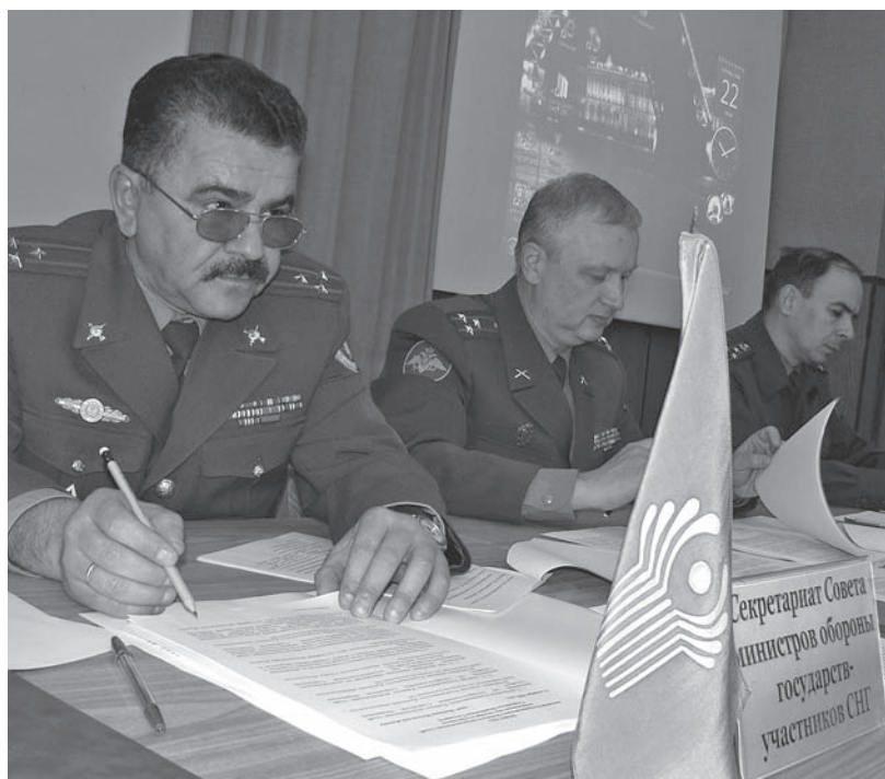
Секретариат Совета министров обороны государств-участников СНГ за работой.