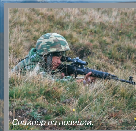
Снайпер на позиции.

Ротные тактические учения (РТУ) являются одной из важнейших форм обучения военнослужащих. Поэтому в наших Вооруженных Силах именно такому виду учений уделяется большое внимание. При этом каждое подразделение старается «отыграть» РТУ на таком участке местности, который наиболее похож на участок местности его боевого предназначения. Так, в одной из мотострелковых рот 34-й бригады было проведено ротное тактическое учение без боевой стрельбы на высоте около двух тысяч метров над уровнем моря.