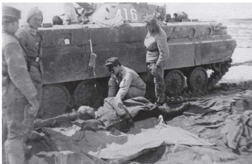
Оказание медицинской помощи на марше (Афганистан 1986 г.).

дитории красногвардейцам и рабочим Выборгского района читались лекции по вопросам оказания первой медицинской помощи. Во время наступления Краснова на Петроград группы студентов и врачей ушли на фронт. Не прекращалось лечение раненых и больных в академических клиниках.