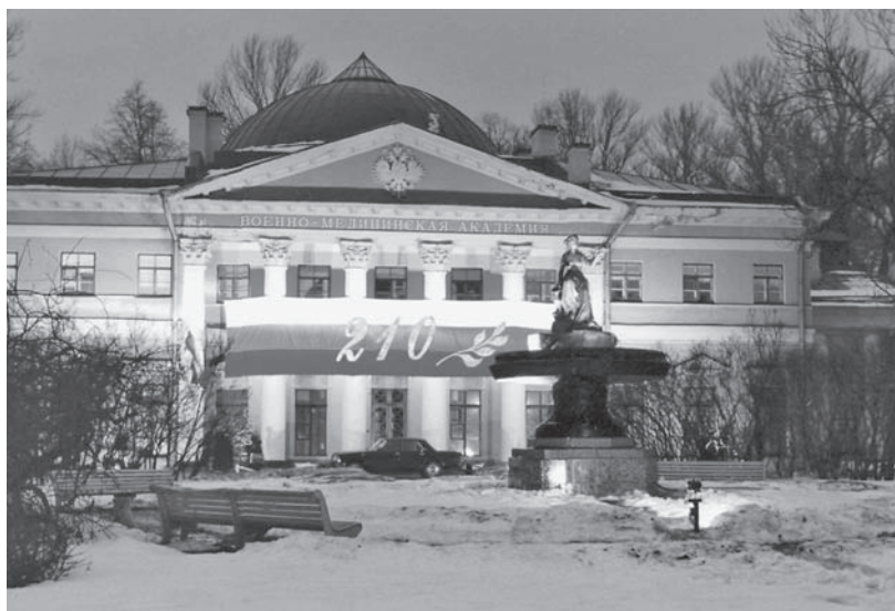
Здание штаба академии (главный корпус).

Во-вторых, спецификой академической школы обучения была тождественность терапии и хирургии как учебных дисциплин. В отличие от западных школ хирургия в России не рассматривалась как ремесло, нечто второстепенное, более низкое, чем терапия. Терапия и хирургия существовали как равноправные