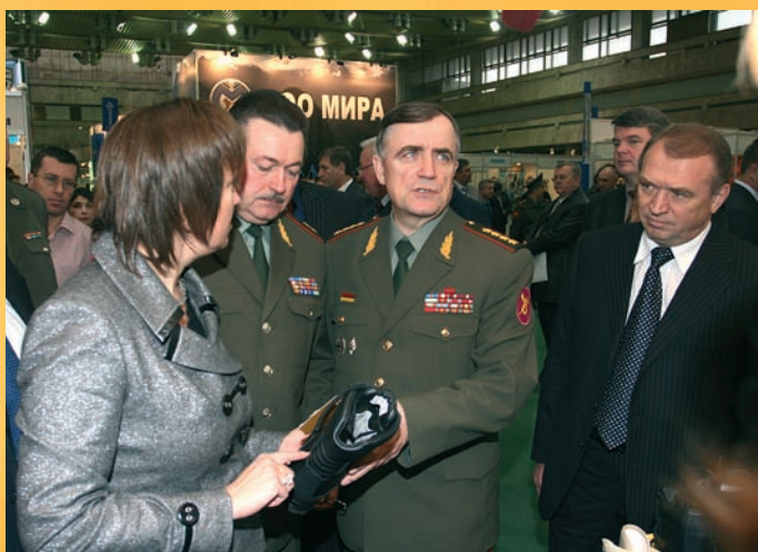
Генерал армии Владимир Исаков ознакомился с новыми моделями военной обуви.