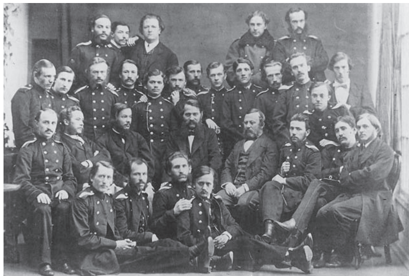
В. Грубер (в центре) и И. Сеченов (справа от Грубера) в Военно-медицинской академии с группой студентов (1899 г.).

Начиная с середины XIX в. стал изменяться социальный состав студентов МХА. Так в 1857 г. на 1 тыс. человек студентов Академии 500 были дворянами и выходцами из духовного звания (порочну), 235 — разночинцами, остальные — детьми купцов, офицеров и иностранцев. Начиная с середины XIX в. количество студентов-разночинцев в Медико-хирургической академии непрерывно увеличивалось, а выходцев из духовенства и дворян становилось все меньше и меньше.