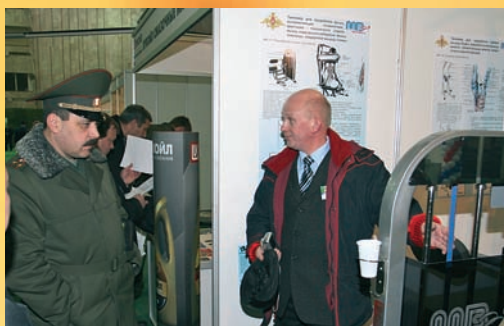
Новый тренажерный комплекс для индивидуальных занятий.