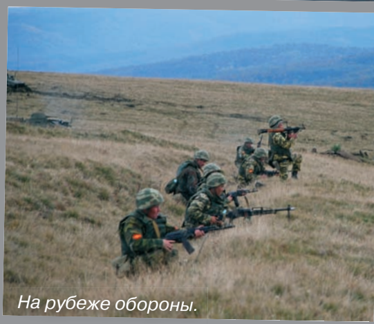
На рубеже обороны.

На рассвете первым с условным противником столкнулось боевое охранение, которое заблаговременно выдвинулось на полтора километра вперед. При соприкосновении с противником охранение начало отход. Боевые машины поочередно отходили, прикрывая друг друга огнем. Затем отрабатывались вопросы уничтожения противника при выдвигании, развертывании в ротные, взводные колонны, при спешивании, переходе в атаку и преодолении минно-взрывных заграждений. Когда же условный противник был на переднем крае обороны и вклинился между