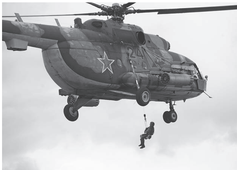
Авиамедицинская эвакуация раненого из труднодоступных мест.

лена 219 профессорами, 372 доцентами, 376 докторами и 1007 кандидатами наук. В Академии работает каждый четвертый ученый из числа научных работников ВС РФ, в их числе 4 академика и 4 члена-