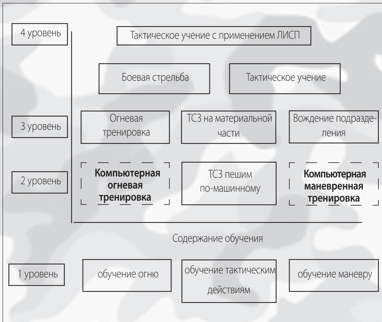
Рис. 1. Система форм боевой подготовки.

Реализация предложенной методики организации боевой подготовки позволит без существенных материальных и организационных затрат создать основу для приведения системы боевой подготовки войск ВС РФ в соответствие с изменившимися условиями; повысить качество подготовки офицеров, органов управления и войск; готовить их к выполнению боевых задач в соответствии с изменившейся направленностью боевой подготовки ■.