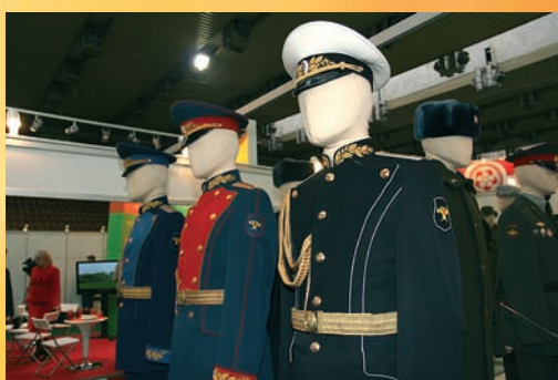
Военную форму нового образца теперь можно не только увидеть, но и потрогать.