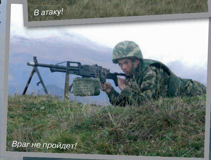
Враг не пройдет!