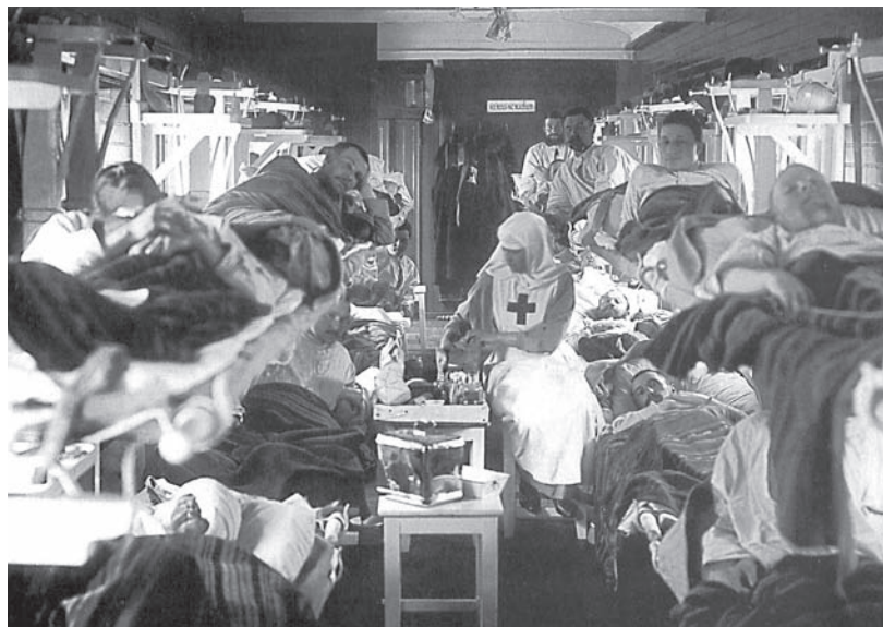
Раненые в вагоне военно-санитарного поезда (1915 – 1917 гг.).