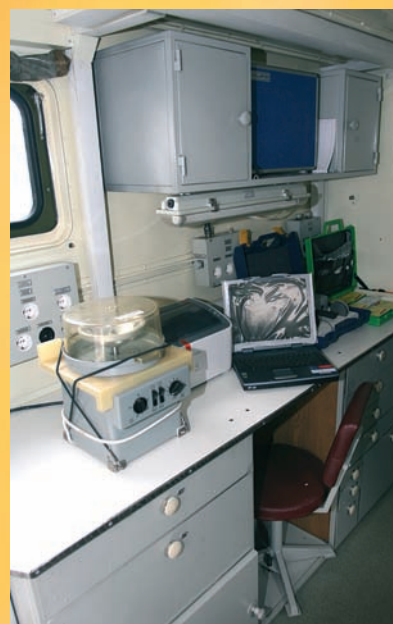
Впервые на выставке представлена ЛВД-АМ (мобильная лаборатория ветеринарно-диагностическая автомобильная).