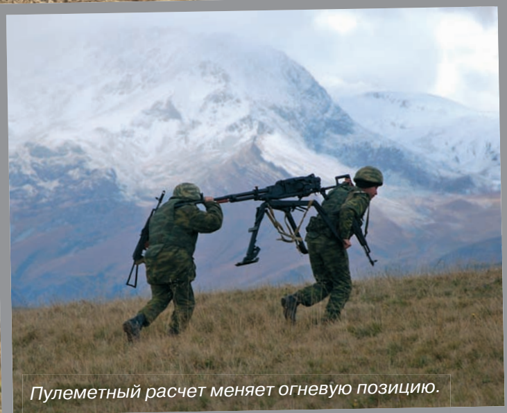
Пулеметный расчет меняет огневую позицию.