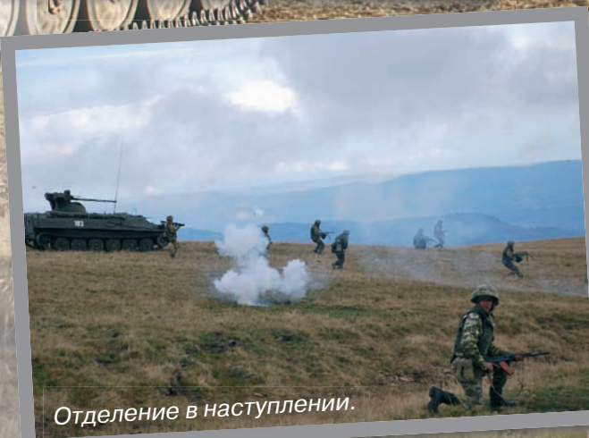
Отделение в наступлении.