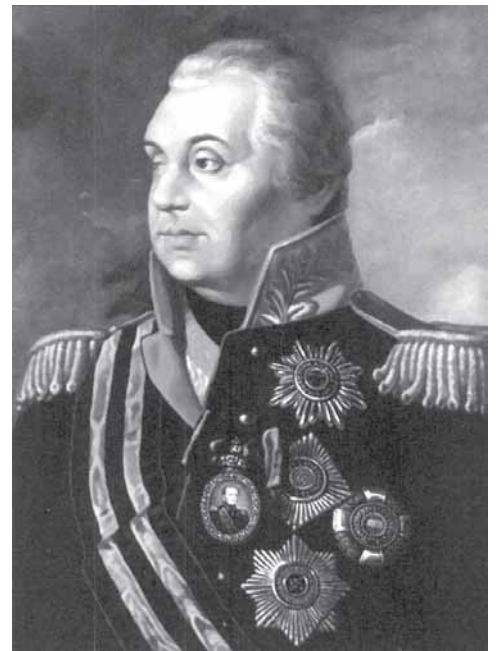
Генерал-фельдмаршал, святейший князь Смоленский М.И. Голенищев-Кутузов, Герой Отечественной войны 1812 года.

генерал-губернатора. Не найдя взаимопонимания с молодым императором, он в 1802 году ушел в отставку и уехал в деревню. Однако его отход оказался непродолжительным. В августе 1805 года Михаил Илларионович был назначен главнокомандующим русской армией, направленной на помощь Австрии в войне с Наполеоном. Едва вступив в пределы Австрии, армия Кутузова из-за капитуляции австрийцев под Ульмом оказалась лицом к лицу с вдвое превосходящей ее французской армией. С 13 октября по 10 ноября Кутузов совершил знаменитый отступательный марш-маневр от Браунау к Ольмюцу. Отражая по пути уда-