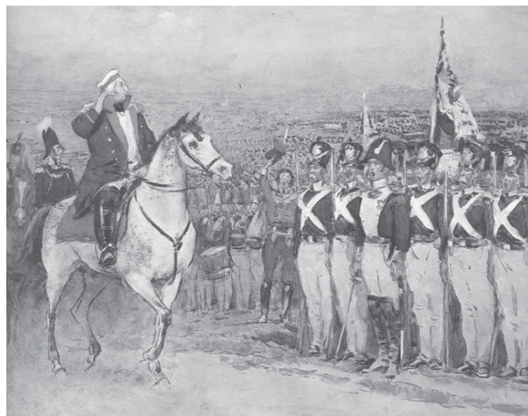
Прибытие М.И.Кутузова к армии у Царева Займища.

При восшествии на престол Александра I Кутузов получил назначение на пост петербургского