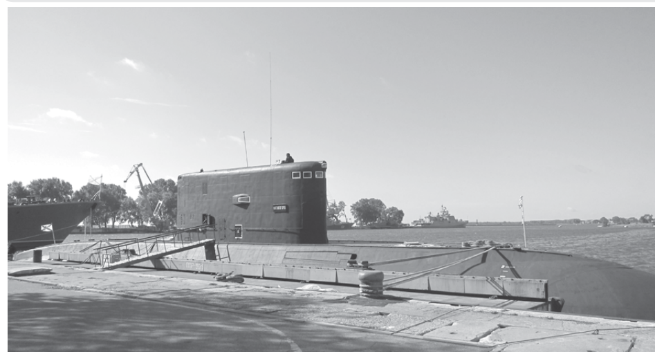
ПЛ «Магнитогорск» у балтийского причала.