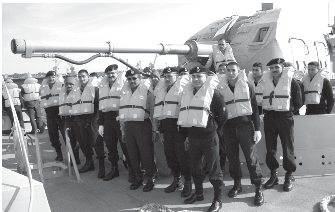
Швартовая команда индийского экипажа.

у меня остались от посещения Санкт-Петербурга. Это самый красивый город на земле. Я много слышал о его величии и красоте, но когда увидел город воочию, то был просто поражен. Приятные впечатления оставил и Калининград. Уютный и симпатичный город, приветливые жители. В столице янтарного края есть достаточно мест, которые