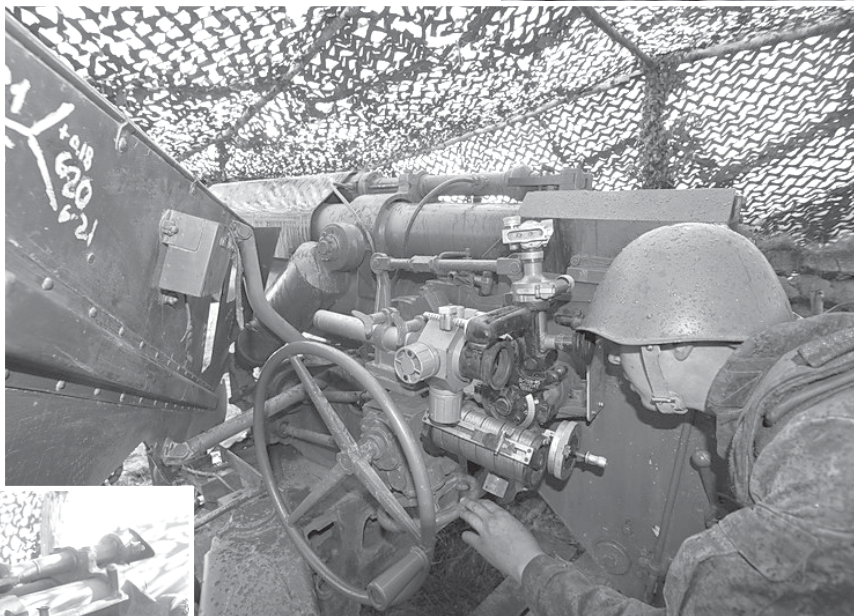
Успешная стрельба во многом зависит от мастерства наводчика.

Каждый военнослужащий должен продемонстрировать то, чему его научили за две недели интенсивных тренировок. Наводчик - подтвердить, что он умеет наводить орудие, командир орудия - управлять своим расчетом, заряжающий - заряжать