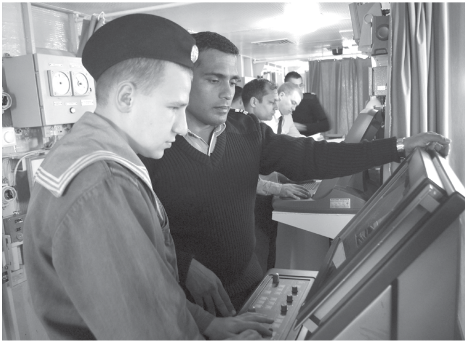
Индийские моряки внимательно следят за действиями российского экипажа.

Точный залп корабельного зенитного ракетного комплекса средней дальности «Штиль-1» венчал завершение государственных ходовых испытаний фрегата Tarkash («Колчан»), построенного на Прибалтийском судостроительном заводе «Янтарь» для ВМС Индии.