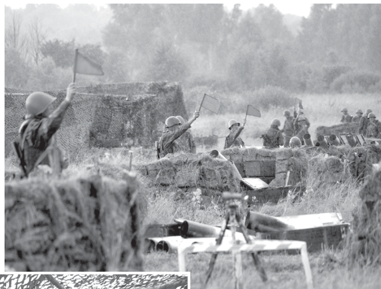
На огневой позиции.

По опыту могу сказать, солдаты с сожалением покидают по-