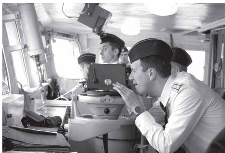
Идет проверка оборудования корабля.

– Насколько быстро индийские моряки учатся управлять построенным на российском заводе фрегатом?