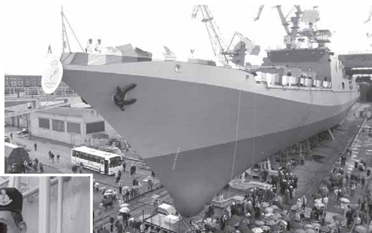
Спуск корабля на воду.

Как о российском экипаже, так и о контрагентах могу сказать – это настоящие профессионалы. Они делают все возможное, чтобы обучение прошло успешно, и чутко реагируют на наши просьбы и предложения.