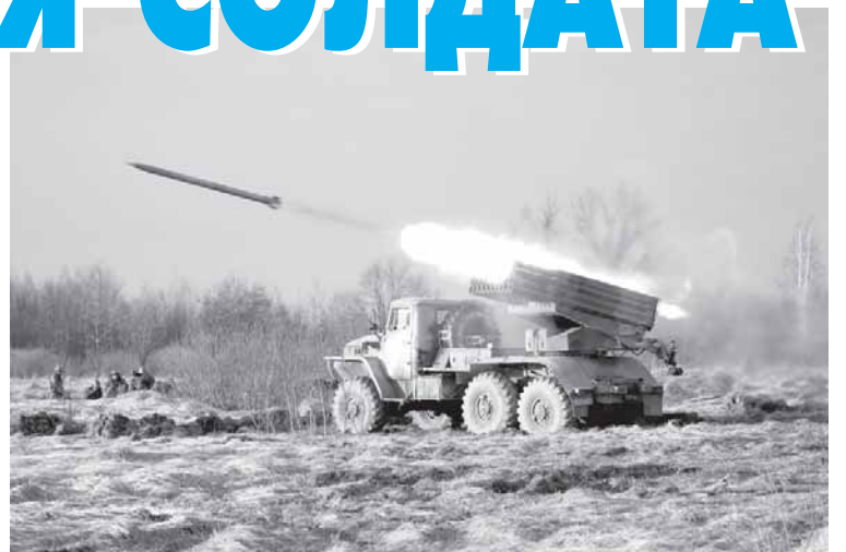
Реактивная установка залпового огня в действии.