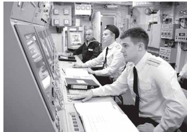
В посту энергетики и живучести.

Сильный флот всегда был гарантом безопасности государства. Так будет и впредь. Будут у нашего флота новые, хорошие корабли. А моряков-надводников ждут новые учения и дальние походы.