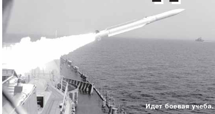
Идет боевая учеба.