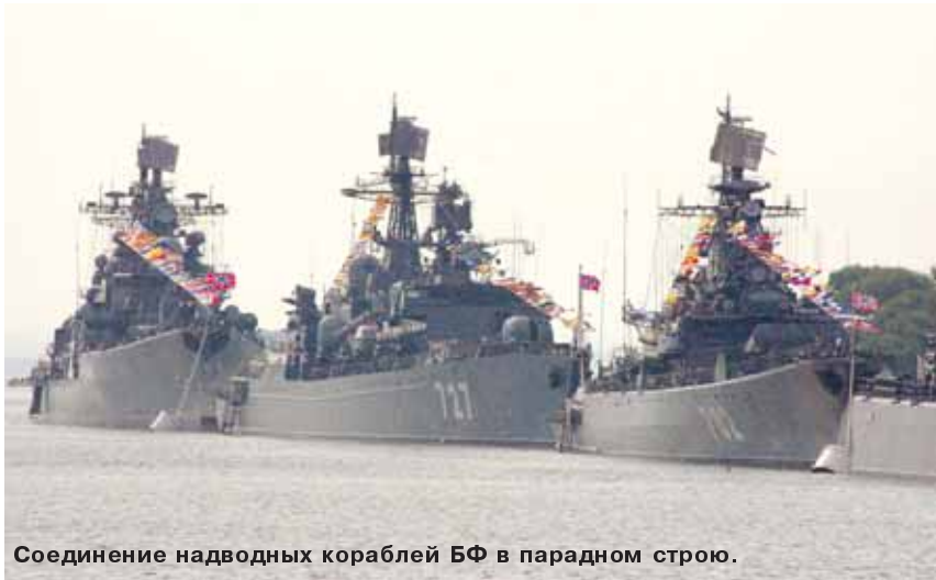
Соединение надводных кораблей БФ в парадном строю.