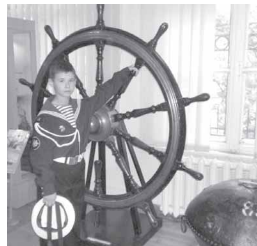
Гости музея – будущие флотоводцы.

зой для развития музея, и с получением централизованного финансирования в ней откроется постоянно действующая экспозиция. А экскурсии в крепость по-прежнему проходят по субботам и воскресеньям для военнослужащих и членов их семей, для горожан и гостей нашего города. Уверен, что присоединение к Центральному