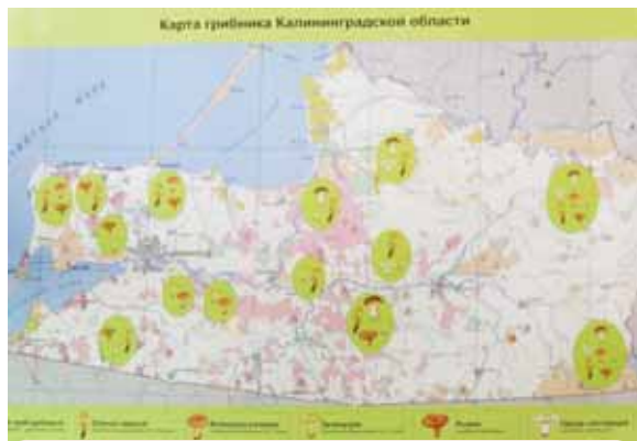
Грибные места Калининградской области: Балтийский лес, окрестности замка Бальга, Новоселовский заказник, леса вокруг Правдинска, Гвардейска, Полесска, Нестерова, Краснознаменска.

В Калининградском областном историко-художественном музее в разгар грибного сезона открылась выставка, посвященная царству грибов. Здесь можно не только научиться отличать съедобные грибы от несъедобных, но и узнать, тихая охота в каких лесах нашего края будет самой результативной. А еще сотрудники музея щедро поделятся с вами самыми простыми и самыми изысканными рецептами из лисичек, подберезовиков и шампиньонов.