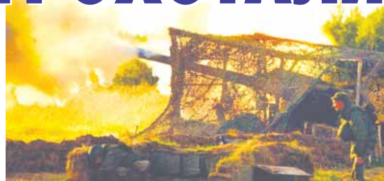
Огонь по цели.

На полигоне же цели расположены на удалении 7 км. Офицеры отмечают, что молодые солдаты