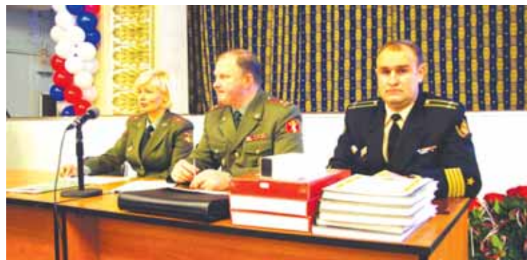
Президиум за работой.