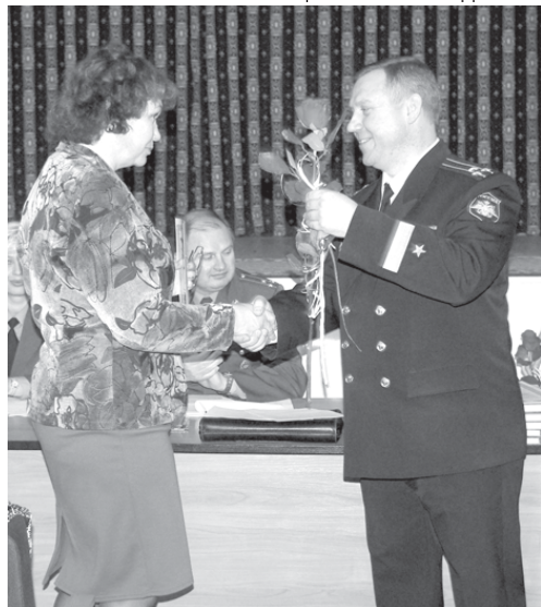
Награды и поздравления лучшим.