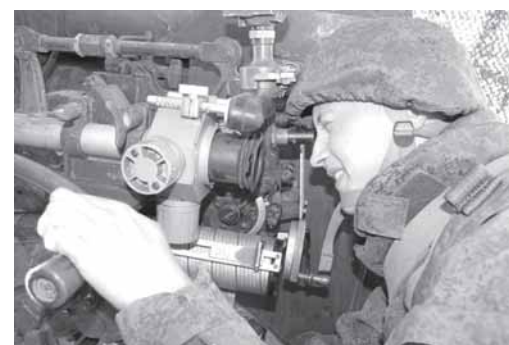
От мастерства наводчика зависит успешная стрельба.