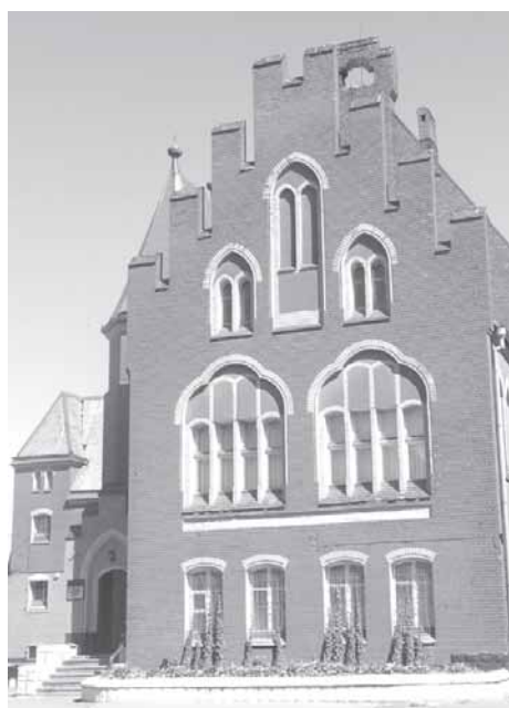
Здание музея БФ в Балтийске.

С момента создания музей вел большую просветительскую и военно-патриотическую работу среди моряков-балтийцев и местного населения. Особенно были востребованы обзорные и тематические экскурсии, выездные выставки на кораблях и частях БФ, уроки мужества, вручение комсомольских билетов в стенах музея и другие мероприятия с участием работников музея.