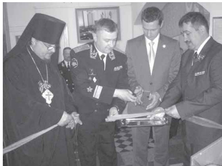
Открытие выставки «Великая Победа».

военно-морскому музею пойдет на пользу его филиалу - музею Балтийского флота. В первую очередь рассчитываем на получение научно-методической помощи, пополнение наших фондов из Санкт-Петербурга, поскольку фонды ЦВММ насчитывают более 700 тысяч единиц хранения, у нас – более 20 тысяч. Площади музея БФ позволяют разместить и эффективно использовать как временные, так и постоянно действующие экспозиции и передвижные выставки. Надеюсь, что это сотрудничество разнообразит тематическое содержание наших музейных экспозиций.