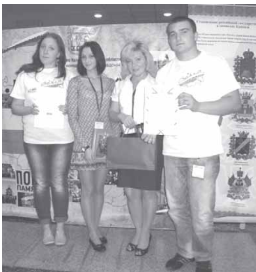
Заслуженные награды посланцев Балтики.