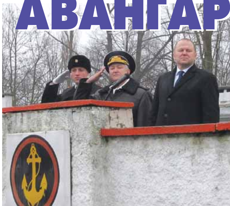
Трибуна почетных гостей.

В ходе подготовки к знаменательному событию «Черные береты» позаботились о том, чтобы все побывавшие на их празднике унесли с собой частицу славы, которой богато прошлое и настоящее гвардейского соединения. Хотя военные торжества всегда подчинены строгому регламенту, их устроители позаботились о том, чтобы внести в них максимум художественности и обаяния.