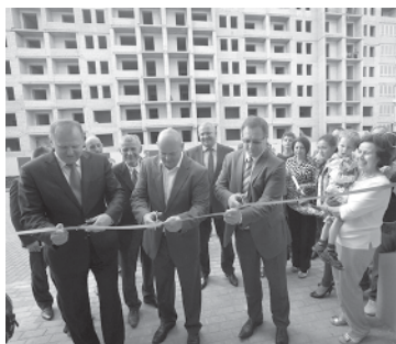
це Левитана, где будут предоставлены квартиры уволенным в запас военным.

С момента передачи полномочий по обеспечению бывших военных жильем на региональный уровень 74 семьям вручены свидетельства на получение денежной выплаты, из них 52 уже приобрели жилье и стали новоселами. Готовятся к сдаче четыре жилых дома в Калининграде на ули-