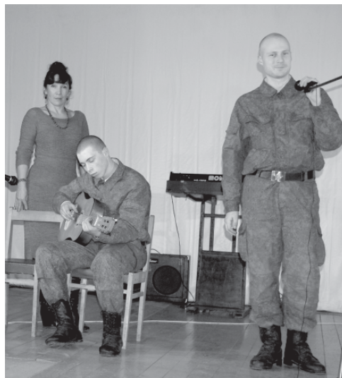
Репетиция в новом клубе.