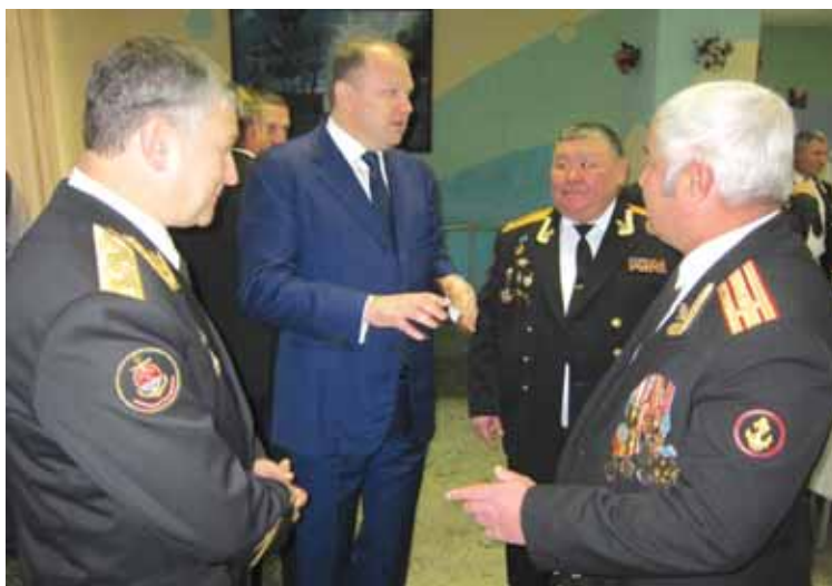
Откровенный разговор с ветеранами соединения.