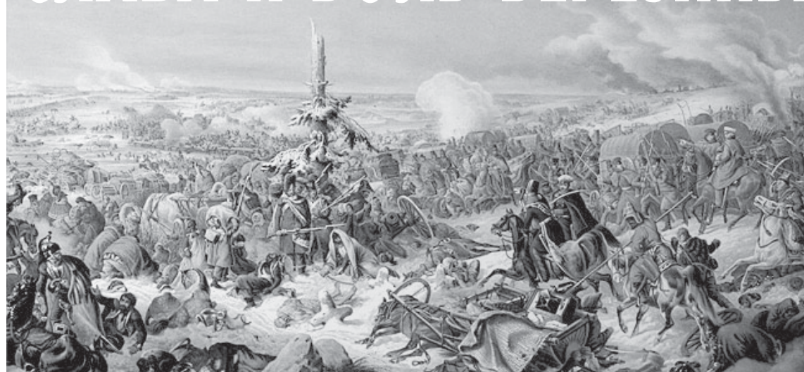
Переправа через реку Березину. П.Гесс. 1840 г.

егерский – в обход правого фланга. Сам Вяземский получил смертельное ранение, из строя вновь выбыло немало солдат и офицеров, но укрепление было захвачено. Егерские полки вышли к мосту, сохранение которого было приоритетной задачей для обеих сторон. К 17 часам город был полностью захвачен. Потери Домбровского составили около 2500 человек и 6 орудий. Отряд Ламберта потерял около 2000 человек, в основном пехотинцев. Потери в ряде полков достигали 50% численности личного состава.