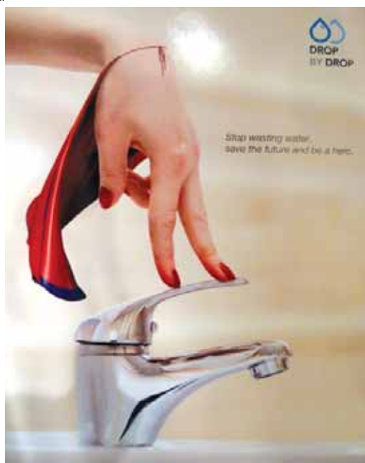
«Не трать много воды. Стань героем - спаси будущее». Дерья Тачи. Турция.

за одним экологическим проектом стар-тует другой - энергетический. О том, как можно сократить потребление электроэнергии, специалисты будут рассказывать самым юным, а порой и самым сознательным гражданам - школьникам. Такие занятия, посвященные проблеме изменения климата, будут проходить в форме энергетического детектива. Ребята узнают, что может предпринять каждый из них, чтобы сделать жизнь на планете лучше. Кроме того, придя домой, они расскажут родителям, как экологический образ жизни поможет сэкономить семейный бюджет. Ведь из текущего крана капля за каплей уходит не только живительные блага, но и кровно заработанные деньги.