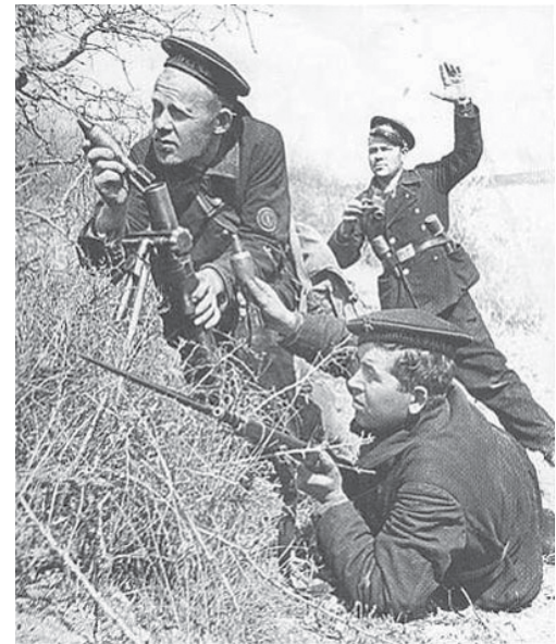
В бой идет морская пехота.

Родина высоко оценила подвиги морских пехотинцев. Пять бригад и два батальона морской пе-