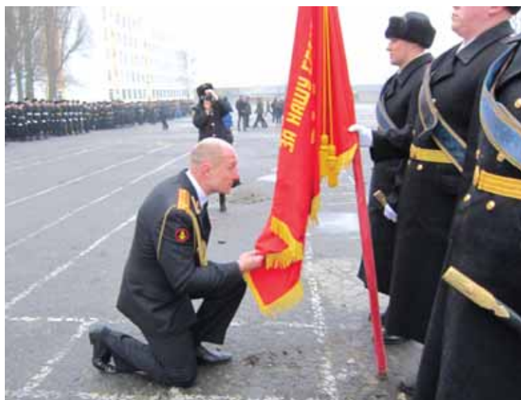
Прощание с Боевым Знаменем.