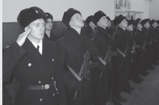
Молодое пополнение бригады кораблей ОВР.