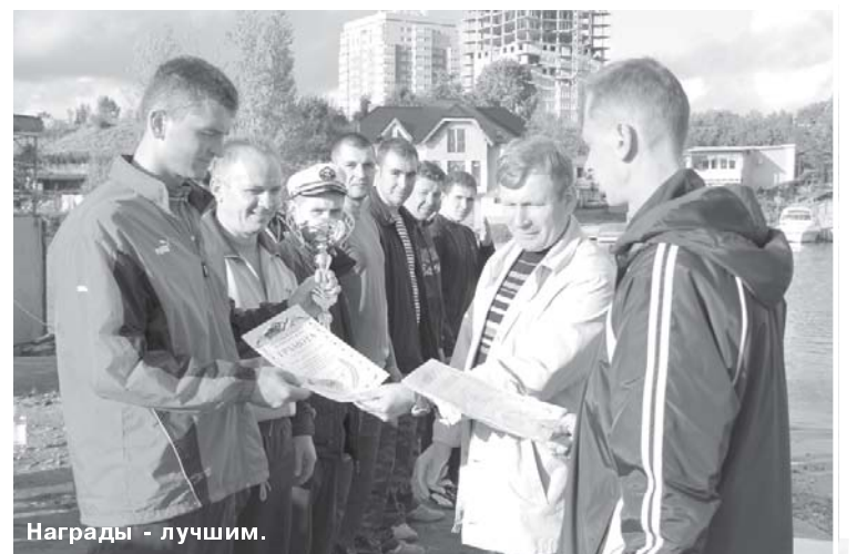
Награды – лучшим.