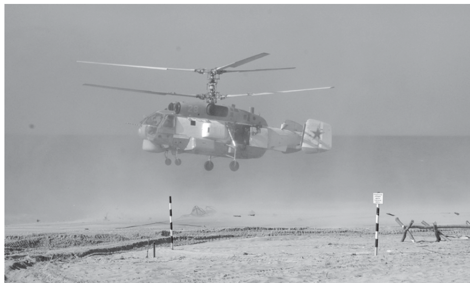
В воздухе – вертолетчики БФ.