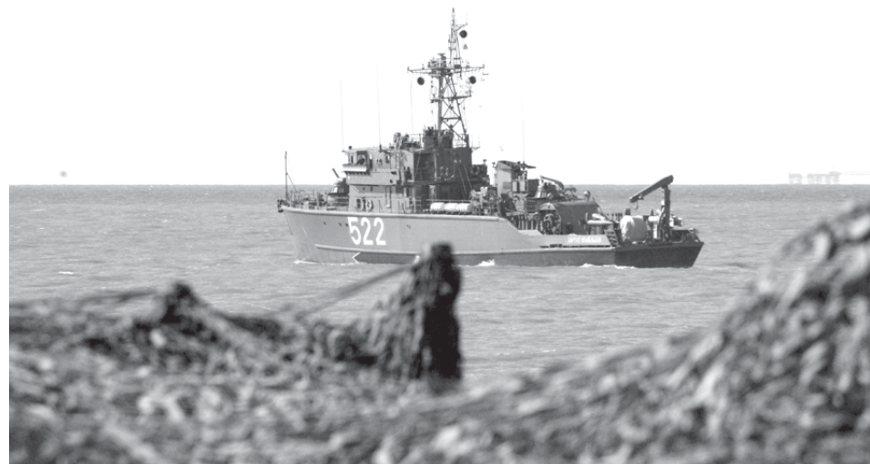
В море – корабли из соединения охраны водного района.