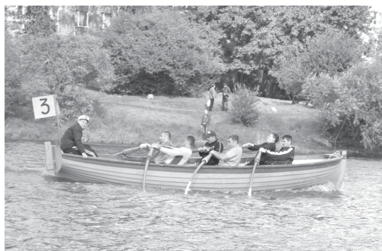
«Весла – на воду!».

Андрей ОМЕЛЬЧЕНКО.