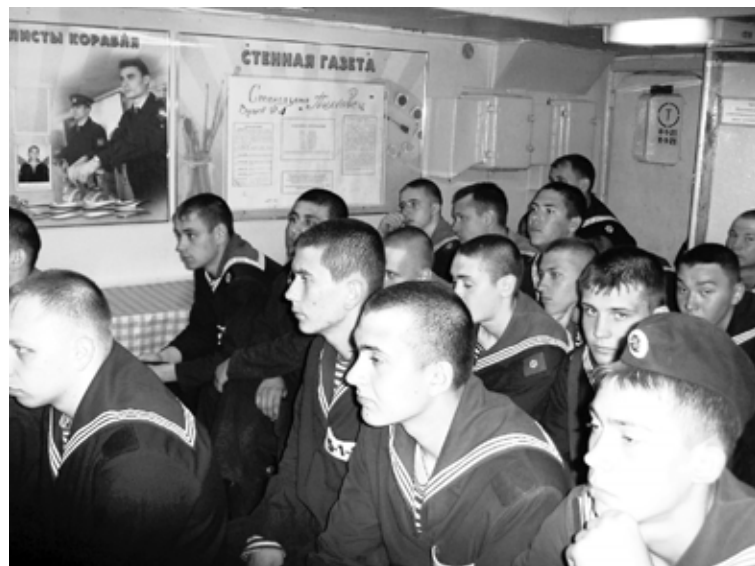
Занятия с военнослужащими по призыву.

в экипаже немало «неместных» военнослужащих, для которых довольно остро стоит жилищная проблема, и по этой причине многие моряки еще не перевезли семьи в Балтийск. Тревога за близких, оставшихся в Питере, переживания, связанные с изменением обстановки, когда людей буквально вырвали из привычной среды, особенно остро давали о себе знать на первых порах. Наумова без труда прочла эти «симптомы» еще месяц назад при пер-