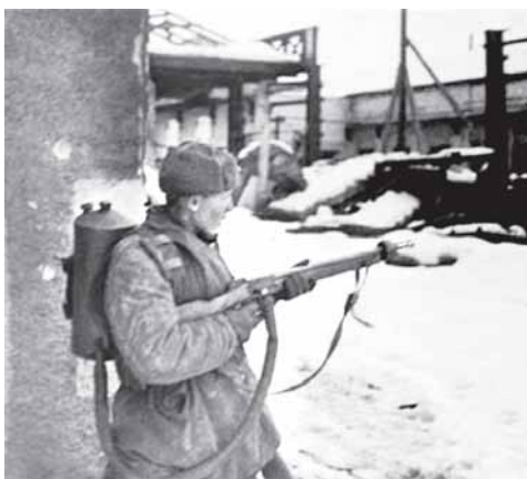
Применение огнеметных фугасов во время Великой Отечественной войны.

Утром 9 октября загрохотала фашистская артиллерия. Затем около 50 вражеских танков и бронетранспортеров двинулись на позицию батальона. За танками и в