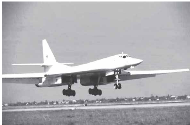
Стратегический бомбардировщик ТУ-160.

Прежде всего отметим, что проводимая в стране военная реформа – это не чья-то выдумка, без которой, как кое-кто считает, можно было обойтись, а объективная необходимость на новом витке исторического развития Российского государства. В чем заключается эта объективная необходимость?