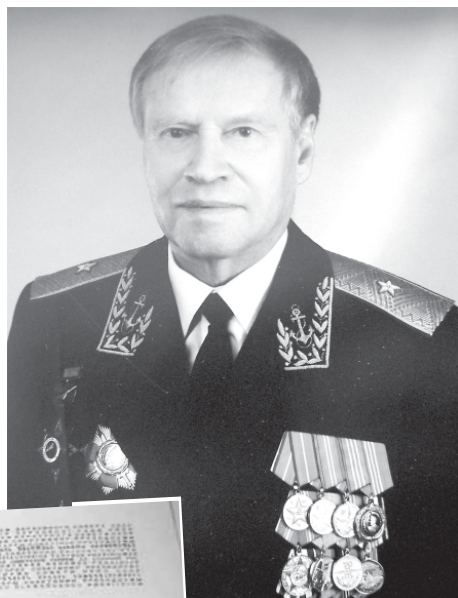
Генерал-майор Г. Волков.

...1962 год – это был самый тяжелый момент в отношениях между СССР и США и самый опасный момент после Второй мировой войны, когда реально могла начаться Третья мировая. 50 тысяч советских военнотружеников было переведено под бок дядюшке Сэму. Там были и флотские ракетные катера, и бомбардировщики Ил-28. Были завезены ракеты и ядерные боеголовки. Американцы заблокировали остров, выставив повсюду крейсе-