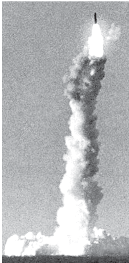
Старт ракеты с подводной лодки.

К настоящему времени прошли модернизацию по программе «Фаворит-С» все зенитные ракетные системы С-300 ПМ, стоящие на вооружении зенитных ракетных полков войск ВКО. В перспективе к 2020 году около 100% зенитных ракетных полков ВКО планируются перевооружить на зенитную ракетную систему С-400, зенитный ракетно-пушечный комплекс «Панцирь-С», а также зенитный ракетный комплекс «Витязь». перевооруже-