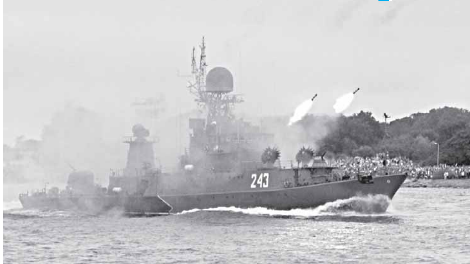
МПК на параде в честь Дня ВМФ.

69 лет – возраст почтенный, особенно если это касается военно-морского соединения боевых кораблей, где каждый год – это сумма человеческих судеб, поступков и свершений.