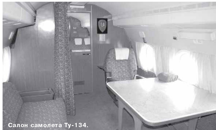
Салон самолета Ту-134.

Юрий ДМИТРИЕВ. Фото автора и С. Рослина.