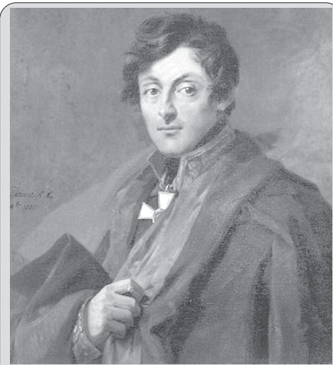
ОСТЕРМАН-ТОЛСТОЙ Александр Иванович (1770-1854), граф, генерал от инфантерии (1817). Человек поразительного благородства и удивительной храбрости. На военной службе с 14 лет, боевое крещение принял в 1788 году в войне против турок. В 1790 году под командованием А.В.Суворова участвовал в штурме Измаила, за отличие и личную храбрость награжден орденом Св.Георгия IV степени. В 28 лет произведен в генерал-майоры. Командуя 2-й дивизией, отличился в сражении при Прейсиш-Эйлау (1807), сумев сдержать удар корпуса Даву, и стал, по сути, спасителем всей русской армии. В Отечественную войну 1812 года отличился при Островно и при Бородине, был контужен, но вернулся в строй. Прославил свое имя под Бауценом и под Кульмом (1813), где потерял левую руку, оторванную ядром. Награжден орденом Св.Георгия II степени и большим прусским Железным крестом (награда, которая за всю свою историю вручалась только семь раз). В 1817 году уехал лечиться за границу и, как оказалось, навсегда. Умер в Женеве.

Стесненное лесами пространство оставляло мало места для правильных маневров и приводило к большим потерям от артиллерийского огня. Когда Остерману-Толстому доложили об этом и предложили отвести пехоту назад, он отдал краткий приказ: «Стоять и умирать!» Новая атака кавалерии опять