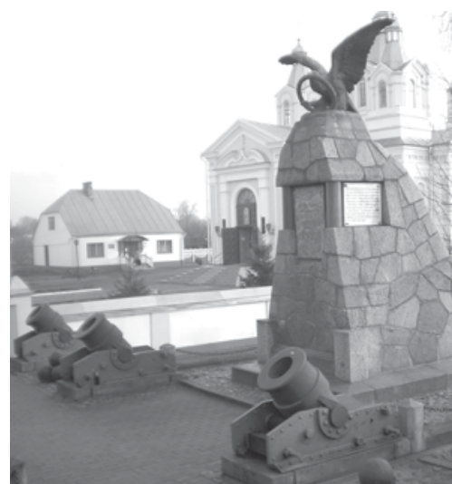
Памятник русским воинам, одержавшим победу над войсками Наполеона в пределах России 15 июля 1812 года. Г.Кобрин. Беларусь.