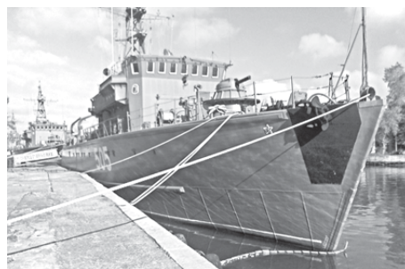
Базовый тральщик «Алексей Лебедев».

В столбах огня дай полный ход, Дай устремление торпеде. Таким в боях идет к победе Моряк, чья жизнь и сердце — Флот!