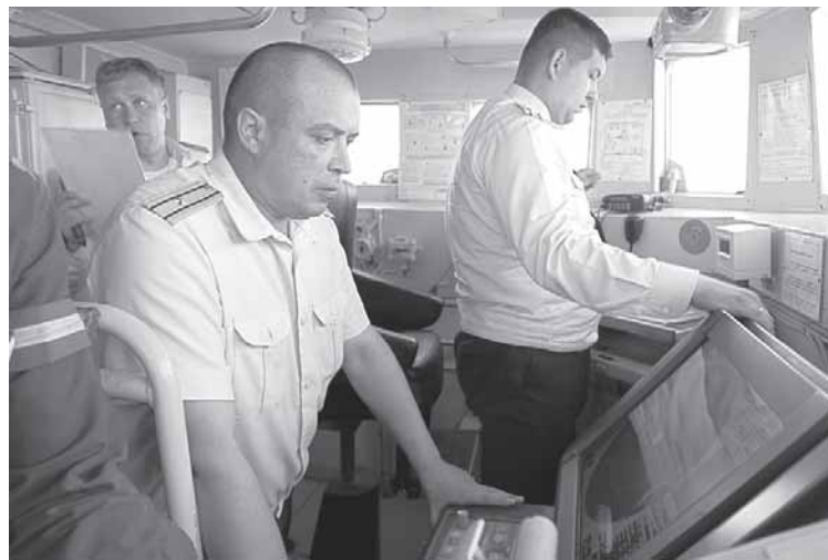
Средства РТС освещают надводную обстановку.

Юрий ВЛАДИМИРОВ.