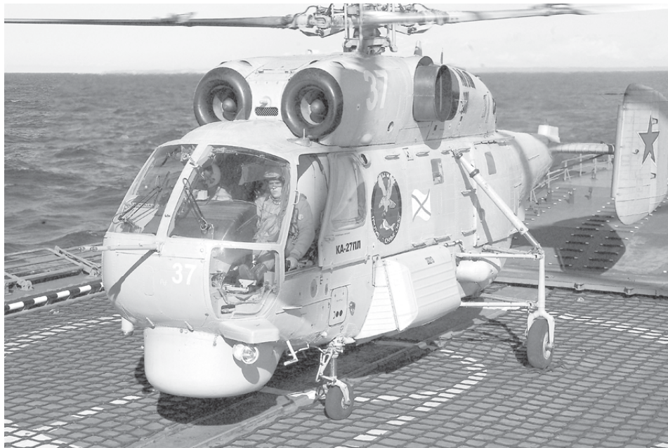
Морская авиация оттачивает мастерство.

А вертолет после посадки, если кто не знает, надо швартовать. Бортовые техники с помощью специальных цепей крепят его на палубе корабля. Цепь имеет определен-