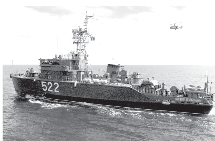
Тральщик «Сергей Колбасев» во время учений на Балтике.

Юрий ШЕВЧЕНКО. Фото автора и из архива «СБ».