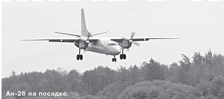
Ан-26 на посадке.