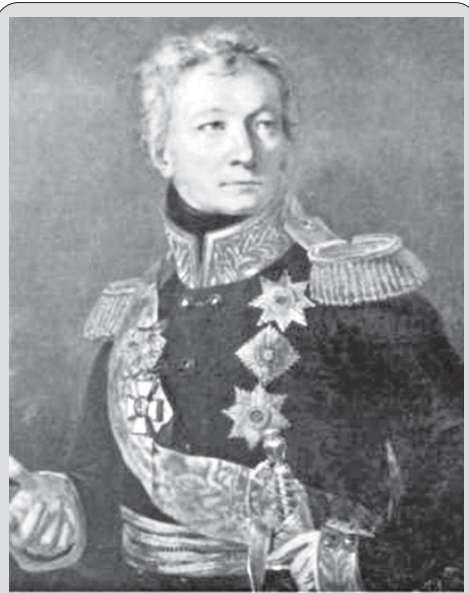
ТОРМАСОВ Александр Петрович (1752-1819), граф, генерал от кавалерии. Участник войн с Турцией, Польшей, Францией. В 1812 году главнокомандующий 3-й русской армией. Одержал первую в Отечественной войне 1812 года победу над неприятелем в г. Кобрине. С 1814 года – московский генерал-губернатор. Внес значительный вклад в восстановление Москвы после пожара.

26 (14) июня Наполеон выступил из Ковно на Вильно, надеясь быстрым движением помешать сосредоточению русских войск. 28 (16) июня неприятель атаковал перед Вильно аррьергард корпуса Тучкова, прикрывавший отступление. Последним выступил из Вильно граф Орлов-Денисов с лейб-казацким полком. В полдень в столицу бывшей Литвы торжественно въехал Наполеон, встреченный магистратом с ключами города и восторженными криками поляков, называвших этот день днем освобождения земли Гедиминовой.