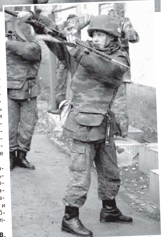
Идет отработка приемов рукопашного боя.