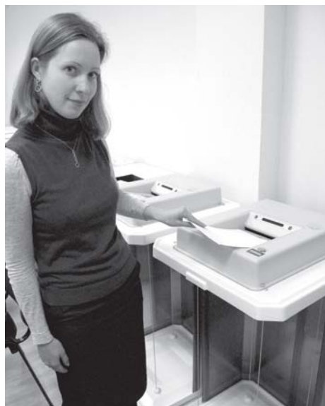
Демонстрация работы комплекса автоматической обработки избирательных бюллетеней.