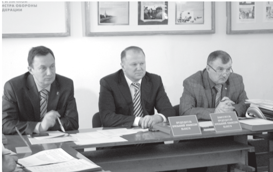
Идет работа призывной комиссии.