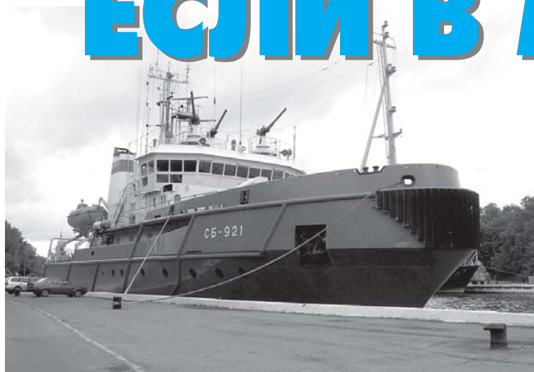
Морской спасательный буксир «СБ-921».

Как галантный кавалер провожает барышню домой, обещая в дороге от разных неожиданностей, так и морской буксир должен доставить вверенный его заботам корабль в целости и сохранности, скажем, из точки А в точку Б. После выполнения функции эскорта буксир вновь вернется в Балтийск и, конечно, «не с пустыми руками», поскольку «СБ-921» на обратном пути предстоит