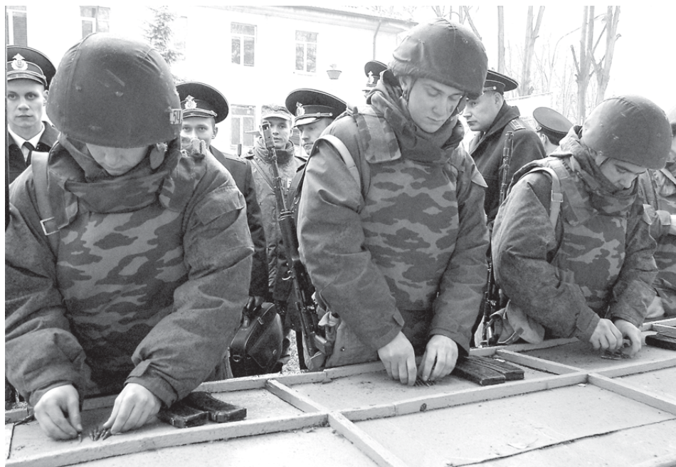
На учебном месте по зарядке магазинов.