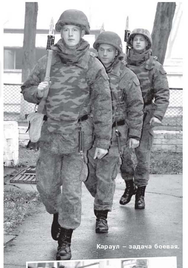
Караул – задача боевая.

Для более уверенных действий в карауле военнослужащие учатся не только правильно и громко произносить команды, но и заряжать и разряжать магазины боевыми патронами, отрабатывать технику рукопашного боя. Что и было продемонстрировано в ходе учебно-методических сборов в мотострелковом полку.