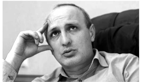
Глава МВД Вану Мерабишвили

Министра внутренних дел Вану Мерабишвили называют «самым серьёзным ресурсом», «локомотивом» правящей партии «Единое национальное движение» и на парламентских, и на президентских выборах в 2013 году. Ведь с его именем связан самый весомый успех Грузии последних лет – результативная борьба со взяточничеством и организованной преступностью. По данным социологических исследований, доверие населения к полиции в бытность Мерабишвили главой МВД скакнуло с нуля чуть ли не до 85 процентов.