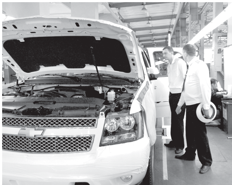
Офицеры Балтийского флота знакомятся с новыми автомобилями.

Недавно одну из производственных площадок ООО «Автотор Холдинг» посетила группа офицеров Балтийского флота.