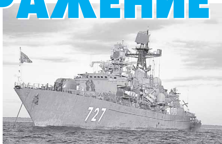
СКР «Ярослав Мудрый».