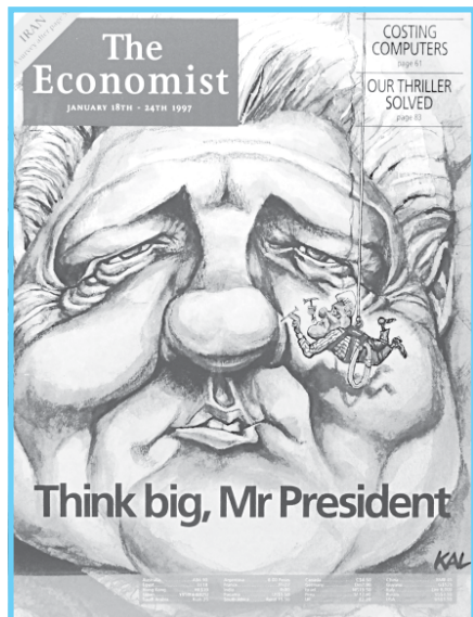
Кевин Каллахер. «Не мелочитесь, г-н президент». (Билл Клинтон работает над своим наследием). 1997 г.

Цикл «Дырка на карте» Игоря Пашенко посвящен теме одиночества человека на необитаемом острове и одновременно теме личной свободы, актуальной для людей во все времена.