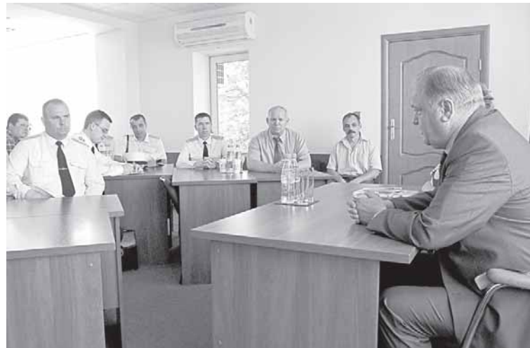
Руководство предприятия отвечает на вопросы балтийцев.

Весомую финансовую помощь «Автотор Холдинг» оказывает при рождении в семье сотрудника ребенка. Особо ощутимую сумму получают семьи, в которых появилась третий малыш. Материальная помощь предусмотрена и