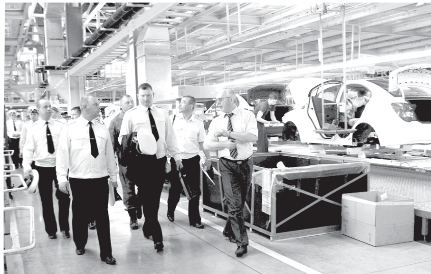
Экскурсия по автосборочному предприятию.

Цель столь необычного визита – познакомиться поближе с предприятием, его потенциалом, культурой производства, линейкой выпускаемой продукции, перспективами дальнейшего развития холдинга. Ведь не секрет, что в рамках реформирования Вооруженных Сил на территории области были уволены сотни военнослужащих Балтфлота. Более того, процесс оптимизации флотских структур продолжается, а значит, еще десятки образованных и полных сил людей выйдут на региональный рынок труда. В свою очередь предприятие заинтересовано в притоке грамотных квалифицированных кадров самого различного уровня.