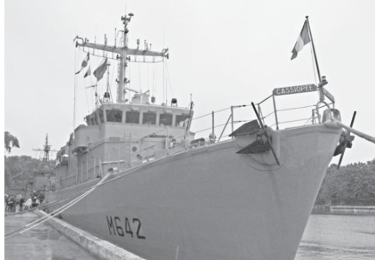
Тральщик-искатель мин «Кассиопея» в Балтийской ВМБ.

Корабль с именем легендарной царицы на борту под проливным дождем ошвартовался на том же причале у гостиницы «Золотой якорь», где год назад бросил якорь такой же французский военный корабль – искатель мин под названием «Сефе». Второй год подряд французам явно не везет с погодой, но какой моряк не рад отдыху в тихой гавани?