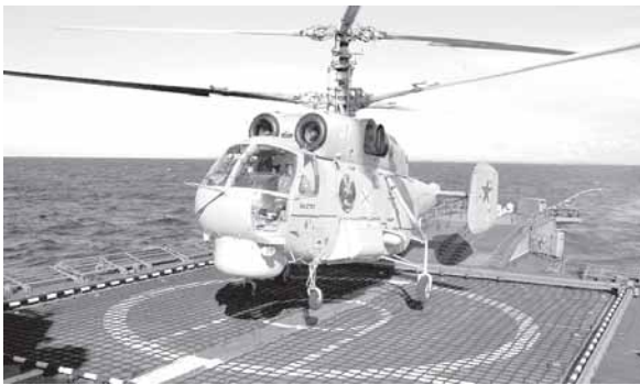
Посадка вертолета Ка-27ПЛ на борт корабля.

– Это плановые мероприятия. В прошлом году они проходили в начале года, в этом – в мае. Решили провести их именно в переходный период накануне летнего периода обучения, заранее определили, на каких вопросах надо акцентировать внимание, – говорит С. Волков. – Мы спланировали типовой выход корабля. Исходим из того, что, выходя в море, военный корабль может встретиться с реальным противником. Экипаж должен знать, как надо действовать в той или