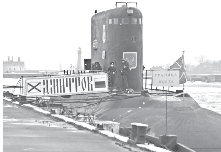
Подводная лодка «Дмитров».

Соединение подводных лодок БФ - старейшее в Российском флоте и колыбель отечественного подплава. Нынешнее поколение прославленного соединения, продолжая славные боевые традиции героев подводных глубин, настойчиво совершенствует боевое мастерство и морскую выучку, успешно выполняет поставленные задачи.