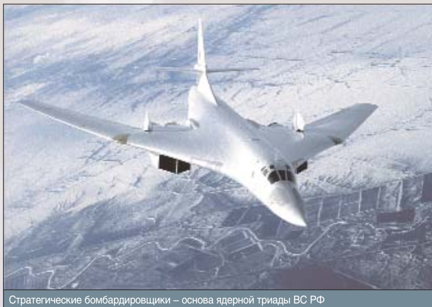
Стратегические бомбардировщики – основа ядерной триады ВС РФ

Перспективный авиационный комплекс дальней авиации (ПАК ДА) будет способен решать задачи в обычной и ядерной войнах, использовать широкую номенклатуру ударного и оборонитель-