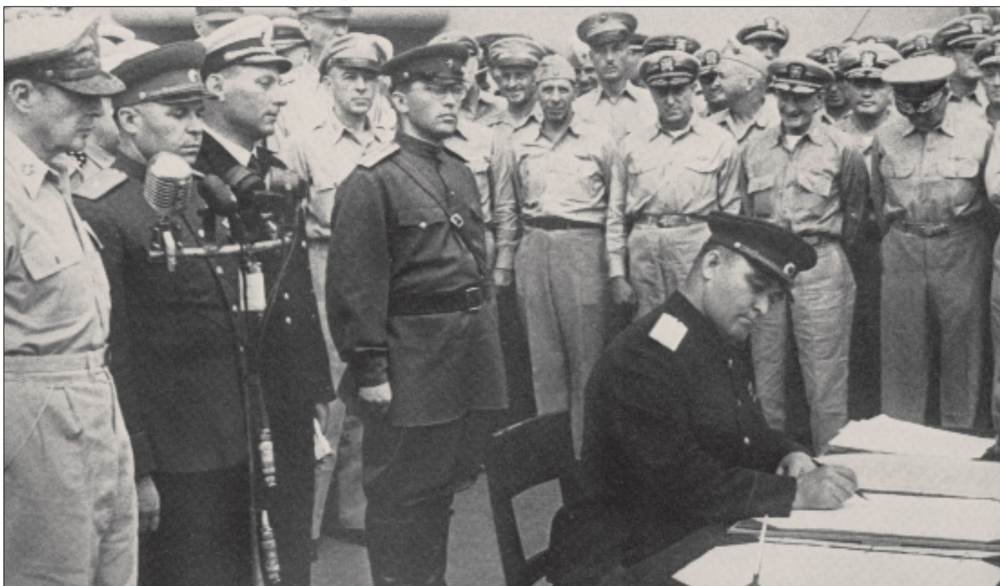
Подписание акта о безоговорочной капитуляции Японии

ско-японские отношения в первой половине XX века складывались, мягко говоря, не лучшим образом.