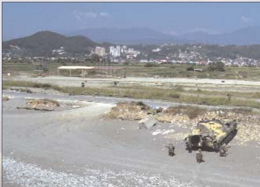
Одной из ключевых фаз учений стала высадка морского десанта

23 июля корабли ДЕСО в составе десантной, тральной и поисково-ударной групп отработали ряд учебно-боевых упражнений в составе походного ордера. По планам учений переброска десанта проходила в условиях минной опасности, а на переходе морем корабли подвергались атакам воздушного, надводного и подводного противника.