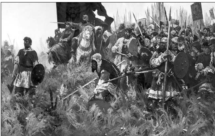
Утро на Куликовом поле Художник А. Бубнов

С момента первого упоминания о применении огнестрельного оружия и до конца XIV века на страницах фундаментального исторического исследования С.М. Соловьёва мы встречаем очень мало упоминаний о применении огнестрельного оружия в русских землях. В этот период оно не получило распространения вследствие своей низкой боевой эффективности и надёжности. Так, С.М. Соловьёв, описывая осаду псковичами немецкого города Нейгаузена, подчёркивал, что они били его стены пушками. При выстреле из большой пушки «колода у неё вся изломалась и железа разорвало», после чего псковичи были