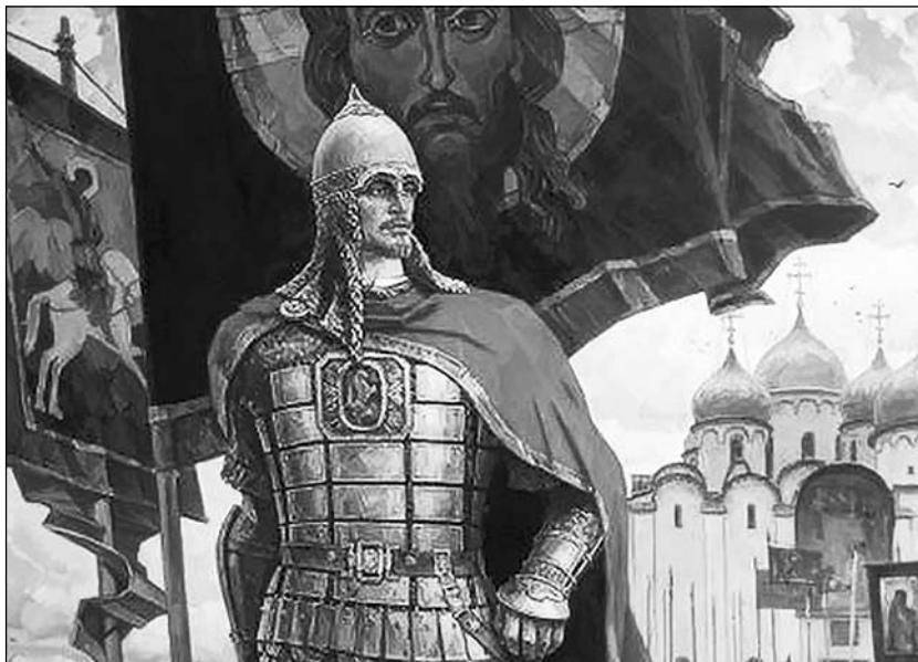
Александр Невский Художник Ю. Пантюхин

года княжения Калиты, Великое княжество Московское испытало теперь неприятельское нашествие» 32 .