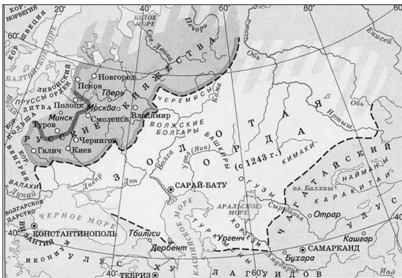
Золотая Орда и подвластные ей русские княжества в XIII в.

Некоторые современные издания дают соотношение сил противников. В Советской исторической энциклопедии количество русских войск определяется в 15—17 тыс. человек, а войск противника — 10—12 тыс. человек 26 . Подобное же соотношение сил даётся в Военном энциклопедическом словаре 27 , а также в Истории военного искусства Е. Разина 28 . Очевидно, более