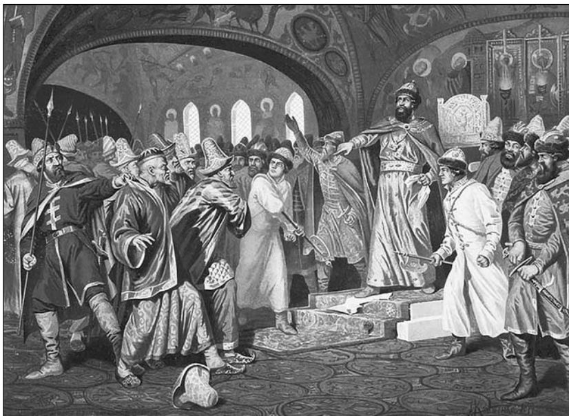
Иван III топчет послание хана Художник А. Кившенко

Возросшая военная мощь Великого княжества Московского предопределила итоги вооружённого столкновения с войсками Большой Орды, которая предприняла попытку привести к покорности своих бывших данников. Сила русского войска была столь велика, что монголо-татары не решились на битву