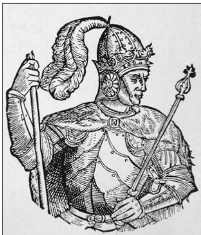
Великий князь Литовский Витовт

Успешное вооружённое противостояние Московского княжества против войск Великого княжества Литовского свидетельствовало о достаточно высоком уровне состояния военного дела. Мы знаем, что польско-литовские войска обладали высокой боеспособностью. Об этом свидетельствует их победа над Немецким (Тевтонским) орденом под Грюнвальдом в 1410 году. Уже в 1399 году великий князь Литовский Витовт располагал специальным обозом, составленным из «кованых телег на цепях железных со многими пищалями, и пушками, и самострелами» 78 . Подобные подвижные укрепления Великое княжество Литовское успешно применяло в своей активной захватнической политике.