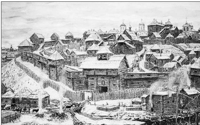
Московский Кремль при Иване Калите Художник А. Васнецов

Вооружение русских воинов составляли рогатины, сулицы 53 , копья, сабли, мечи, ослопы 54 , топоры. В сражениях часто применялись копья: во время Куликовской битвы задний ряд воинов укладывал копья не плечи передним, у которых копья были короче. Упоминается также о применении шестопёров 55 русской пехотой и кавалерией 56 . В качестве индивидуального защитного вооружения применялись щиты, шлемы, князья употребляли броню дощатую 57 . Для защиты