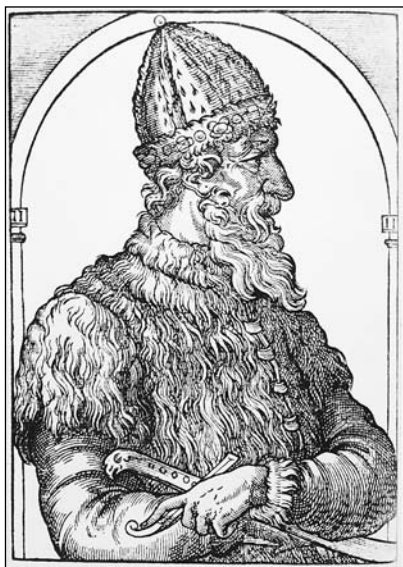
Великий князь Московский Иван III

В войсках Витовта была и мощная артиллерия. В 1427 году во время осады города Порхова литовцы применяли пушку с названием «Галка» огромной величины. Её размеры были столь значительны, что во время похода её возили 40 лошадей попеременно 79 .