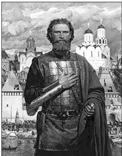
Князь Дмитрий Донской Художник В. Маторин

лошадей применялись личины 58 и кожаные кояры 59 , которые могли позволить себе лишь богатые люди 60 . Качество индивидуального защитного вооружения было довольно высоким. Об этом, в частности, свидетельствует обращение к великому князю Московскому его союзника крымского хана Менглы-Гирея с просьбой прислать в подарок русский панцирь 61 .